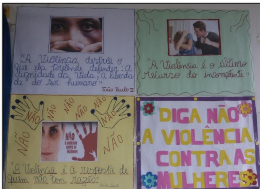
Figura 16 - Cartazes de protesto a violência contra as mulheres