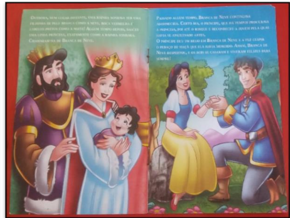
Figura 7 - História da Branca de Neve