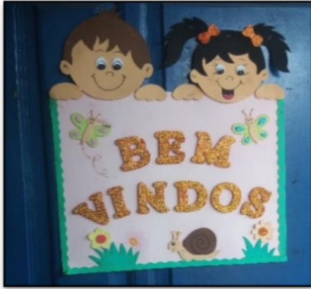
Figura 2 -Painel de boas vindas

da sala de aula, além dos painéis de alfabeto e numerais também havia o de aniversariantes, o do cantinho da leitura e o calendário com desenhos representando a menina e o menino como mostram as imagens abaixo.