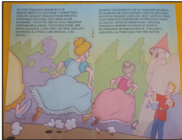
Figura 6 - História das 12 Princesas