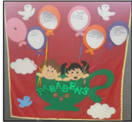
Figura 3 - Painel de aniversário