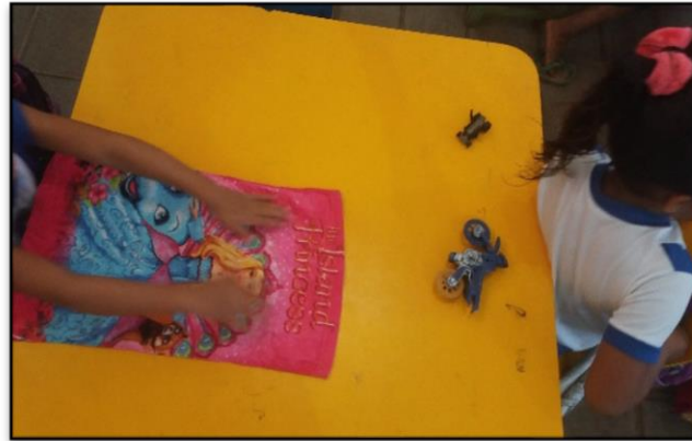
Figura 12 – Acessórios