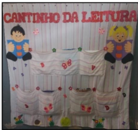
Figura 4 - Cantinho da leitura