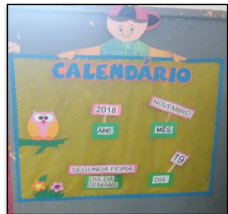
Figura 5 - Calendário