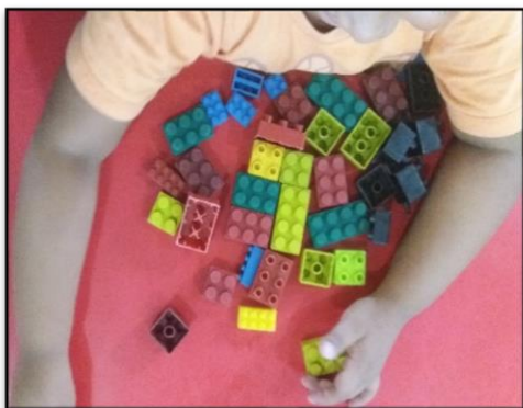
Figura 8 - Brinquedo de montar

trazidos da casa que meninos e meninas brincavam a maior parte do tempo. As imagens abaixo, são exemplos de alguns desses brinquedos e momentos de brincadeiras identificados durante a pesquisa.