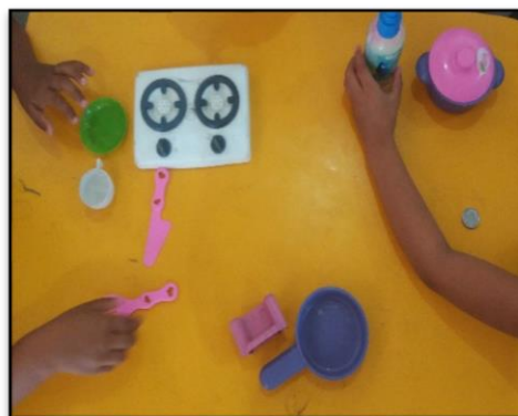
Figura 11 - Fogão e panelas