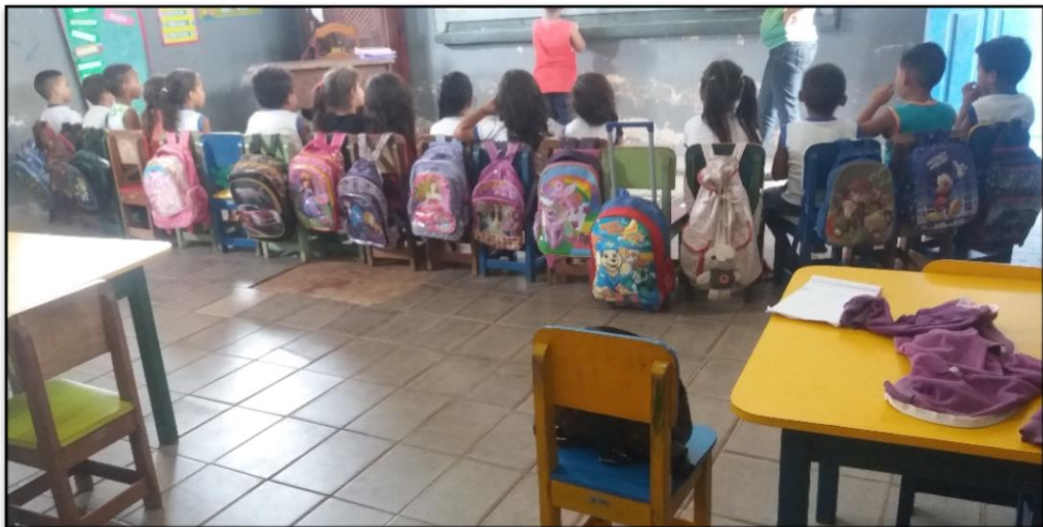
Figura 13 – Alunos/as com seus acessórios