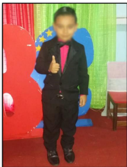
Figura 14 - Aluno

Um exemplo bem interessante, de que a cultura e as marcas que nos caracterizam podem passar por modificações foi identificado durante a pesquisa, onde, pude vivenciar no dia da colação das crianças dos períodos II o rompimento do preconceito com a cor rosa pink , que foi usada também pelos meninos em suas camisas como mostram as imagens.