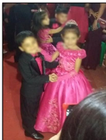
Figura 15 - Alunas e alunos