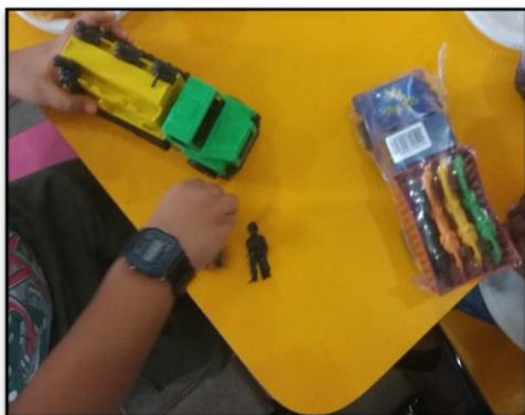
Figura 10 - Carros e soldados