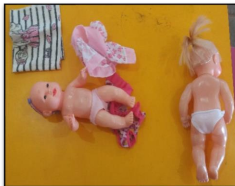
Figura 9 - Bonecas