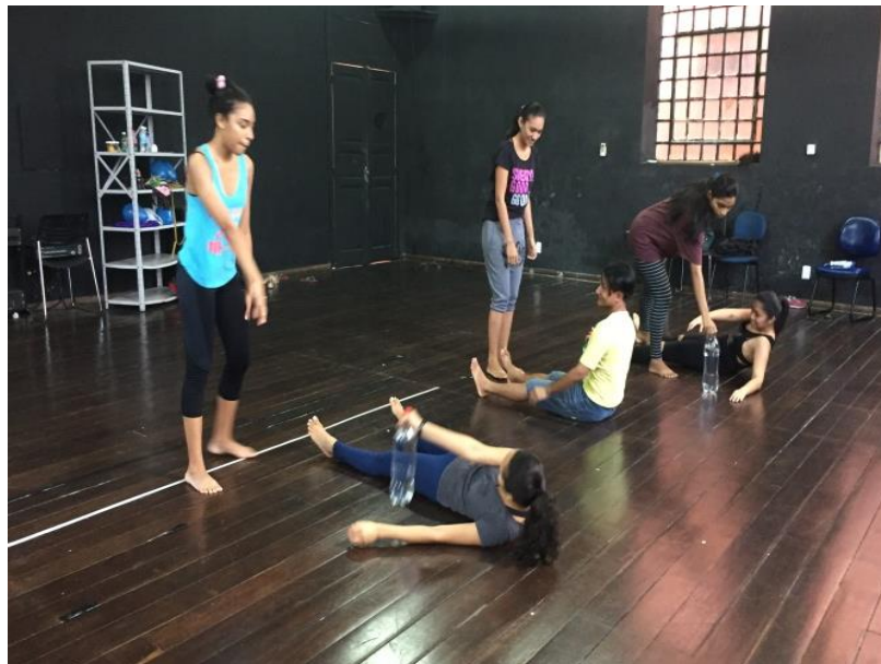
Imagem 1. Experimentação com a garrafa