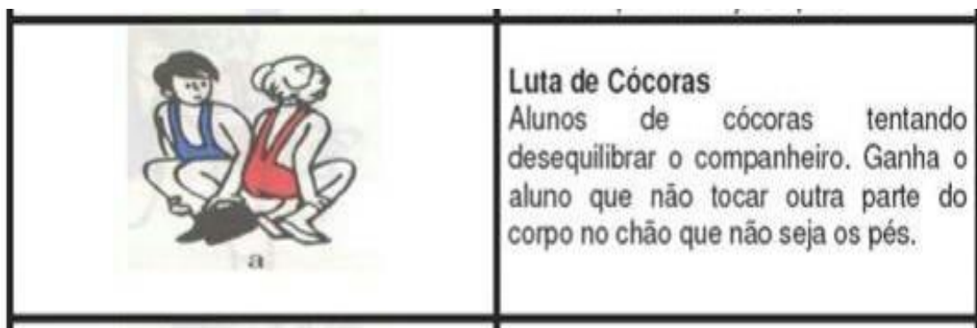
Figura 1: Luta de Cócoras.

Os alunos de cócoras tentando desequilibrar o companheiro. Ganha o aluno que não tocar outra parte do corpo no chão que não seja os pés. (OLIVEIRA e DOS SANTOS, 2006). Pé com pé, os alunos sentados no chão com os pés unidos. Objetivo é fazer com que o seu colega toque com as costas ou com as mãos no chão. (OLIVEIRA e DOS SANTOS, 2006). Em ambas as brincadeiras/dinâmicas os objetivos foram estimular habilidades físicas especificamente equilíbrio e conscientizar a percepção corporal (figura 1 e 2).