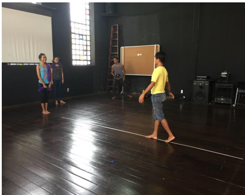
Imagem 2: Aluno equilibrando na linha.

Para o desenvolvimento desta atividade, que propõe o equilíbrio, também importante para técnica do sapateado, utilizando a transferência de peso em seus movimentos. Os alunos tinham que atravessar uma faixa que estava no chão da sala sem pisar fora dela e mantendo o foco do olhar sempre para frente, em seguida repetirem a atividade, porém de olhos vendados.