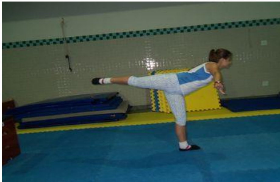
Imagem 3: Pose do aviãozinho.