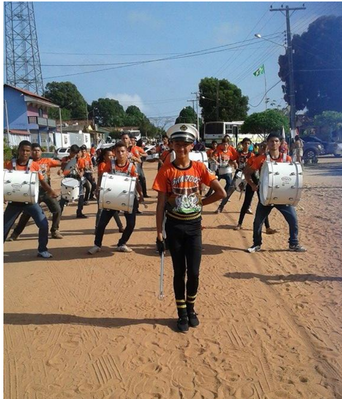
Figura 4 – Desfile da Semana da Pátria na Vila São Paulinho.

Descrição: Na fotografia, o autor aparece em primeiro plano, à frente da banda, exercendo a função de baliza. Ele veste calça preta, luvas escuras e uma camisa laranja com predominância dessa cor, onde se destaca a logomarca e o nome “BANJOGS”. Usa um quepe branco com preto e segura um bastão prateado na mão direita. Atrás dele, os demais integrantes da banda também usam a mesma camisa laranja, porém sem chapéu, e tocam instrumentos de percussão enquanto marcham. O desfile acontece em uma rua de chão de areia, típica de vila, com casas, árvores e fios de energia ao fundo. A cena registra um momento de apresentação em que música, dança e marcha se entrelaçam.