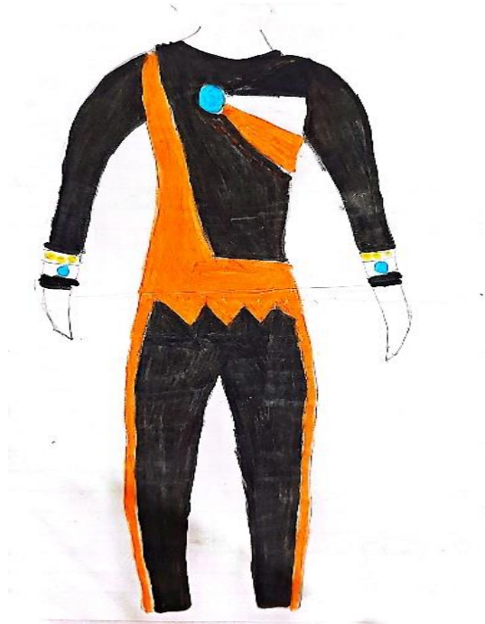
Figura 3 – Primeiro uniforme de Baliza da BANJOGS.

Descrição: Desenho de um uniforme de corpo inteiro, predominantemente preto, com detalhes em laranja nas laterais e no tronco. No peito há um círculo azul em destaque, e nos punhos, pequenos ornamentos em branco, amarelo e azul. O design valoriza linhas geométricas e contrastes de cor.