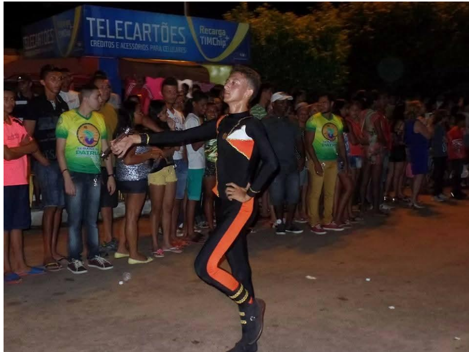
Figura 5 – Apresentação na Avenida Santa Maria.

Descrição: O autor aparece em destaque no centro da avenida, marchando de cabeça erguida, segurando o bastão na mão direita. Veste calça preta com faixa lateral laranja e adorno dourado próximo aos pés, além do uniforme preto e laranja característico da baliza. Ao fundo, o público acompanha o desfile, com pessoas em pé ao longo da rua, algumas observando atentamente sua performance .