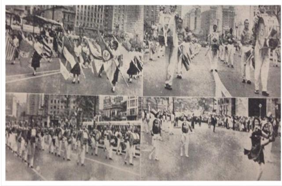
Figura 1 – III Campeonato Colegial de Fanfarras e Bandas de 1958.

Descrição 1: Imagem em preto e branco, dividida em quatro quadros, retrata a linha de frente de corporações musicais. Em todos os quadros várias pessoas trajadas de uniforme de bandas. Em especial uma das imagens apresenta uma figura feminina em destaque, a qual encontra-se lançando a perna para frente. A qualidade da imagem impossibilita definir características individuais dos sujeitos da foto.