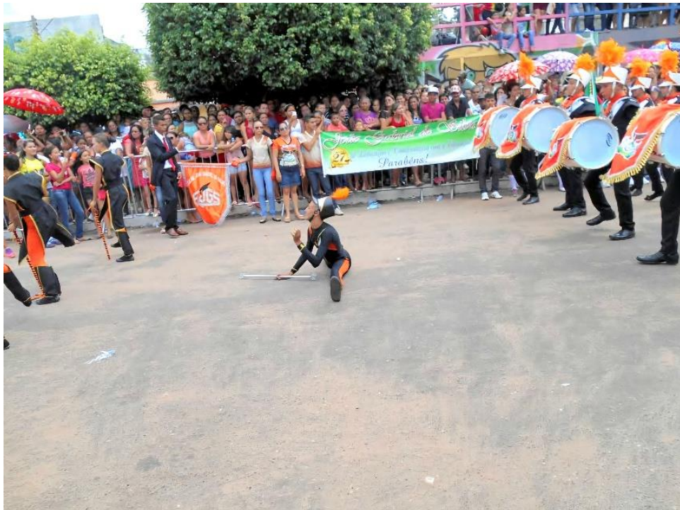
Figura 6 – Estreia como baliza no desfile cívico.

Descrição: Na imagem apareço realizando uma abertura de frente, segurando o bastão, durante minha estreia oficial como baliza no desfile cívico de 7 de setembro em Santa Maria do Pará. Estou com o uniforme preto e laranja já descrito anteriormente, agora acompanhado de uma barretina na cabeça. Atrás de mim está a banda em formação, com o corpo coreográfico à frente, enquanto o público, separado por grades de metal, observa atentamente dos dois lados da avenida. A cena registra um momento de grande visibilidade, marcado tanto pela solenidade do desfile quanto pela intensidade do meu gesto em ocupar a linha de frente.