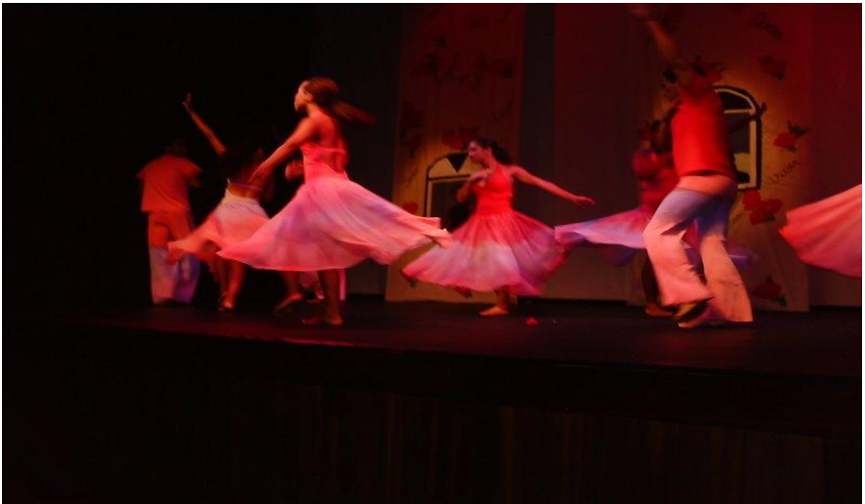
Figura 14- Espetáculo Degraus 2008