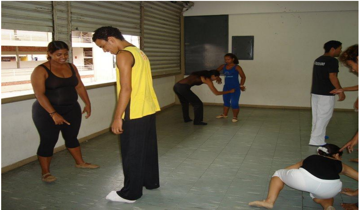
Figura 27 - Laboratório de contato e improvisação para o espetáculo "Formatos"