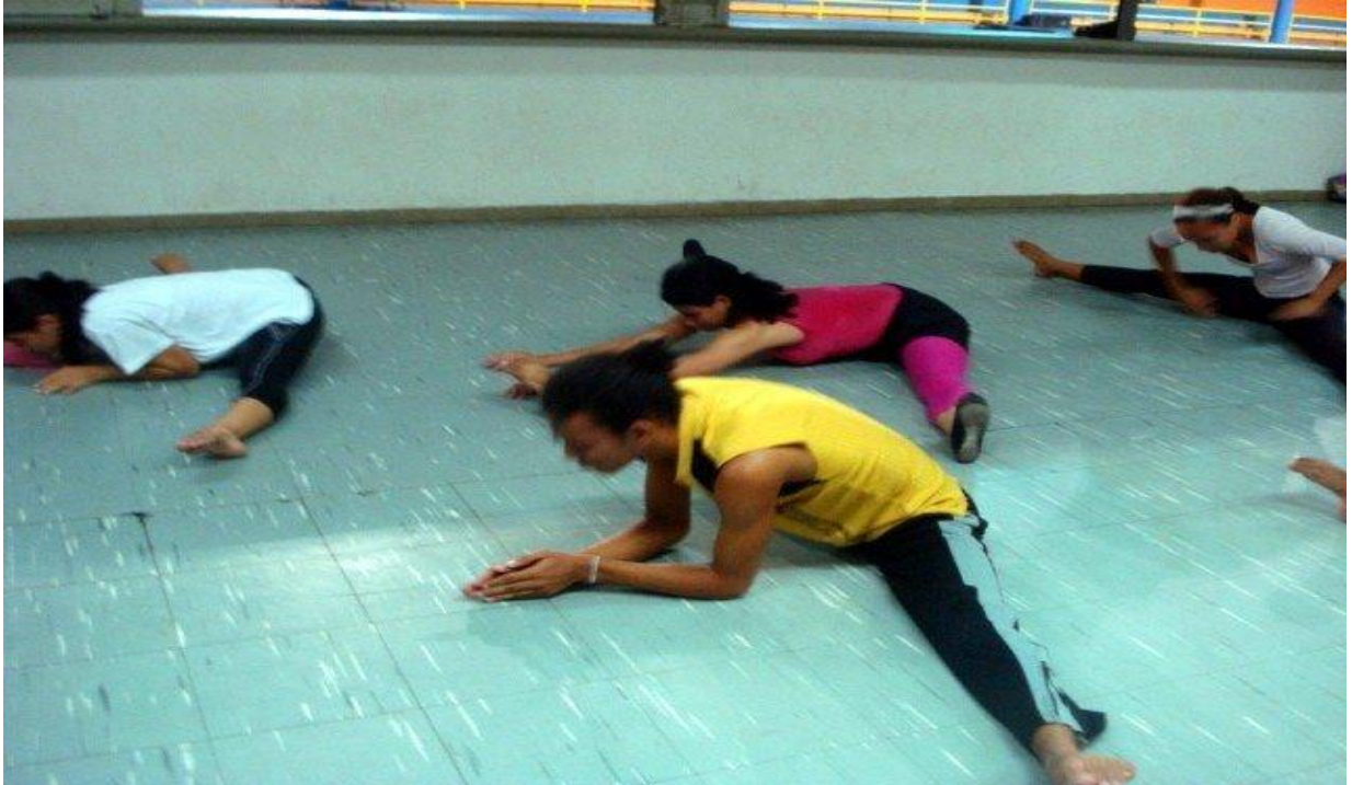
Figura 10 - Aulas de flexibilidade da Cia. Municipal de Dança de Belém