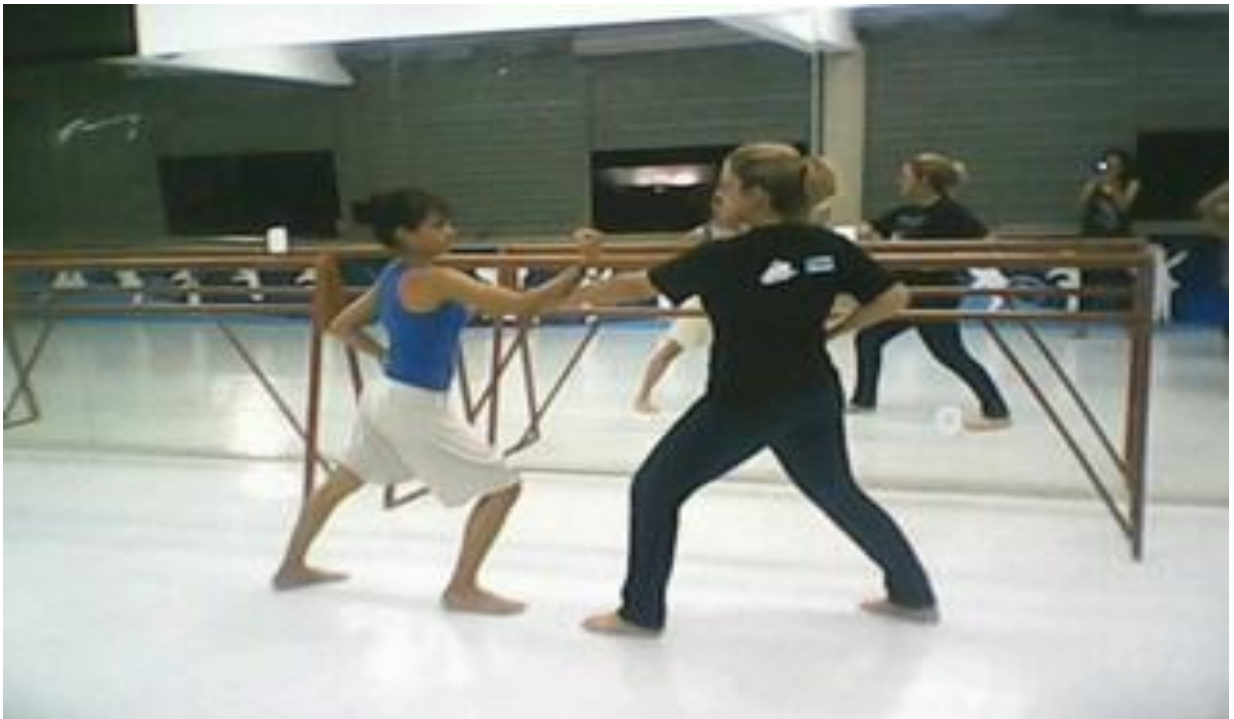
Figura 8 - Aulas de karatê na Cia. Municipal de Dança de Belém