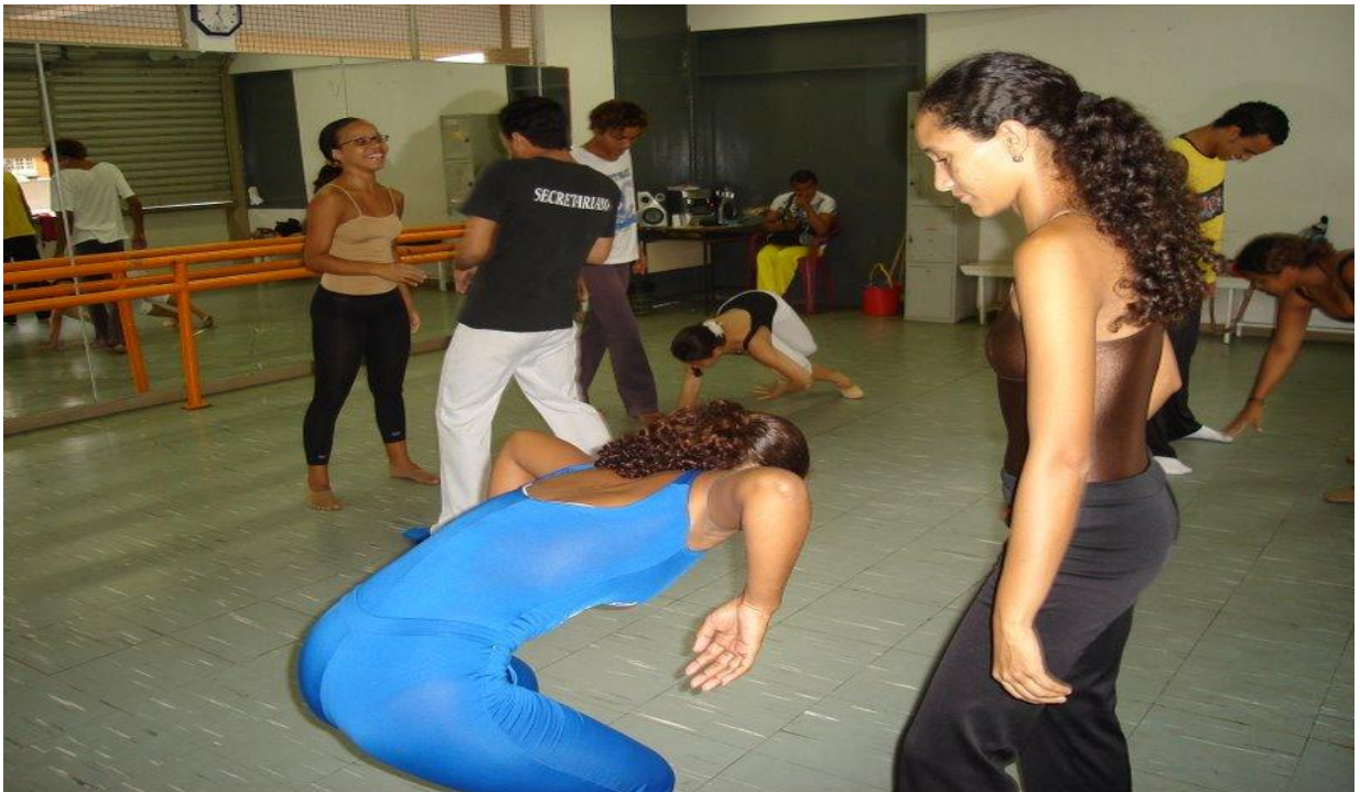
Figura 26 - Laboratório de contato e improvisação para o espetáculo "Formatos"