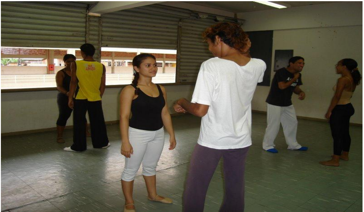
Figura 24 - Laboratório de contato e improvisação para o espetáculo "Formatos"