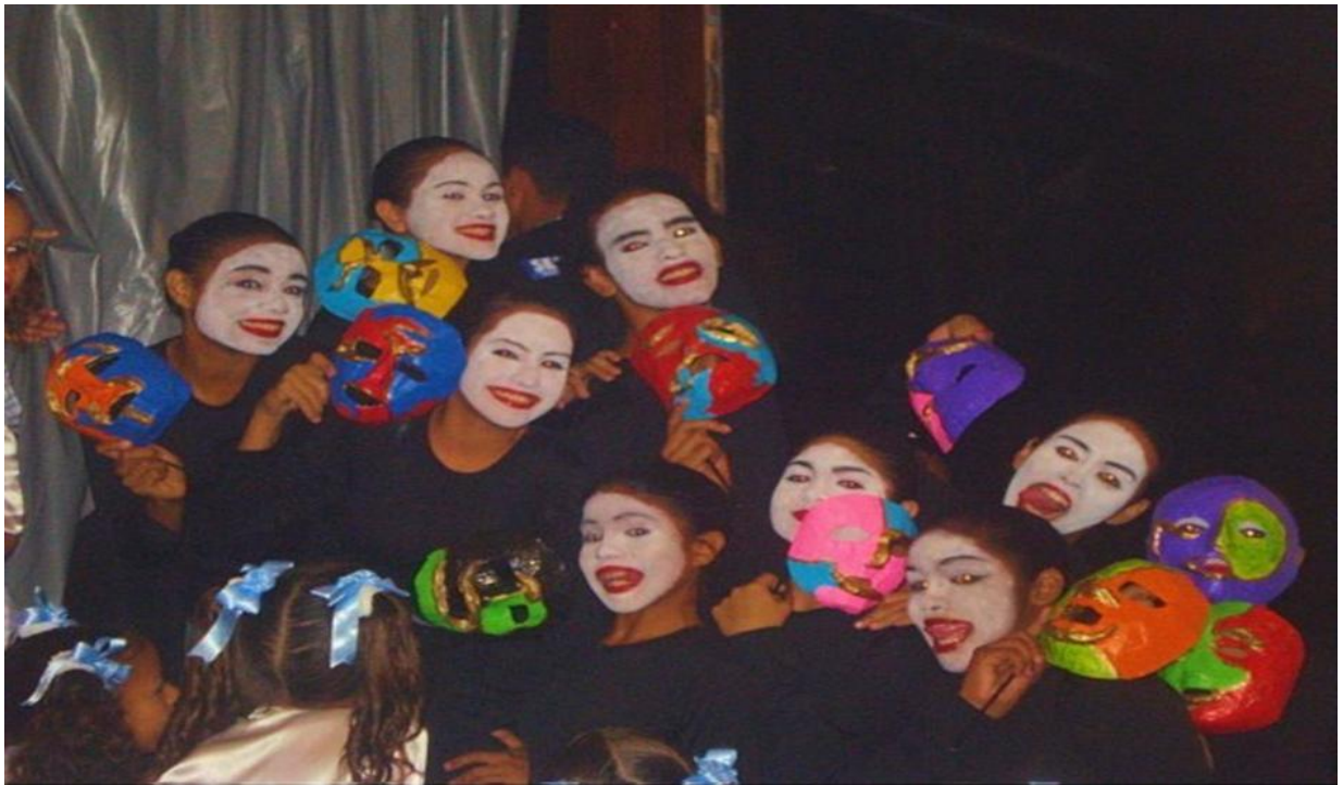
Figura 12 - Coreografia: Rosto Confuso