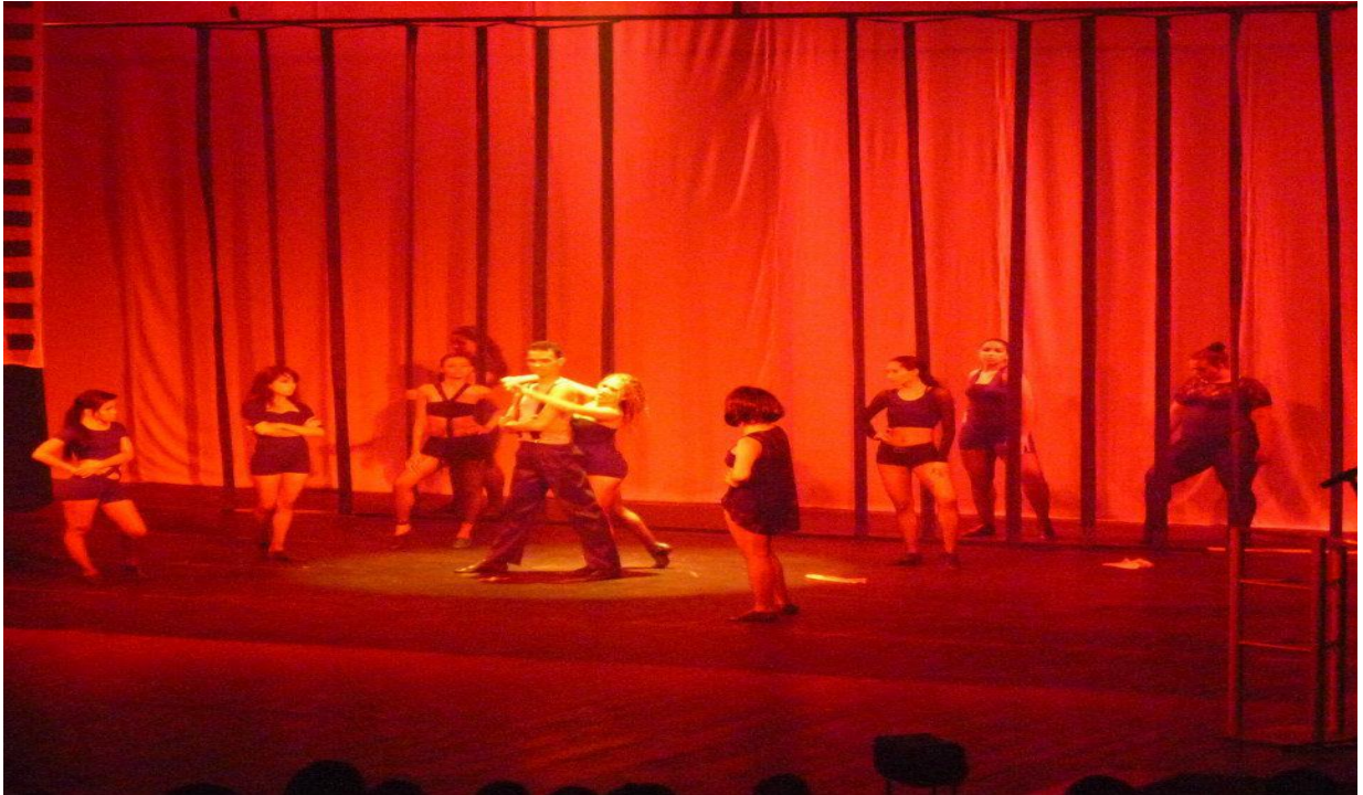
Figura 13 - Coreografia: Chicago