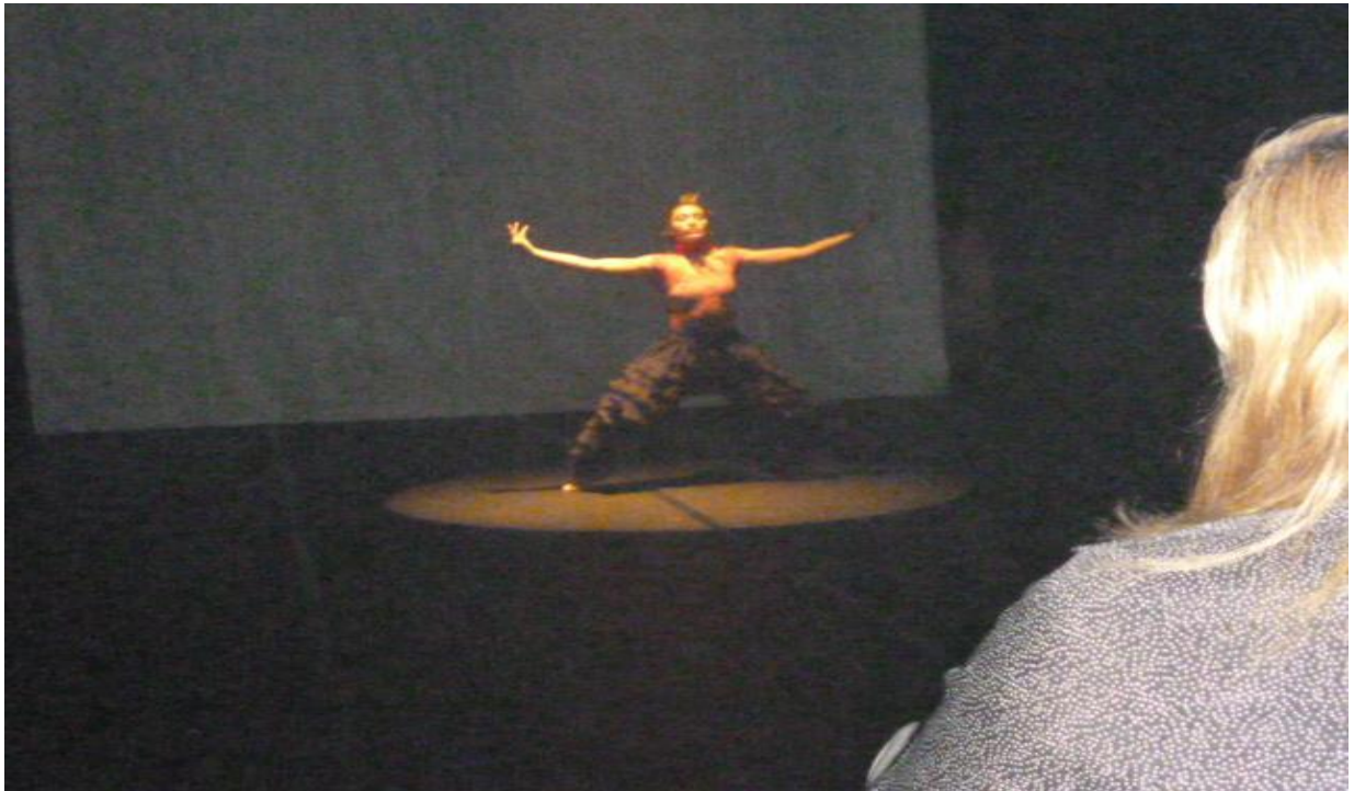
Figura 18 - Coreografia: Uirapuru (Espetáculo Pai D'égua)