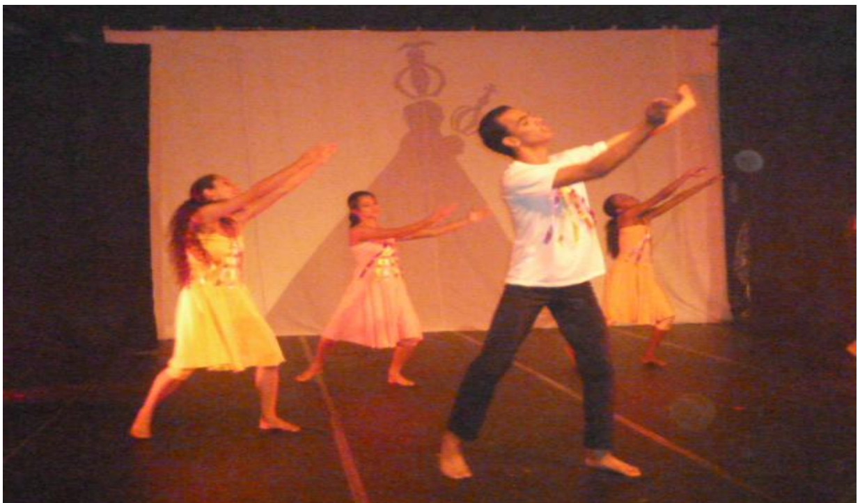
Figura 19 - Coreografia: Círios (Espetáculo Pai D'égua)

Fonte: Companhia Municipal de Dança de Belém. Disponível em: http://www.orkut.com.br/ Acesso em 12/11/2012.