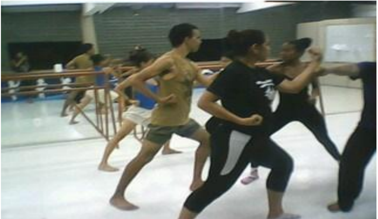
Figura 10 - Aulas de karatê na Cia. Municipal de Dança de Belém