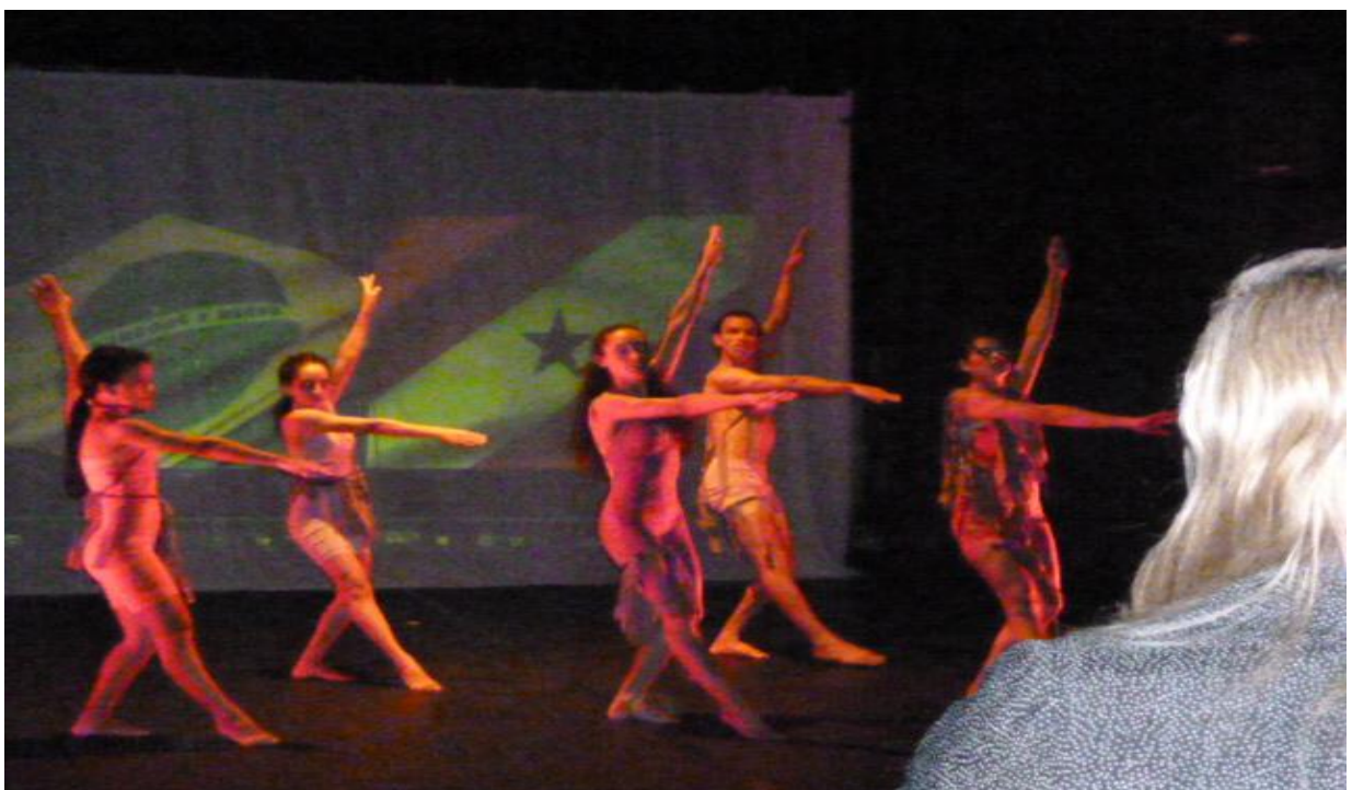
Figura 15 - Coreografia: Belém-Pará-Brasil (Espetáculo Pai D'égua)

Pai D'égua é um espetáculo paraense onde retrata a vida e o cotidiano do nosso povo e de nossa cultura, nossas músicas, comidas características regionais entre riquezas culturais e eventos tipicamente paraenses. Sendo assim o espetáculo Pai D'égua veio aos palcos de Belém homenagear não somente a cidade mas também homenageia toda a população paraense que têm orgulho de viver num estado com uma cultura peculiar própria.