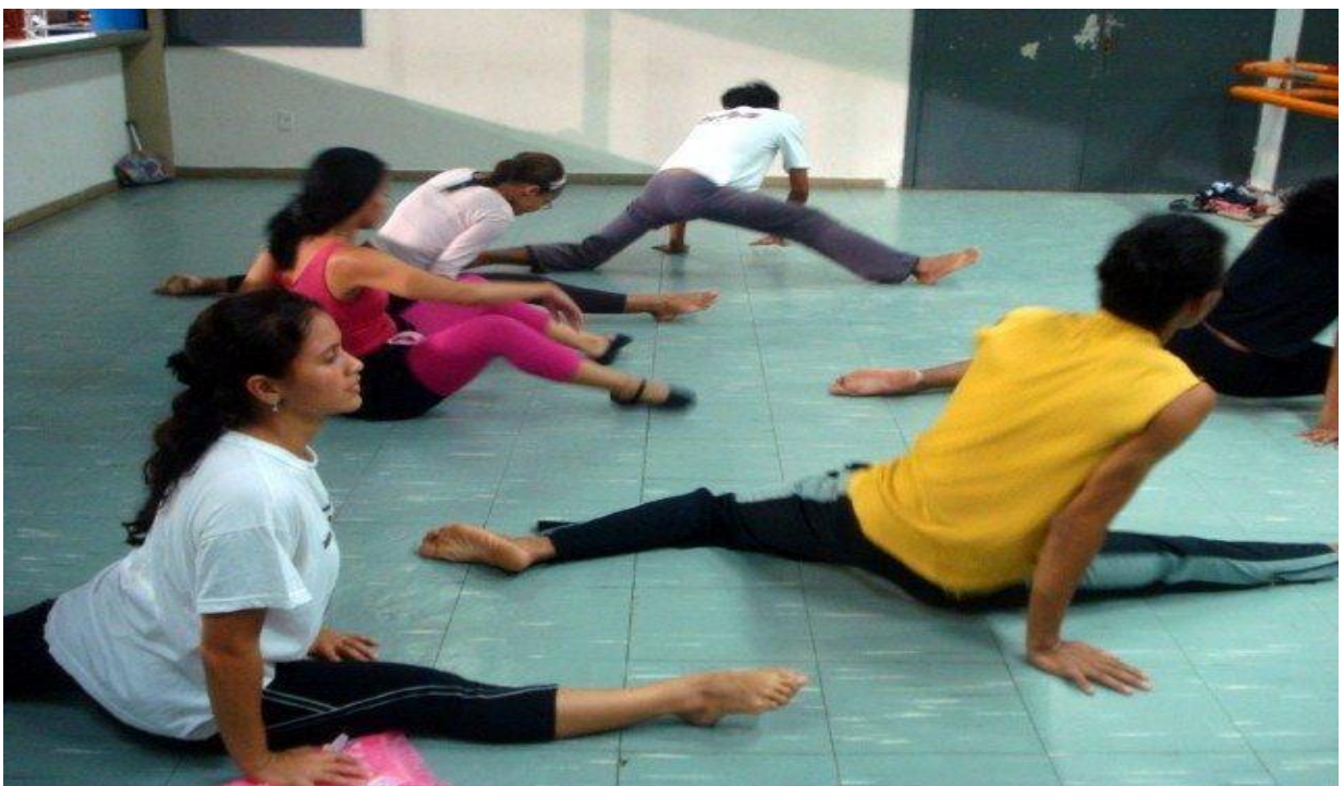
Figura 11 - Aulas de flexibilidade da Cia. Municipal de Dança de Belém