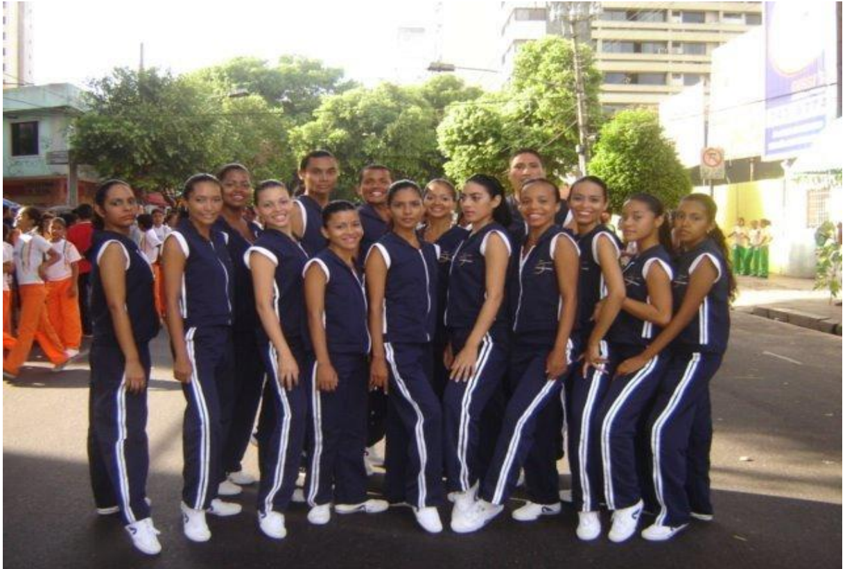
Figura 1 - Participação da Cia. Municipal de Dança de Belém no desfile escolar do ano de 2006.

Fonte: Companhia Municipal de Dança de Belém. Disponível em: http://www.orkut.com.br/ Acesso em 12/11/2012.