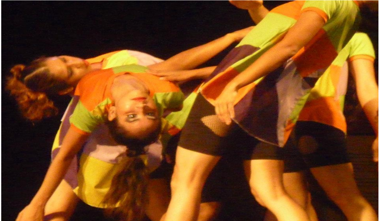
Figura 21 - Espetáculo "Formatos"