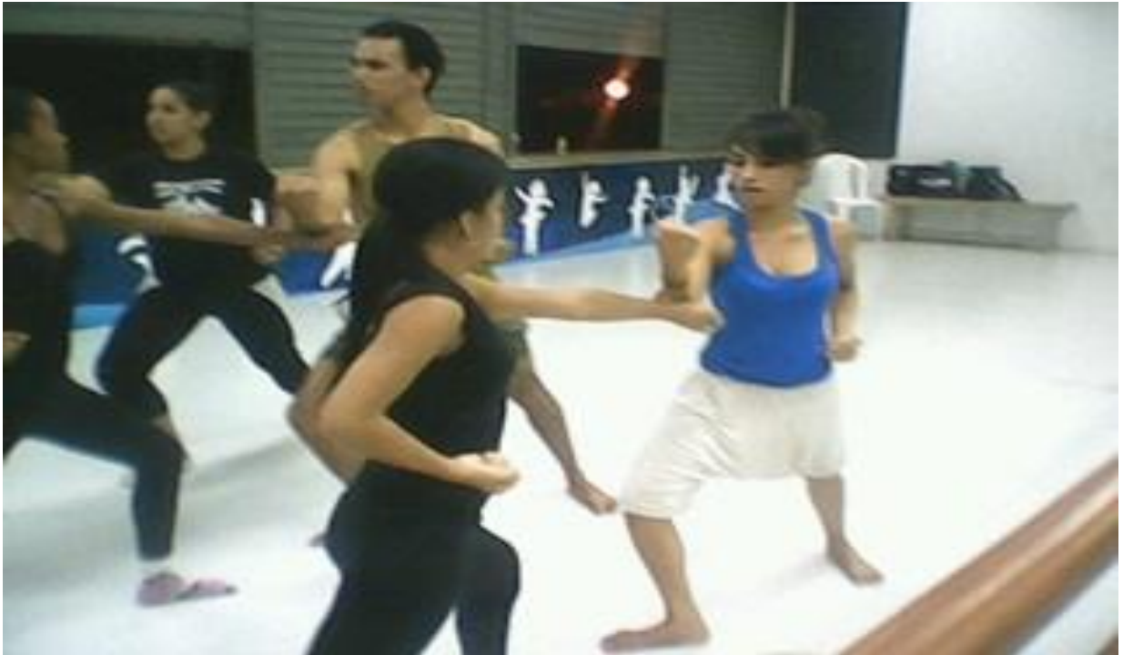
Figura 9 - Aulas de karatê na Cia. Municipal de Dança de Belém