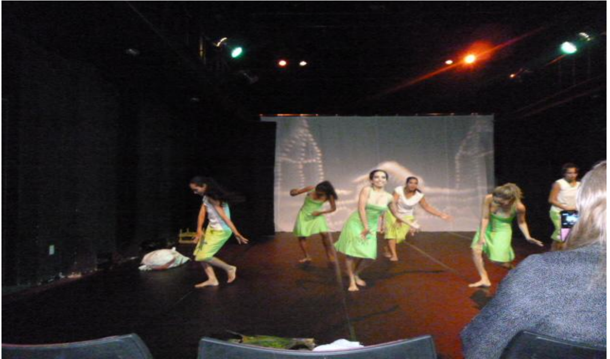
Figura 16 - Coreografia: Ver-o-Peso (Espetáculo Pai D'égua)