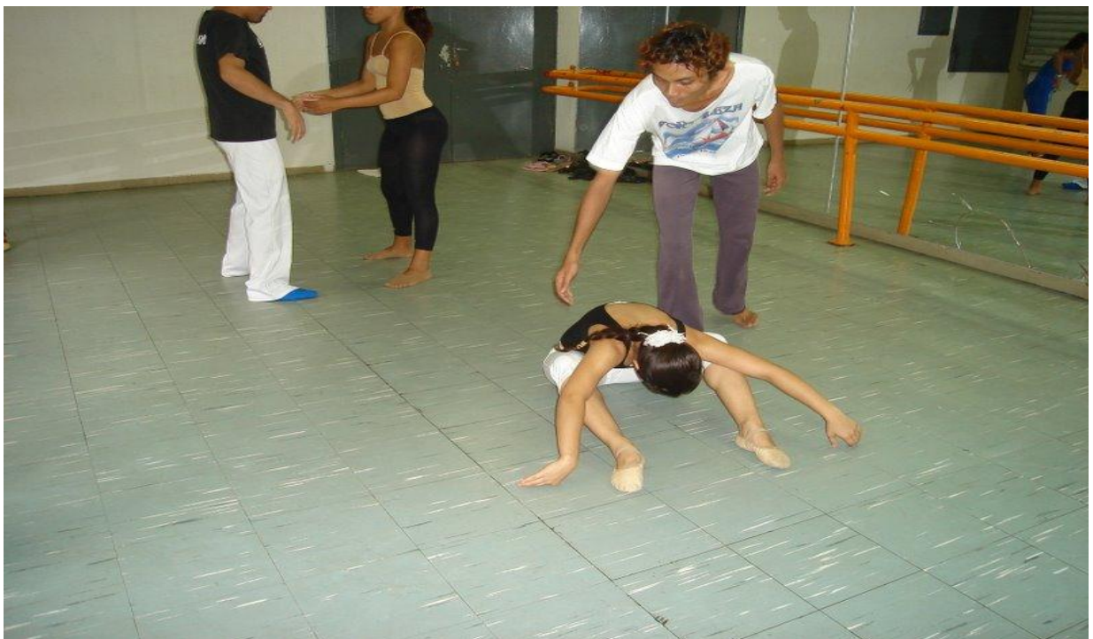
Figura 22 - Laboratório de contato e improvisação para o Espetáculo "Formatos"