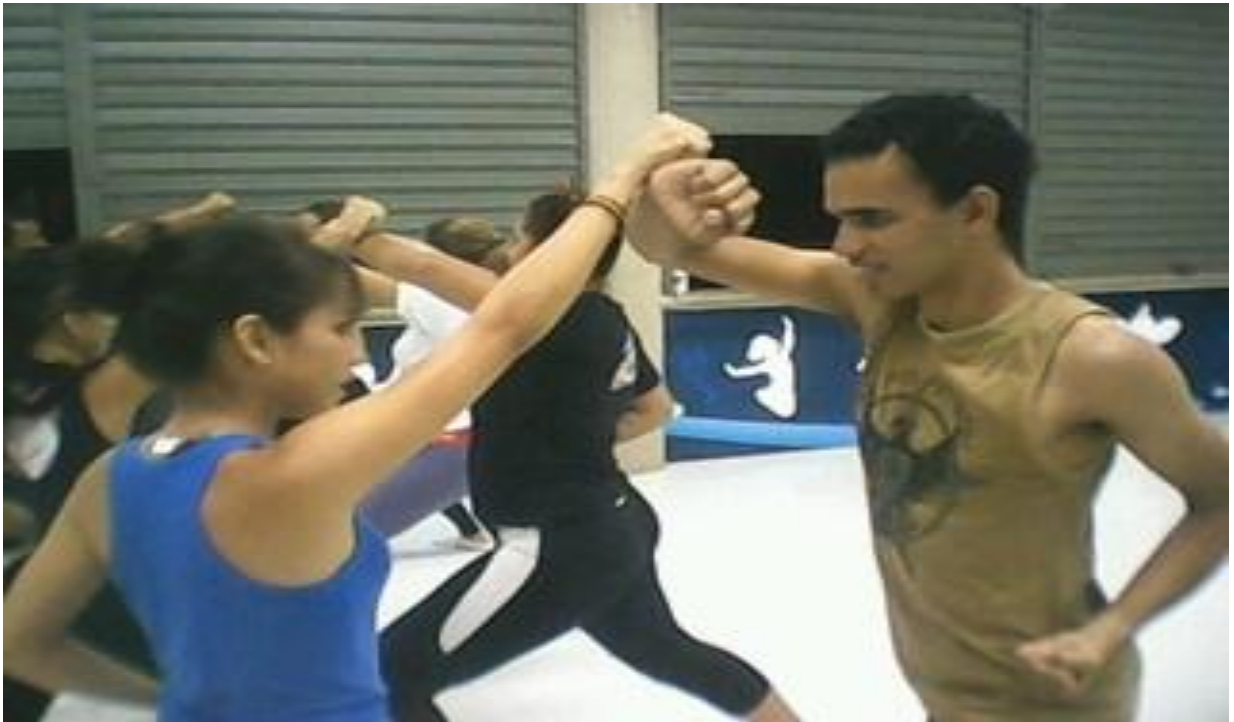
Figura 7 - Aulas de karatê na Cia. Municipal de Dança de Belém.