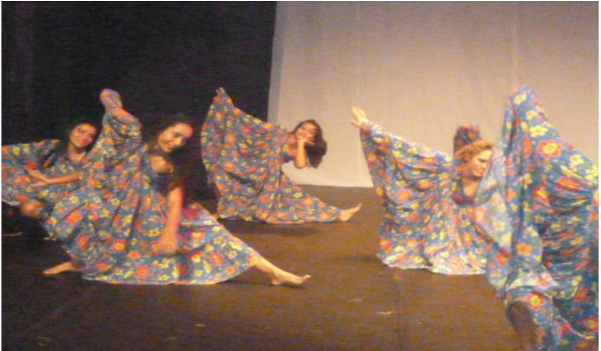
Figura 20 - Coreografia: Viver Feliz (Espetáculo Pai D'égua)