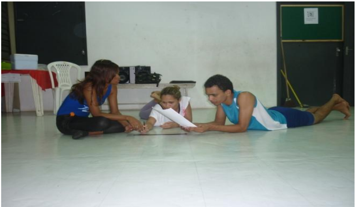
Figura 3 - Aulas teóricas de anatomia na Cia. Municipal de Dança de Belém

É fundamental o estudo e pesquisa teórica na prática da dança para entendermos um pouco mais sobre a criatividade, desempenho, estrutura corporal entre outros pontos importantes vinculados a esta prática. O saber dança envolve reflexões diversas sobre tudo aquilo que nos cerca, que devem estar em harmonia constantemente para que a dança possa fluir em sua complexidade, estimulações e sensações. E as aulas teóricas e de pesquisa obtidas pela Cia. Municipal desenvolve um estudo contínuo e freqüente, onde as idéias são debatidas e estudadas para um bom aproveitamento das pesquisas, sendo assim, as freqüentes aulas teóricas da Cia Municipal são insubstituíveis, pois é preciso o conhecimento teórico para que uma Cia. seja completa. A aprendizagem teórica não vem apenas das professoras, alguns alunos se estimulam e acabam por pesquisar mais sobre todos os pontos relacionados à dança, pontos que são trazidos para as aulas e abordados durante debates, aulas presenciadas nas fotos a seguir: