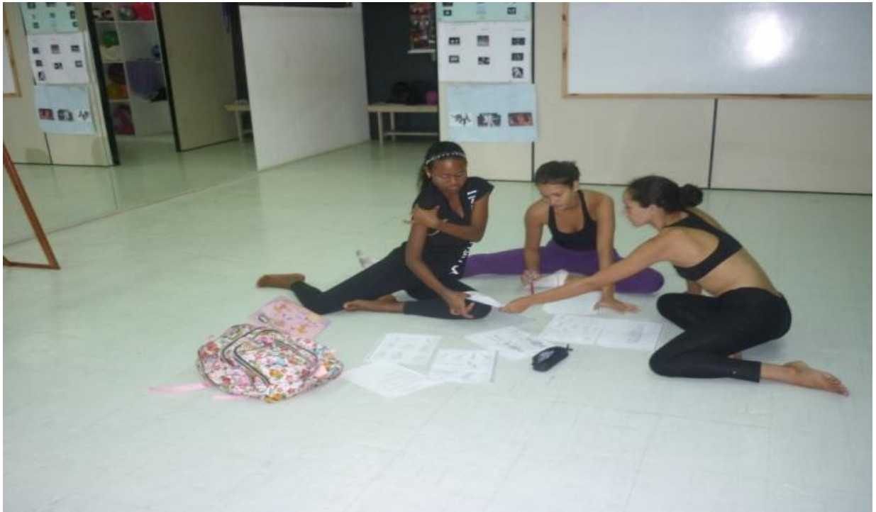
Figura 4 - Aula teórica de anatomia na Cia. Municipal de Dança de Belém