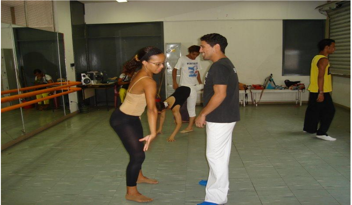
Figura 23 - Laboratório de contato e improvisação para o espetáculo "Formatos"