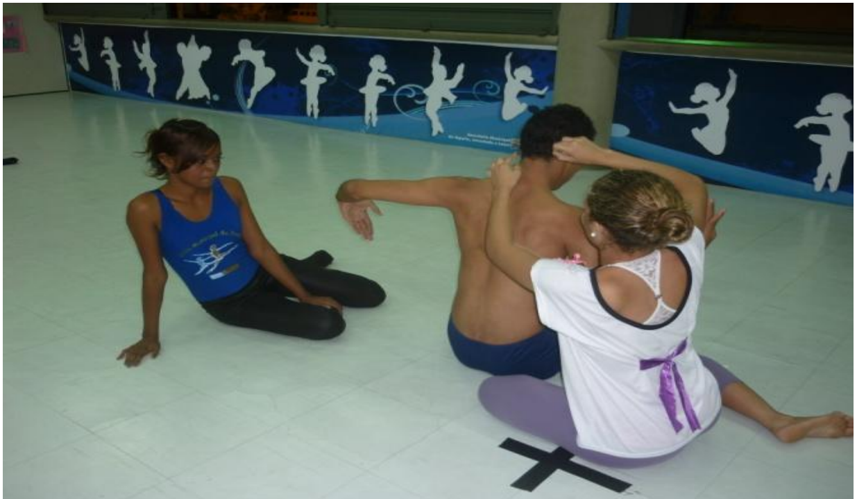
Figura 5 - Aula teórica e prática de anatomia na Cia. Municipal de Dança de Belém