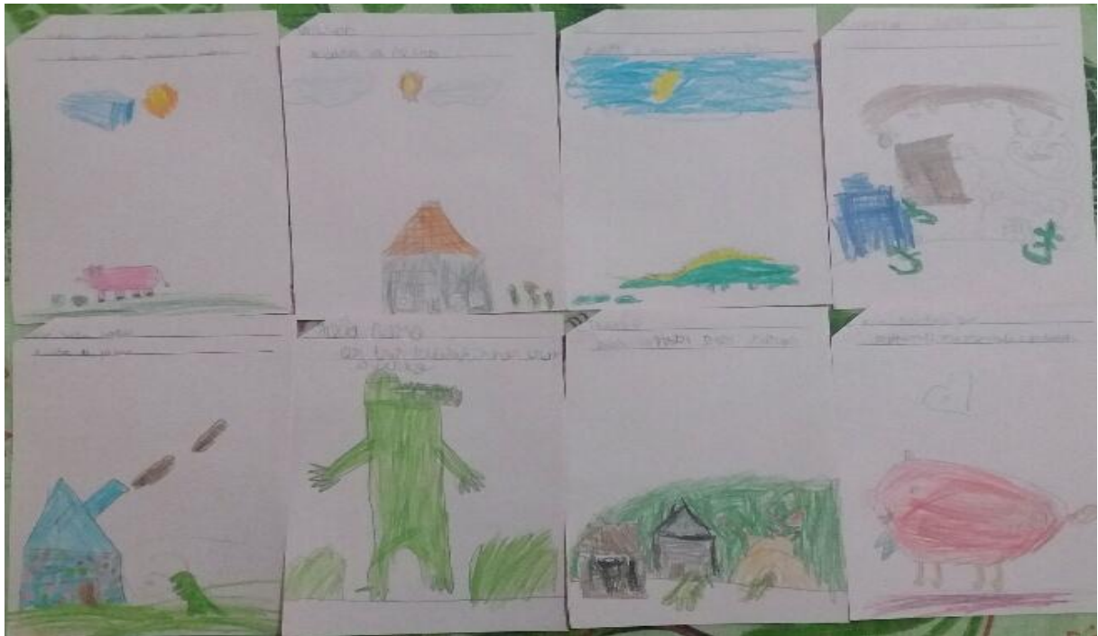
As crianças reproduziram nos desenhos o que mais chamou sua atenção na história dos três jacarezinhos.

A próxima história no quarto encontro do projeto foi “Tato, o gato”, que aproximou as crianças do seu cotidiano: acordar cedo pra ir a escola; o gato da história inventa mil desculpas à sua mãe para não ir a escola, mas sua mãe dá um jeitinho de incentivá-lo, ele então, acha que deve levar seu amiguinho junto, seu ratinho de estimação, ele o esconde dentro da lancheira e segue para o seu primeiro dia na jornada escolar; tudo ocorre bem até que na hora do lanche, a professora vai servir o leite para todos mas a porta da despensa está trancada e não abre de jeito algum, nessa hora o ratinho salva o dia passando por baixo da porta consegue abrir a porta e todos conseguem tomar o leite; então os gatos tornam-se amigos do ratinho e compreendem que podem ser amigos apesar das diferenças. Tato a partir desse dia está sempre animado para ir à escola todos os dias acorda cedo e não inventa mais nenhuma desculpa para sua mãe.