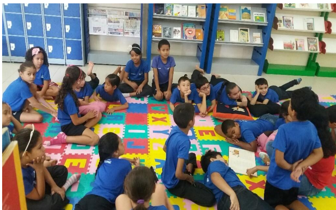
Nesta imagem vemos os alunos da turma do 3º ano sentados em uma roda de conversa na biblioteca da escola Sesc castanhal, no primeiro encontro do projeto.

O objetivo dessa contação foi mostrar que existe o lado bom e ruim das pessoas, as crianças em suas falas demonstraram essa compreensão, perceberam que a bruxa na verdade era uma fada que ficou com raiva e por isso quis se vingar, e isso motivou o desenrolar da história. Todas fizeram contribuições muito relevantes sobre o assunto o que levou a conclusão que todas entenderam a história cada uma dentro de sua própria vivência.