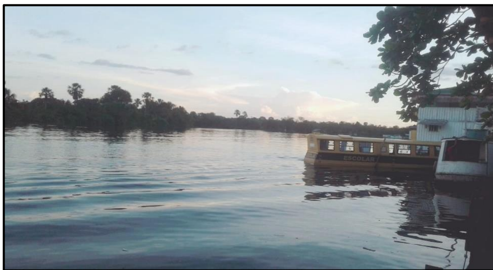
Foto 01: Lancha, no centro comercial aguardando os alunos ao anoitecer.

No caso dos alunos da referida escola, que diariamente a utilizam eles embarcam em portos/lugares variados, pois não existe um porto específico para o embarque. Ressalta-se que tanto o local de desembarque dos alunos, quando chegam na cidade que é no estaleiro beira-rio, quanto o local de embarque para o retorno até suas casas, que é no centro comercial, fica em meio as barracas, isto é, são espaços improvisados. E, como trata-se de um percurso longo, de até duas horas e trinta minutos conforme já mencionamos, tomando os diálogos e um pouco da convivência com eles na embarcação, foi possível perceber que as relações acontecem.