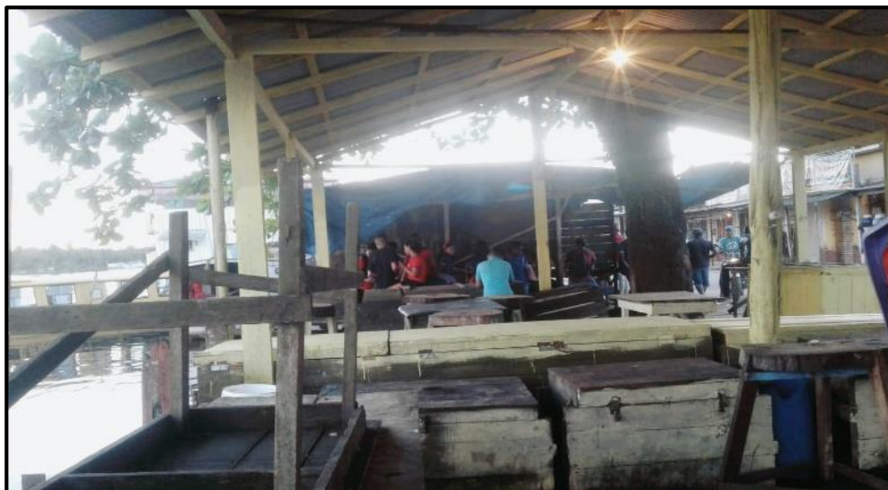
Foto 02: Alunos aguardando a saída da lancha, da cidade para o campo.

Os alunos que mais demoram para chegar ao porto são os do Ensino Médio, por conta da quantidade e regularidade das aulas. Após essa espera, começa o deslocamento para dentro da lancha, sendo uma ação que os mais apressados correm atrás dos lugares de sua preferência, outros apenas procuram um lugar para sentar.