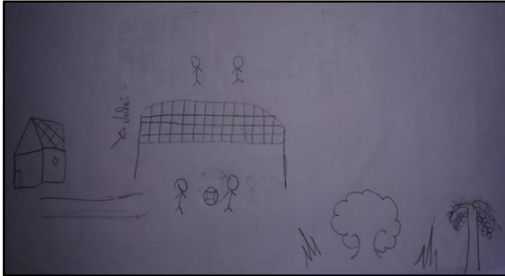
Foto 08: Vôlei no quintal de casa. Autora: Vitória. Fonte: Trabalho de campo, 2019.

A atividade é a de tomar banho de rio, de muito prazer para ela, pelo fato de envolver adultos e crianças em momentos de entretenimento, por possibilitar o contato direto com a natureza e, também, porque essa dádiva está pertinho deles, isto é, os moradores não precisam sair para o deleite desta atividade. Trata-se de prática social, um hábito cotidiano que os coloca como atravessados à natureza e seus elementos, a exemplo do rio.