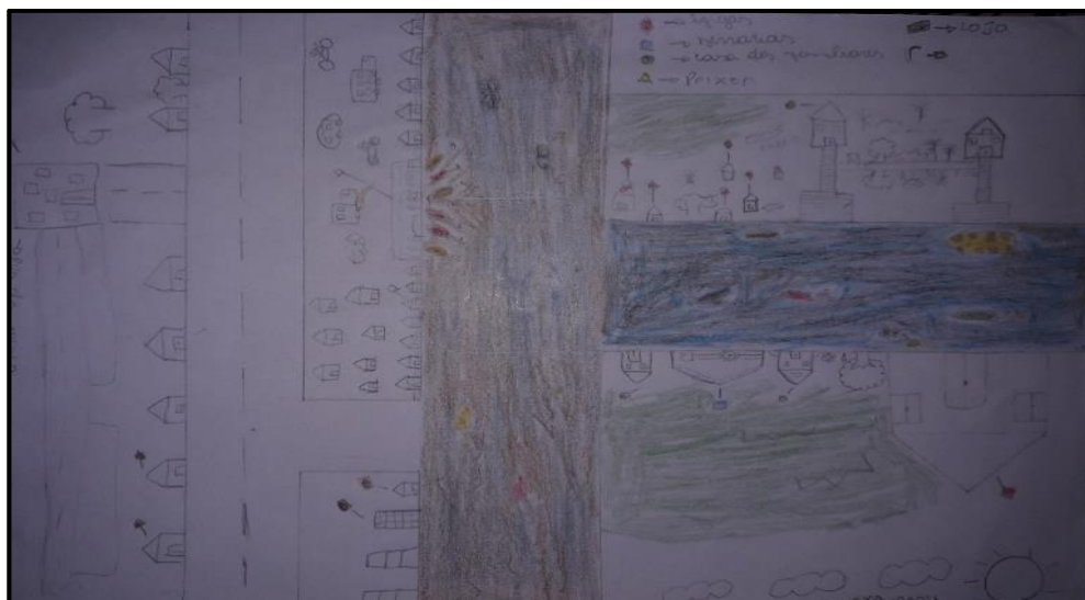
Foto 04: Mapa do percurso escolar na lancha. Autora: Coralina.