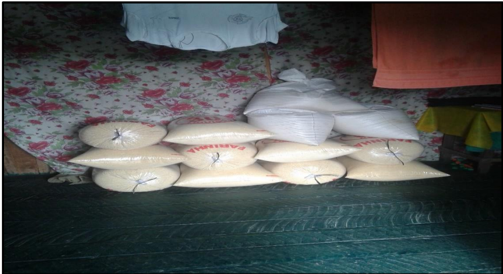
Foto 11: Farinha produzida e vendida na cidade.