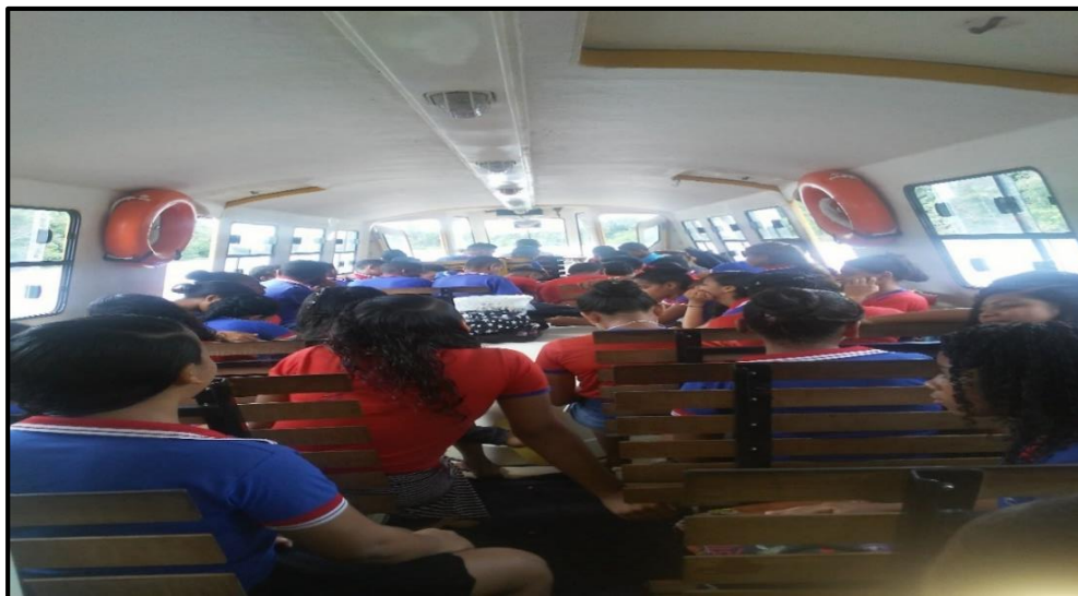
Foto 03: Lancha na ida para a escola. Fonte: Trabalho de Campo, 2019.

A ida até a lancha é menos complicada, comparada ao momento do retorno, pois agora está claro, o embarque é feito na lancha e inicia assim mais uma viagem na lancha escolar, na intenção de conhecer um pouco do percurso escolar e suas implicações no processo educativo dos estudantes e do aprendizado de vida de todos e, inclusive do barqueiro naquela rotina de viagem, transcurso e interação humana.