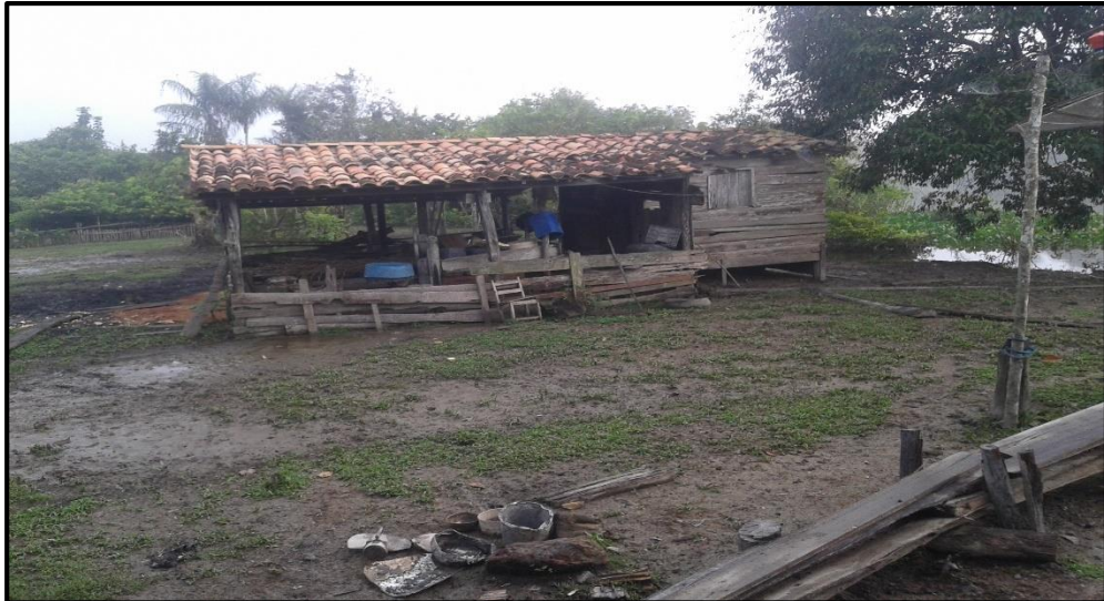
Foto 08: Local de produção da farinha da família de Coralina.