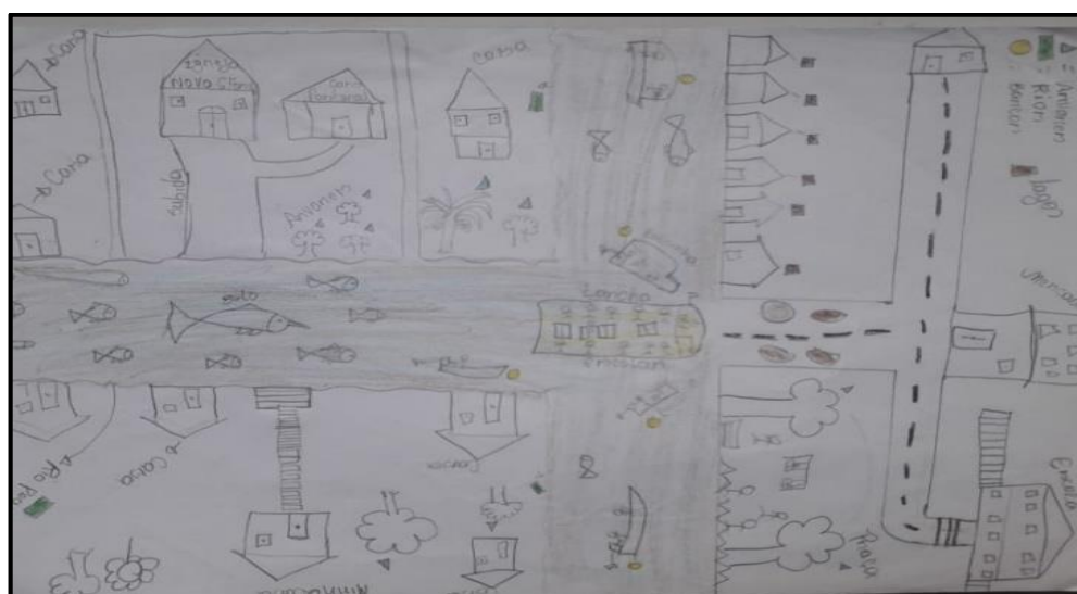
Foto 05: Mapa do percurso escolar na lancha. Autora: Cora. Fonte: Trabalho de campo, 2019.

Nos dois mapas, primeiramente fica evidente as diferenças geográficas espaciais, a área rural é caracterizada por elas como algo bem familiar, com destaque a descrição das residências de familiares e vizinhos, que fazem parte de uma convivência que começou na infância, além do destaque para a presença da natureza na localidade e no rio. Também, o rio é posto como principal meio de deslocamento. Aparecem ainda, os tipos de residências feitas de madeira, as serrarias e as igrejas, pois estas são parte do cenário do lugar e frequentada por elas, conforme já mencionado.