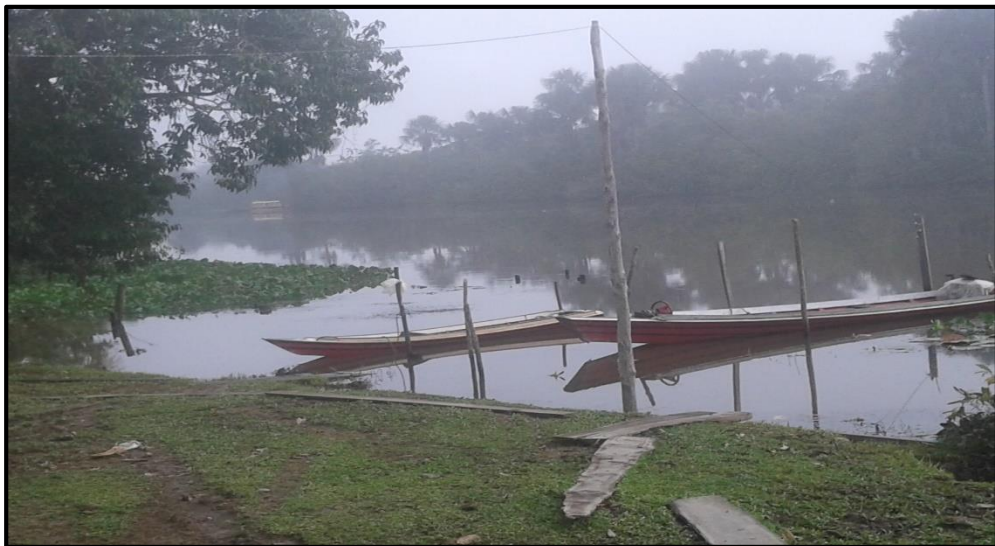
Foto 09: Trapiche e rio, espaços da comunidade.