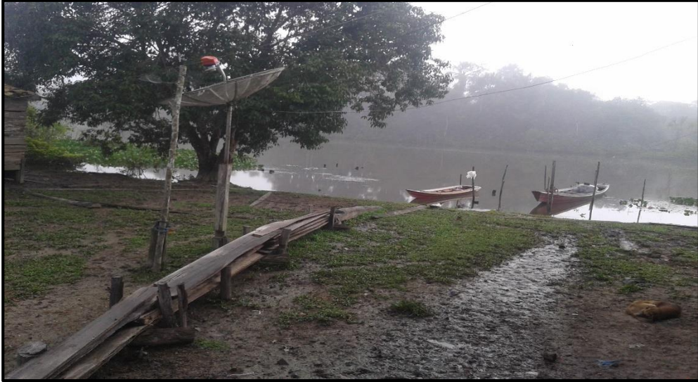
Foto 10: Quintal da casa de Cora.