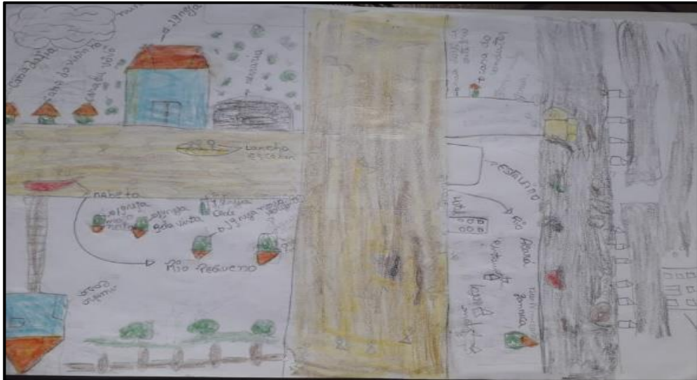
Foto 06: Mapa do percurso escolar. Autora: Vitória.

Pequeno, cujo colorido buscou expressar sua vitalidade, somado ao rio Acará, que banha a cidade do Acará, podendo revelar que considera as águas em que costuma navegar em Igreja Nova Glória, mais limpas que as da cidade. Também enfatizam com desenhos de peixes no rio, demonstrando que na comunidade costuma ser farta, mas na cidade está cada vez mais escassa.