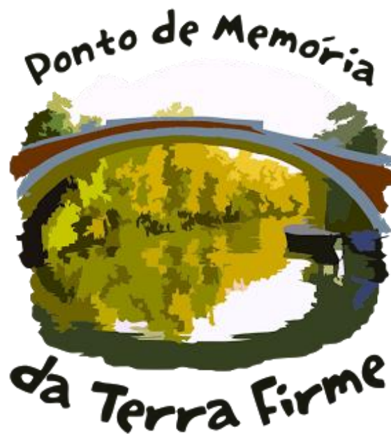
Figura 4 Logo do Ponto de Memória da Terra Firme.

Realizou-se também uma exposição, que contou com uma oficina prévia realizada pelo Museu Paraense Emílio Goeldi e o conselho gestor. A exposição “Terra Firme de Tudo um Pouco” foi inaugurada no final de 2012 e já percorreu diversas escolas do bairro, além de ter sido montada na Universidade Federal do Pará durante a III Primavera nos Museus do Curso de Museologia da UFPA em 2013.