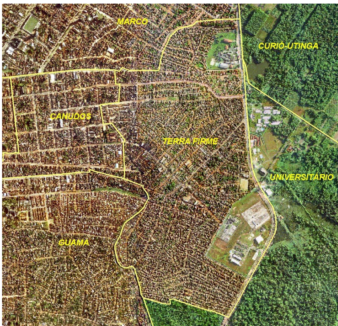
Figura 1 Mapa do Bairro da Terra firme.

O crescimento do bairro se intensificou nas décadas de 1980 e 1990. A negligência das estruturas governamentais para a situação das ocupações urbanas irregulares é um dos elementos que comprovam o posicionamento do Estado perante a formulação das cidades, equipando de serviços os centros urbanos - enquanto o as periferias (erguidas por ocupações) padecem de infraestrutura adequada para uma vida com qualidade. Segundo Couto (2012), o planejamento da cidade de Belém negligenciou os problemas das periferias, dando prioridade a investimentos nas áreas centrais.