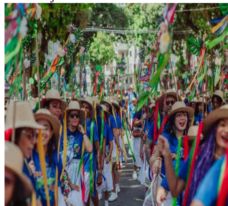
Figura 19 - Dança organizada em fileiras em cortejo