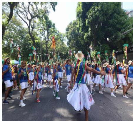
Figura 22 - Batalhão executando o passo lateral cruzado