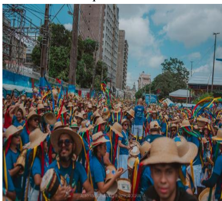
Figura 13 - Batalhão chegando à praça Waldemar Henrique

Durante os arrastões, músicas e danças regionais são apresentadas, promovendo interação com o público e ocupação das ruas da cidade (Negrão, 2012; Façanha, 2019). O trajeto dos arrastões desde 2022. A imagem abaixo apresenta o trajeto dos Arrastões iniciam na Praça da República e percorrem a Avenida Presidente Vargas até alcançarem a Praça Waldemar Henrique, aproximadamente às 12 horas da manhã e então o cortejo se encerra com apresentações da banda.