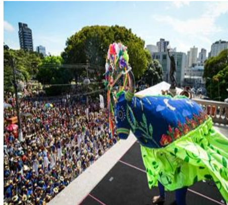
Figura 10 – Concentração do batalhão em frente ao Theatro da Paz, em Belém

horas da manhã e inclui ajustes finais das coreografias, preparação de alegorias e afinação da banda.