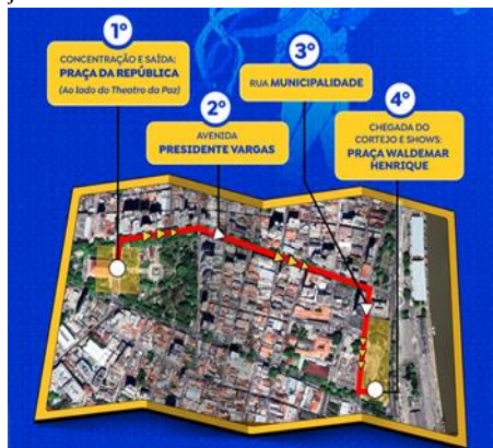
Figura 15 - Mapa de trajeto dos cortejos juninos de 2025