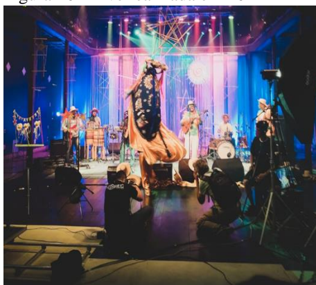
Figura 16 - Live realizada em 2021