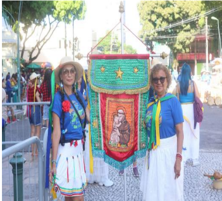
Figura 1- Porta-estandartes do segmento de dança