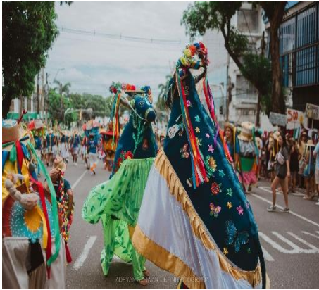
Figura 2 - Bois pavulagens em cortejo