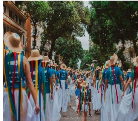
Figura 7 - Segmento de pnalts em cortejo