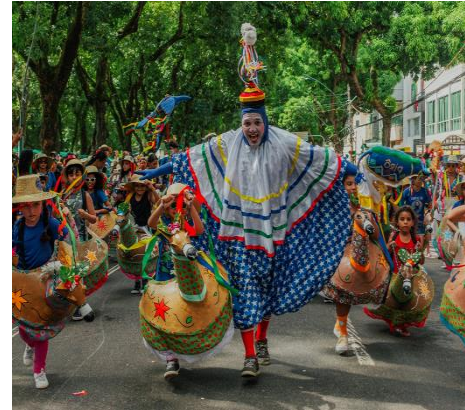
Figura 2 - Pierrô e as crianças da campina