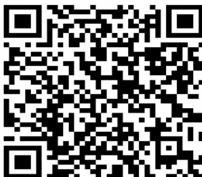
Figura 23 - QR Code para acesso ao arquivo audiovisual dos passos e comandos de dança

Em 2025, o segmento de dança incorporou novos passos, como Giro Estrela, Meia Lua Dupla, aumentando a complexidade das coreografias. Muitos conseguiram executar os passos nos últimos dias de ensaio, próximos ao ensaio geral outro apenas nos arrastões. Para uma melhor visualização dos passos e comandos apresentados, sugiro a leitura do QR Code abaixo, que contém um registro audiovisual demonstrando esses passos e comandos.