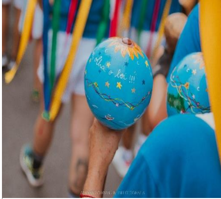
Figura 4 - Maracas personalizadas

garantem a segurança dos brincantes, prevenindo acidentes quando o público invade o espaço do cortejo. Ressalto que a ordem de descrição apresentada corresponde à ordem em que os segmentos desfilam no cortejo