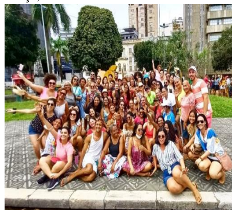
Figura 17 - Encerramento das oficinas de dança, 2022

Fonte: Instituto Arraial do Pavulagem (2021)