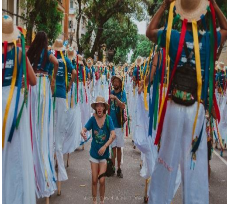
Figura 6 - Instrutores dos pnalts