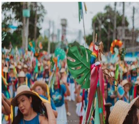
Figura 11 - Adereço carregado pelos brincantes do segmento de dança