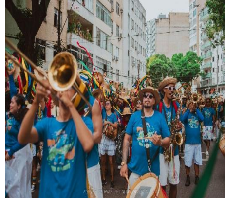
Figura 5 - Segmento de música em cortejo