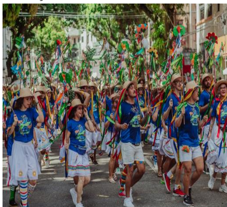
Figura 20 - Brincantes executando o passo de dança