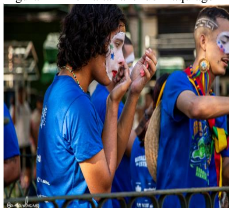
Figura 12 - Pernalta fazendo maquiagem