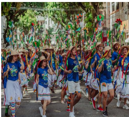
Figura 21 - Instrutor sinalizando para o batalhão executar o passo para lateral cruzado