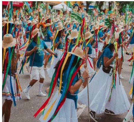
Figura 1 - Segmento de dança em cortejo