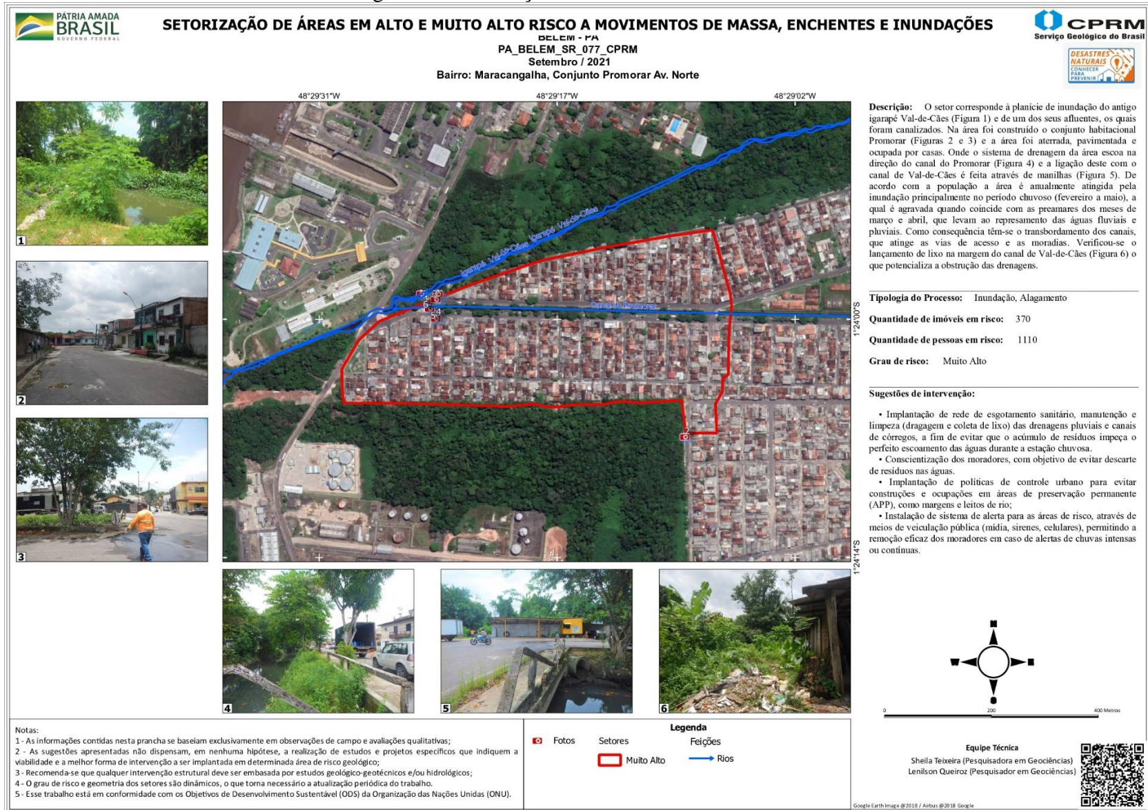
Figura 1 – Setorização de áreas de risco de Belém.