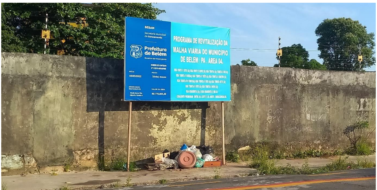
Figura 2 – Placa informativa sobre o “Programa de Revitalização da Malha Viária do Município de Belém”, localizada na Avenida Norte.

Quando fui observando o conjunto Promorar, pude perceber que no período em que a pesquisa foi realizada, as ruas do conjunto estavam sendo pavimentadas, através do “Programa de Revitalização da Malha Viária do Município de Belém” (figura 2). Além disso, algumas áreas do conjunto estavam passando por reforma, como o canal de drenagem e em uma das entradas de acesso ao conjunto, através da Avenida Arthur Bernardes.