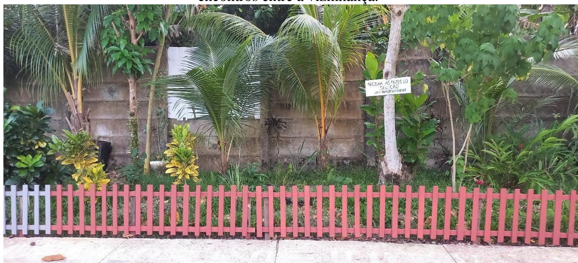
Figura 4 – Espaços que promovem conscientização ambiental e também destinados para encontros entre a vizinhança.

principalmente, nessas áreas mais periféricas da cidade. Dessa forma, além da construção de espaços de conscientização ambiental, podemos perceber também que esses mesmos espaços se tornam espaços de sociabilidade, de encontros entre os moradores e a vizinhança (figura 4). Esses espaços podem ser percebidos próximos ao Igarapé Val-de-Cans, em que podemos observar um corredor de passeio público, com a presença de um extenso muro que separa o Igarapé do corredor.