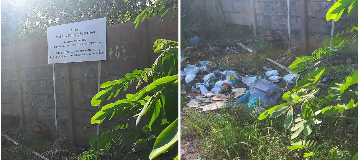
Figura 3 – Placa de aviso sobre a proibição de lixo e entulho na área sob administração militar e abaixo da placa, pode ser verificado a presença de lixo e entulho nessa área.

que são recorrentes nas calçadas do conjunto. Em alguns casos, pude observar placas que sinalizam a proibição de despejo de lixo e entulhos, como nas áreas de controle militar, sob pena criminal de acordo com a Lei de Crimes Ambientais, como mostra a figura 3.