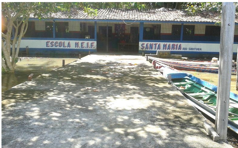
Foto 4 - Escola Santa Maria do Rio Sirituba

Podemos perceber que é algo indispensável, saber no educando o desenvolvimento do que ele aprende à linguagem escrita, no qual possa possibilitar habilidades e competência investindo em sua capacidade de criticar, refletir, ser pessoa participativa na sociedade a qual está inserida, no propósito de exercer seu papel de cidadão como conhecedor de seus direitos e deveres na sociedade.