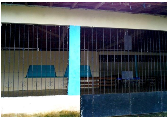
Foto 5 e 6 - Barracão e Escola Thomas Lourenço Negrão

Entretanto, o professor é um ser sócio - cultural, com sua altas habilidades e competências que vivência as experiências coletivamente em sala de aula com seus alunos e que marcam suas vidas, onde muitas das vezes surgem conflitos ideológico no processo educacional, tendo uma mudança metodológica de atitudes através do diálogo, ora é preciso ser um pouco mais severo, levando em consideração as etapas e séries dos alunos.