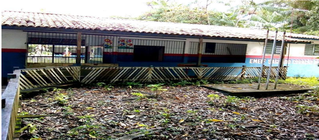
Foto 9 - Escola Sagrado Coração de Jesus

No decorrer do ano letivo tiveram dois cursos ofertado pela SEMEC, (Secretaria Municipal de Educação), com a equipe de apoio, puderam me dá um suporte no decorrer dos bimestres, onde desempenhei o meu papel dentro das minhas possibilidades interagindo com um olhar coletivo no ensino aprendizagem. Durante esse período de 2013 a 2018, o meu contrato foi renovado nesta referida escola, mas busco com muito esforço e dedicação a minha efetivação.