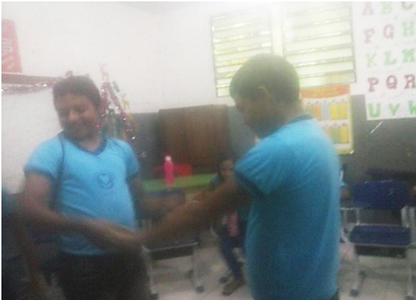
Fotos 7 e 8 - Educação inclusiva