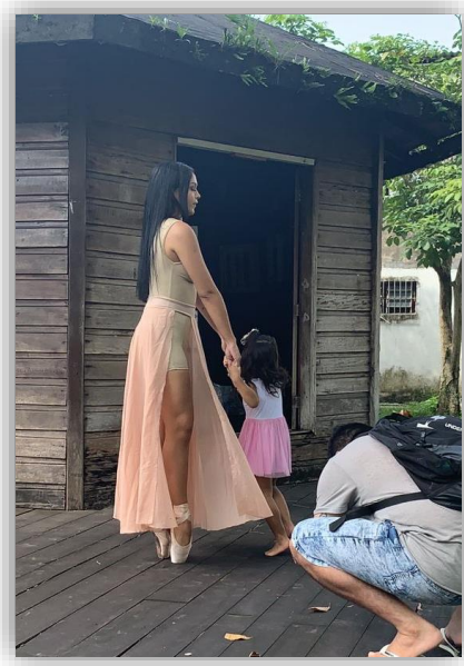
Figura 16 - Corpo/ Leve (Figurino 02).