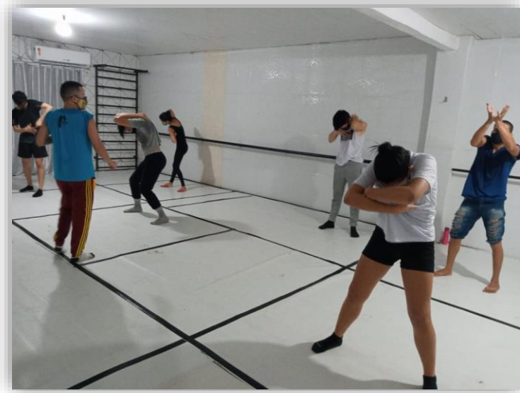
Figura 02 – Laboratório Corpo/Habitante.