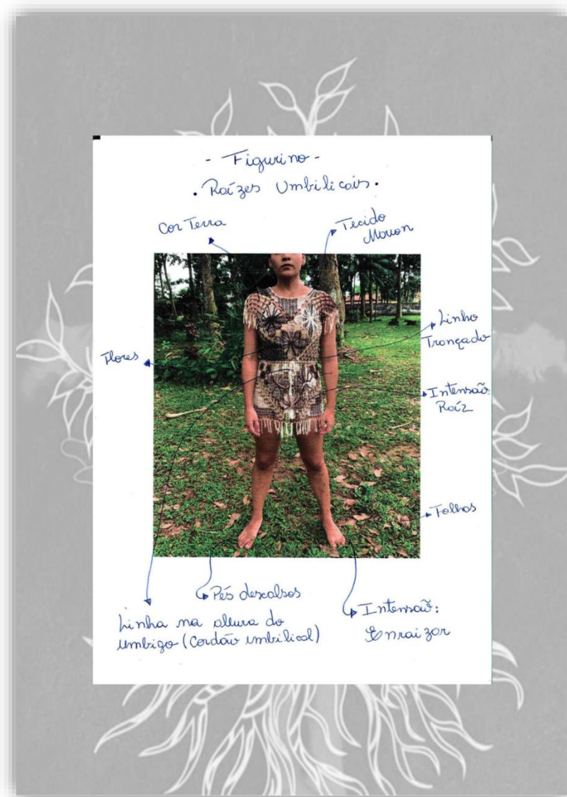
Figura 14 - Corpo/ Raiz (Figurino 01).