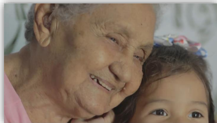
Figura 21 - Registro de Afeto Avó/ Bisneta.