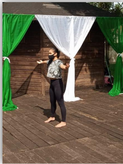
Figura 12 - Habitando Espaços.