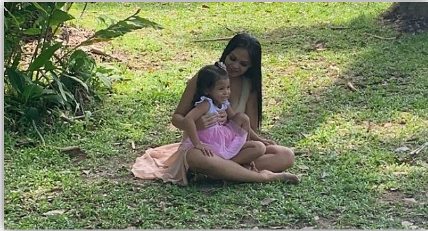
Figura 19 - Criações Cênicas.