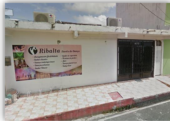
Figura 01 – Casa Ribalta.

As aulas e laboratórios de experimentação que foram realizadas na casa Ribalta perpassaram por diferentes espaços para além das salas de dança. Durante as diversas dinâmicas, com divisão de pequenos grupos, as experimentações ocorriam na recepção e hall de entrada da escola, para que outras sensações pudessem reverberar durante toda a pesquisa de corpo guiada pelos professores, trazendo a possibilidade de habitar pequenos espaços da casa, o que nos proporcionou vivenciar o conceito de habitar/habitações desenvolvidos pelas linhas de pesquisas dos professores da casa Ribalta. Abaixo, a imagem da fachada e hall de entrada da Ribalta escola de dança.