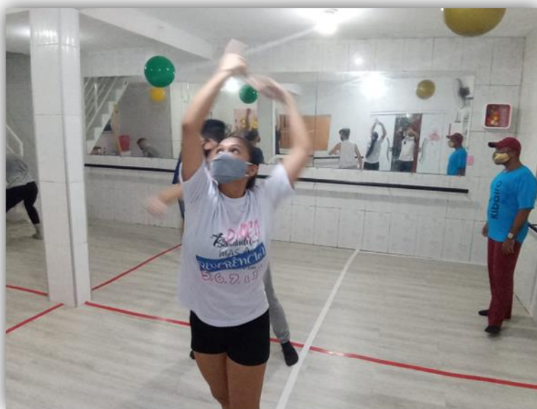
Figura 05 - Aplicações práticas.