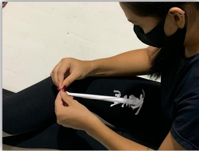
Figura 08 - Gerando Raízes.

A imagem da placenta e todas as suas extremidades cheias de pequenos vasos sanguíneos remeteu-me a raízes e, nesse momento, olhei para a imagem que tinha feito e senti que precisava falar sobre essa ligação de afeto em minha vida, pensei em minha mãe, avós, tias e minha família, como uma rede de vida ligada pelos cordões umbilicais, feito raízes. Segue a imagem da experimentação.