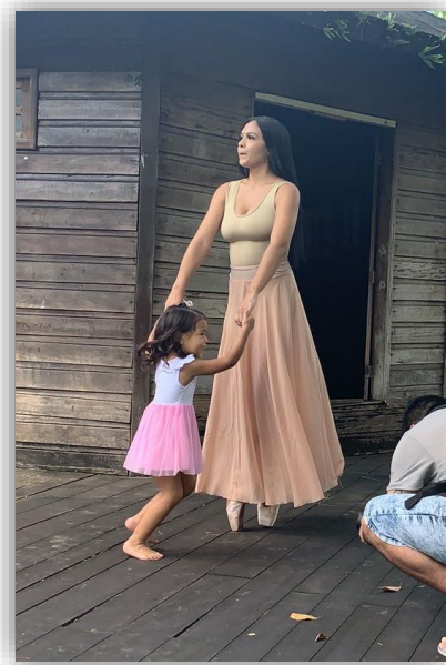
Figura 15 - Laços (Figurino 02).

O tecido leve e um pouco transparente adaptava-se às formas do corpo, fazendo com que a saia tivesse um leve balanço, e utilizei a sapatilha para compor o figurino e retratar minha enorme relação de amor com a dança, a qual percebo que a cada dia também vem reverberando-se em minha filha. Nas imagens a seguir, podemos observar as propostas de figurinos descritos acima.