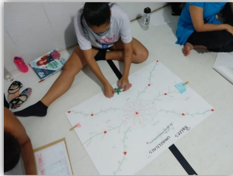
Figura 10 - Minhas Raízes.