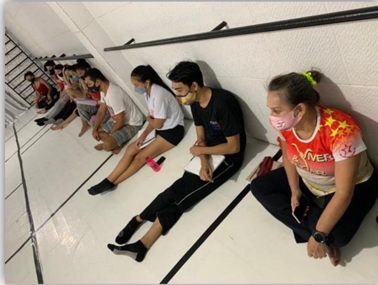
Figura 04 - Aplicações teóricas.