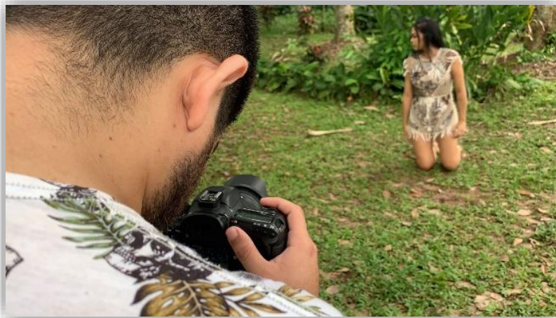
Figura 18 - Criações Cênicas.