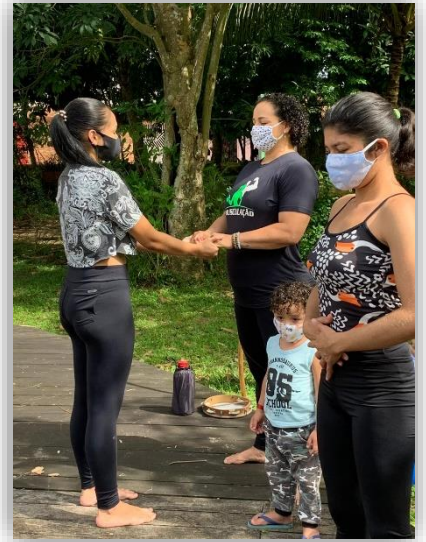
Figura 13 - Conexões/ Energia Central.