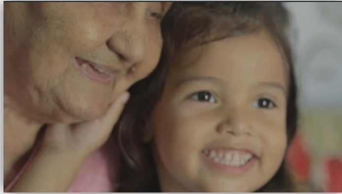
Figura 22 - Registro de Afeto Avó/ Bisneta.