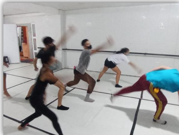
Figura 03 - Experimentações Corporais.