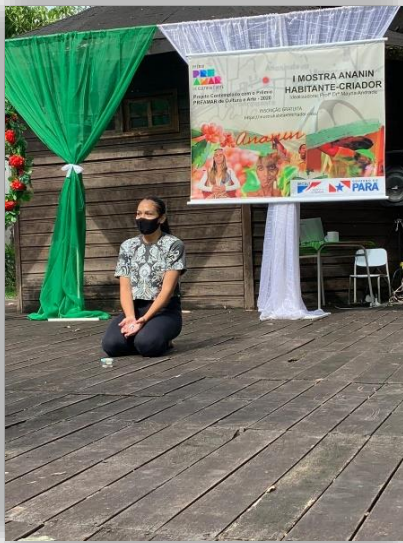
Figura 11 - Partilhando Conexões Maternas.