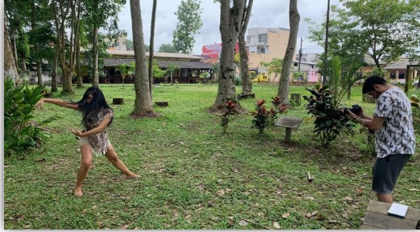
Figura 17 - Criações Cênicas.