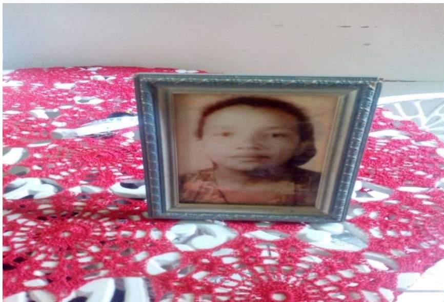
FIGURA 4: In memoriam fundadora da comunidade São João Batista.