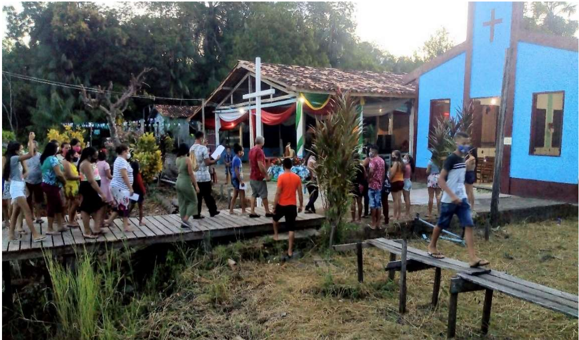
FIGURA 5: Festividade da comunidade do Rio Tucumandubazinho.

O trabalho feito inicialmente, está vivo até os dias atuais, apesar de todas as dificuldades encontradas no decorrer do tempo e as transformações que o momento exige. Recontar, reescrever ou relembrar o histórico da comunidade de São João Batista, Rio Tucumanduzainho, nos proporciona uma volta no tempo, e a colaboração de muitos para a efetivação de uma história que conta a história de vida do outros. Hoje, à comunidade de São João Batista, passou por mudanças e reformas que podem ser analisadas pelas imagens.