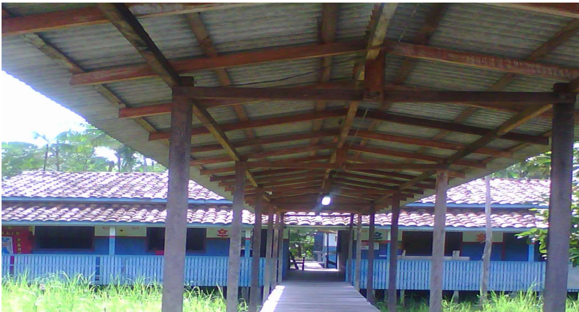
FIGURA 6: Escola Nestor Deitos da comunidade do Rio Tucumandubazinho.

O fato de não ser só docente daqui da comunidade, ela tem um pouco de, digamos assim, uma pequena carência, porque são 10% dos funcionários da escola que são daqui o restante são de outros lugares que vem pra trabalhar. Então, quer dizer que os interesses deles com relação essa parte aí já é mais inferior para nós, digamos assim, no caso dos funcionários, só tem um funcionário que é do setor e o restante não é daqui. (PINHEIRO, 2021).