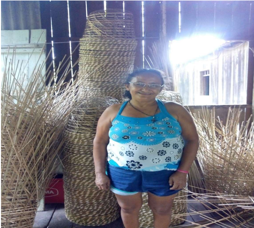
FIGURA 9: Artesanato do paneiro.