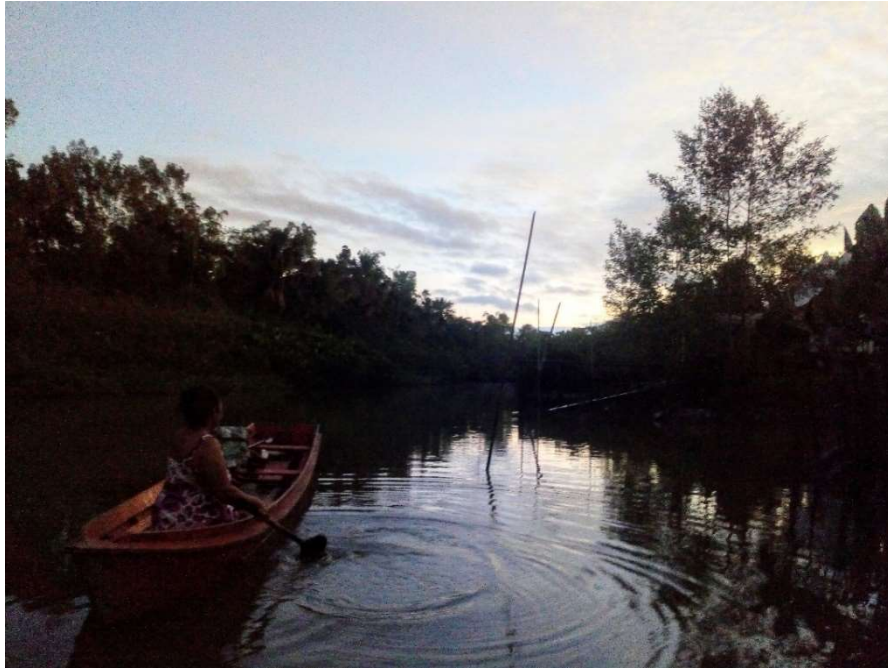
FIGURA 7: Ribeirinha da comunidade de São João Batista, no raiar do dia.

saudável e em harmonia com seu espaço, apesar dos desafios enfrentados por viverem longe da dita sociedade moderna, sem os devidos direitos que o poder público deveria disponibilizar.