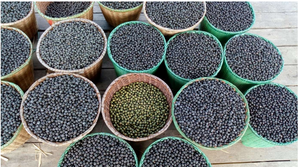
FIGURA 10: Açaí na rasa para comercialização.

A vida ribeirinha é marcada por inúmeras significâncias, desde o ato de pescar até o desejo mais singelo de mergulhar nas águas calmas do rio. São expressões que estão no dia a dia de todos os agentes sociais que vivificam no ambiente marcado pelos mistérios da natureza. Em outras palavras a qual predomina mais, e a extração do açaí, alimento abundante nesta localidade, onde os apanhadores 4 sobem no açazeiro 5 , seu fruto é cultivado diretamente no açazeiro que ficam repleto de cachos da fruta, o ribeirinho é apoiado por uma peconha 6 para poder subir na palmeira e leva uma faca que o auxilia para cortar o mesmo, que é vendido em rasas, 7 e variam de preço conforme o momento ou não de safra 8 . Por exemplo, na época da extração do fruto os mesmos (peconheiro 9 ) tem um trabalho redobrado.