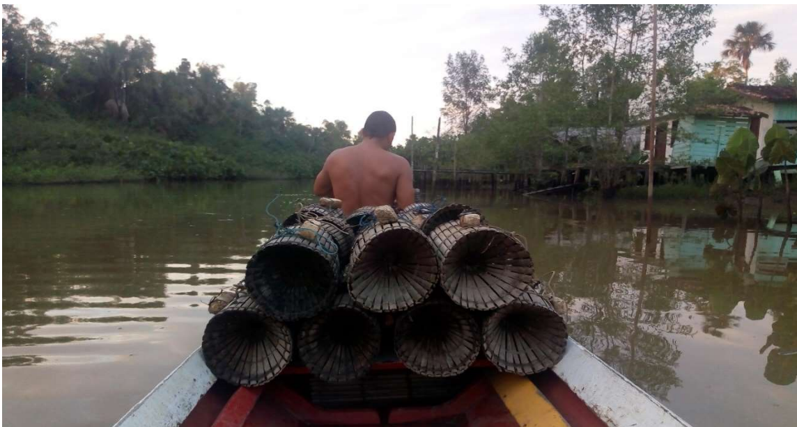
FIGURA 8: Ribeirinho na prática de pesca na captura do camarão com o Matapi.

Os serviços executados (O trabalho na comunidade São João Batista é árduo e pesado) são desenvolvidos tanto por homens quanto por mulheres, é um meio de vida e de existência (sobrevivência) do dia a dia das famílias que labutam com o suor do rosto para manter o alimento na mesa, e assim, contribuir com a economia local e também do município. Suas principais atividades estão focadas no extrativismo vegetal, a agricultura e a piscicultura são as principais fontes de rendas das famílias, seguido pelo artesanato do Paneiro 2 e Matapi. 3