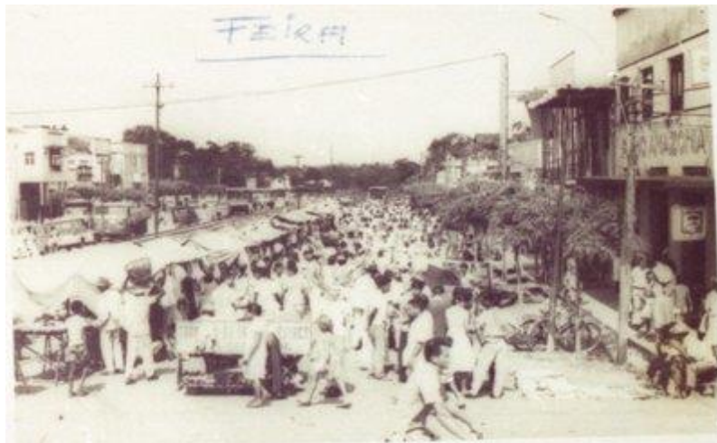
Figura 5- Av. Barão do Rio Branco junto com a feira

Sobre esta feira, o autor Prado, (2020) nos descreve que: “No dia de feira, que era aos domingos, via-se de 30 a 50 cavalos amarrados nas frentes dos comércios. Esses animais eram dos colonos das redondezas, que vinham para Castanhal vender seus produtos” (PRADO, 2020, p. 73). Portanto, não era só a população local que formava a feira, mas também outras pessoas que vinham de regiões adjacentes à cidade.