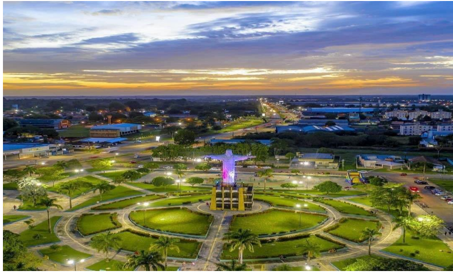
Figura 4- Praça do Cristo Redentor - 2021