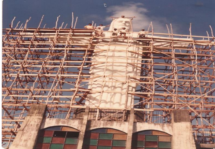
Figura 3- Reforma do Cristo Redentor