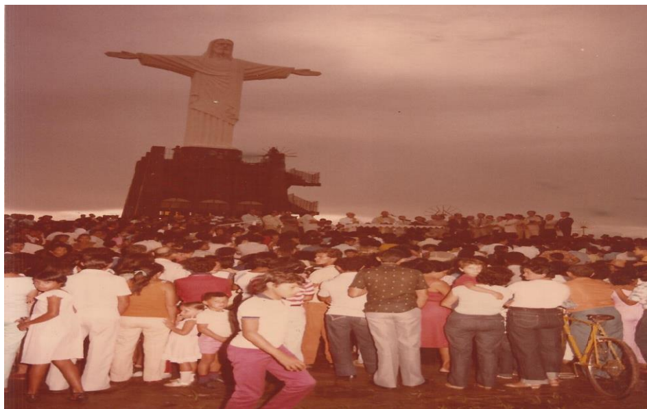
Figura 2 - inauguração praça do Cristo Redentor - 1982