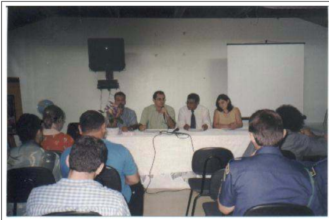
FIGURA 1 – Foto da composição da Mesa de abertura do Seminário sobre a Lei Estadual de Recursos Hídricos, realizado na UNIR – Campus de Porto Velho, em 06-06-2001.

Na parte da tarde do dia 06 de junho, foram apresentadas as diferentes propostas de sugestões e emendas - inclusive a protocolada pela autora deste trabalho. Verificou-se o que era consenso e, em seguida, foram formados 4 grupos de trabalhos para discutirem os temas mais polêmicos, a saber: Política Estadual de Recursos Hídricos; Conselho Estadual de Recursos Hídricos; Águas Superficiais e Subterrâneas e Fundo Estadual de Recursos Hídricos. Os grupos debateram entre si e escolheram livremente um pequeno número de representantes, para relatar o resultado do trabalho conjunto, o que foi exposto, debatido e votado abertamente em plenário, no turno da noite, ficando aceita a decisão democrática da maioria dos presentes.