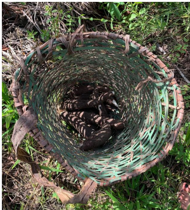
6ª Imagem – O Cesto e o Peso da Colheita

Essa cena evoca a relação profunda entre o povo quilombola e seu território, uma relação que é marcada por respeito e uma constante adaptação às exigências do ambiente. A agricultura, nesse contexto, se apresenta não apenas como uma prática de sustento, mas como uma ferramenta de resistência. Ela é fundamental para garantir a soberania alimentar da comunidade. A imagem da mandioca brotando simboliza, portanto, mais do que um simples ciclo agrícola; ela representa a luta pela autonomia e a persistência diante dos desafios impostos por fatores externos, como a marginalização e os impactos ambientais.