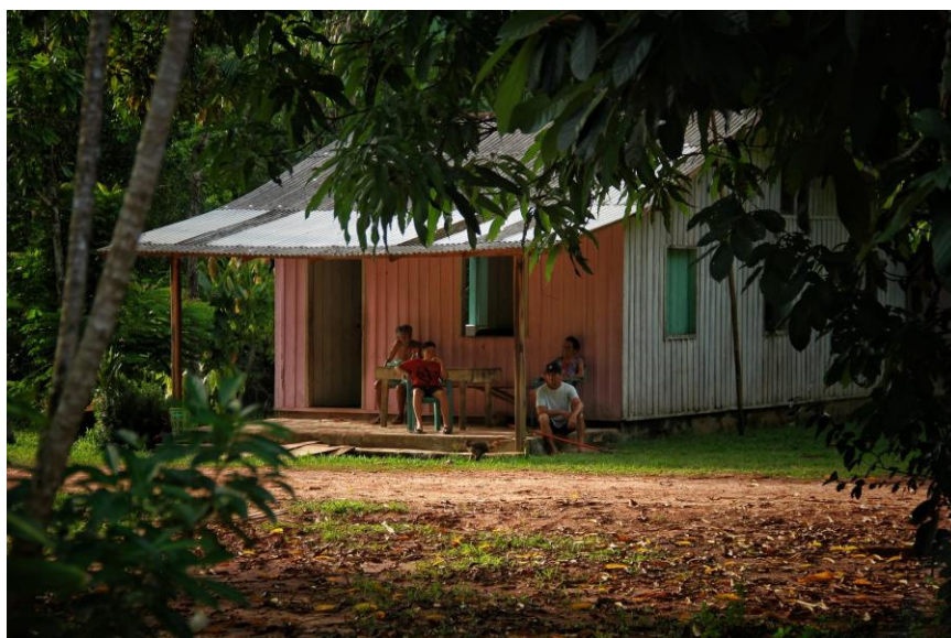
17ª Imagem - Pessoas observando