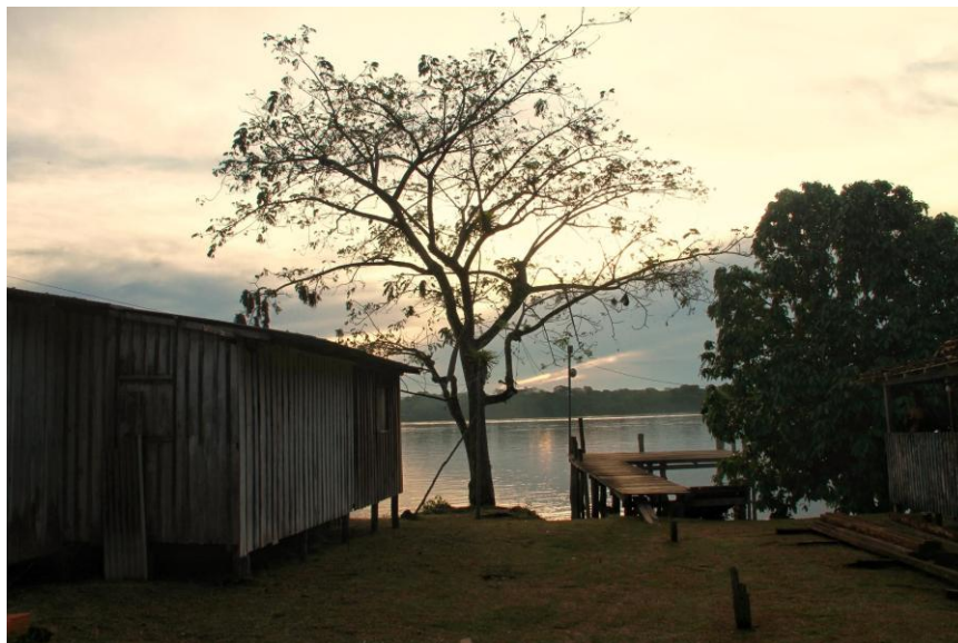
24ª Imagem - Trapiche da comunidade