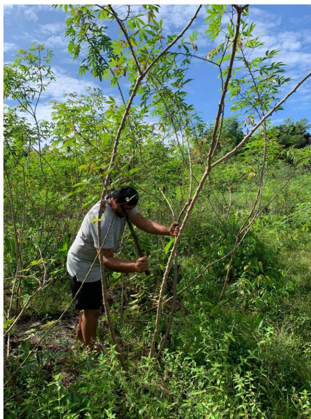
2ª Imagem – Conexão Entre Terra e Quilombolas

O ambiente ao redor reforça a ideia de coletividade e pertencimento, onde o trabalho se entrelaça com o cotidiano e com a manutenção da cultura. A imagem não apenas documenta o preparo do alimento, mas revela um processo carregado de história, luta e resiliência. Cada fibra do tipiti, cada gesto da senhora, está imbuído de narrativas de resistência que, mesmo discretas, reafirmam o laço profundo com o passado e a continuidade dessa herança. Feito de palha natural, o tipiti não é apenas uma ferramenta prática, mas um elo simbólico entre as tradições indígenas e quilombolas, conectando passado e presente, e servindo como um testemunho de uma sabedoria que resiste ao tempo e se mantém viva no cotidiano.