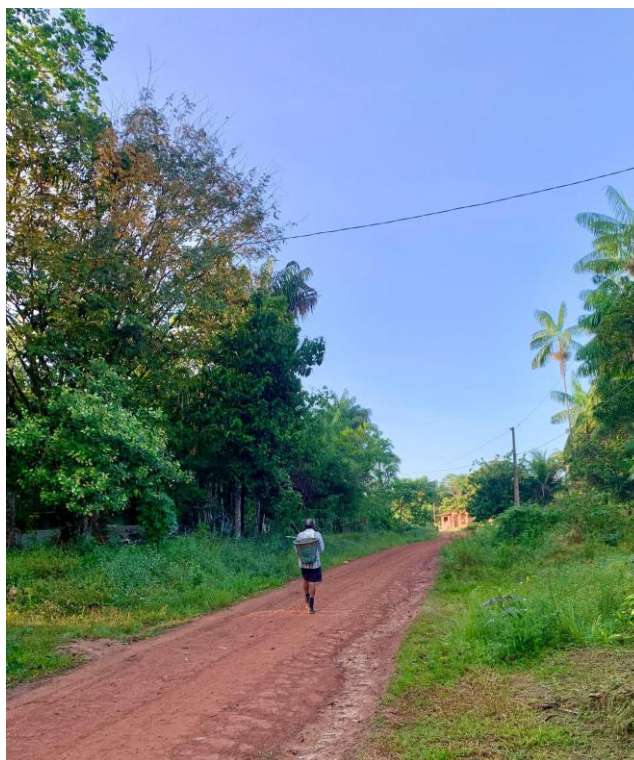
12ª Imagem – A Estrada de Barro

O interior da casa de farinha, por sua vez, é um local que nos conecta diretamente com a simplicidade e a funcionalidade do trabalho coletivo. As tábuas de madeira, gastas pelo tempo, e os utensílios manuais usados na torrefação da farinha revelam o caráter artesanal da produção. A luz suave que entra pelas folhas da vegetação cria uma atmosfera de intimidade, onde o trabalho não é apenas uma tarefa cotidiana, mas um ato impregnado de significados e tradições. Ali, homens e mulheres se alternam no processo de produção, reforçando a ideia de coletividade e união, fundamentais para a manutenção da cultura quilombola. A casa de farinha, portanto, não é apenas um espaço de produção alimentar, mas um ponto de encontro onde se transmitem saberes, se reforçam laços e se perpetua a memória cultural.