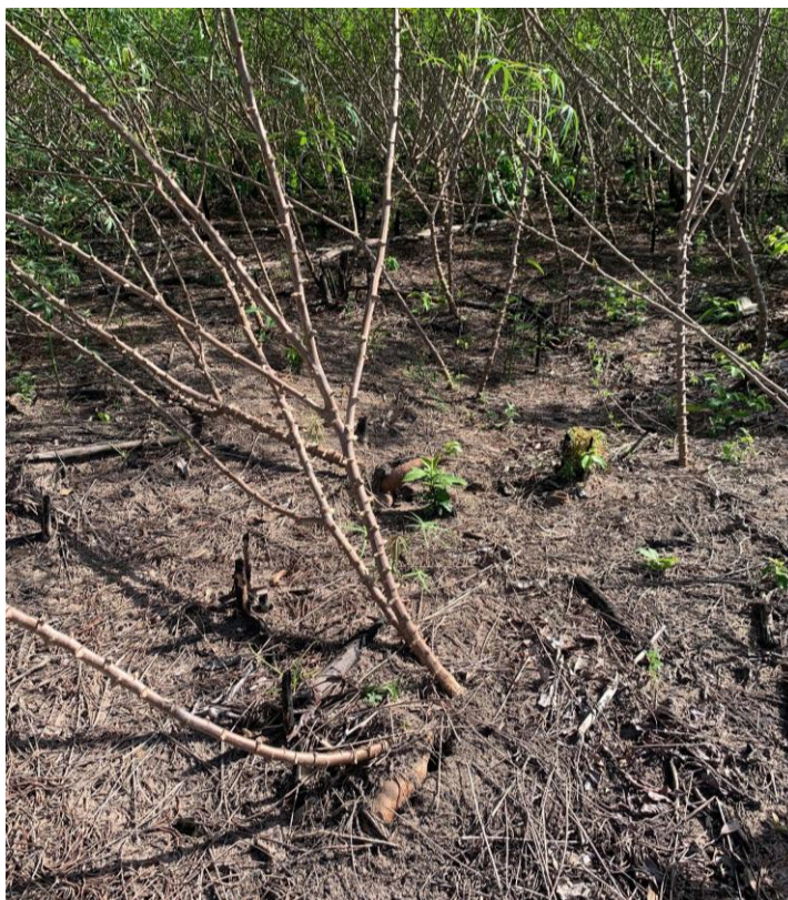
5ª Imagem – A Resistência da Terra: A Mandioca e o Solo Queimado

Mais do que um local de fabricação, a casa de farinha se torna um centro de troca de saberes e de fortalecimento. Ela é um símbolo da resistência cultural e econômica dos quilombolas, que, por meio dessa prática, afirmam sua herança africana e sua capacidade de adaptação ao longo do tempo. As casas de farinha, presentes em tantas comunidades quilombolas, são elementos-chave na preservação da identidade cultural. Isso reforça a necessidade urgente de políticas públicas que não apenas protejam os territórios, mas também as estruturas que sustentam seus modos de vida, garantindo que essa resistência e esse legado possam continuar a ser transmitidos pelas gerações futuras.