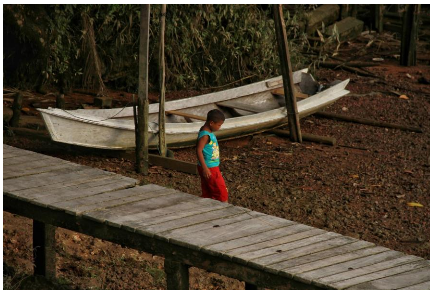
25ª Imagem - Beira do rio seca e criança