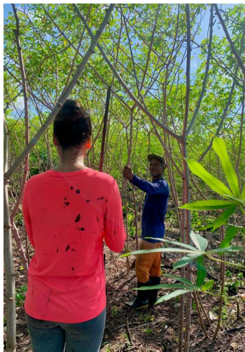
3ª Imagem – O Trabalho na Roça

A agricultura familiar tradicional, longe de ser apenas uma fonte de sustento, é uma forma de resistência contra a marginalização histórica e uma afirmação da identidade e da cultura quilombola. Nesse contexto, a mandioca se torna não apenas alimento, mas um símbolo de luta e de resiliência, sustentando corpos que se recusam a ser apagados ou esquecidos.