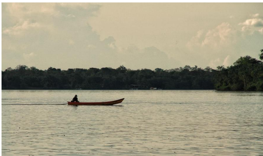
15ª Imagem - Homem em uma Rabeta