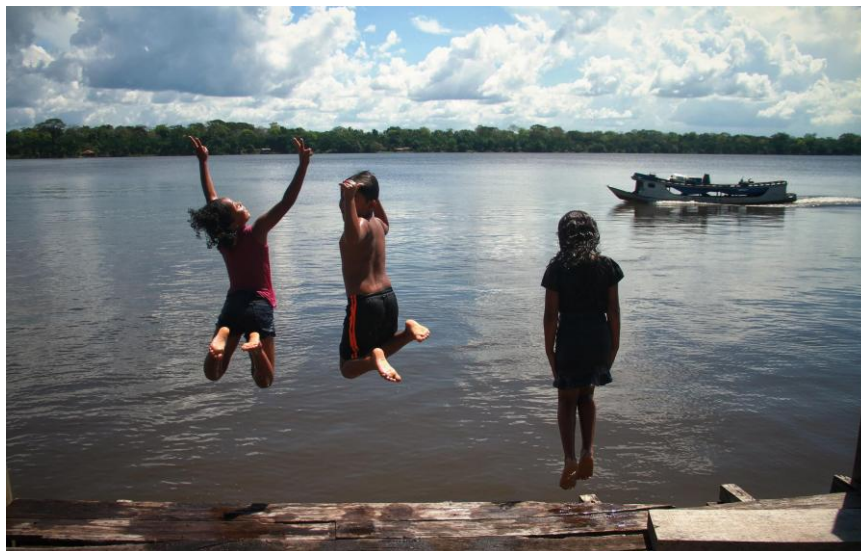
14ª Imagem - Crianças tomando banho no Rio Moju