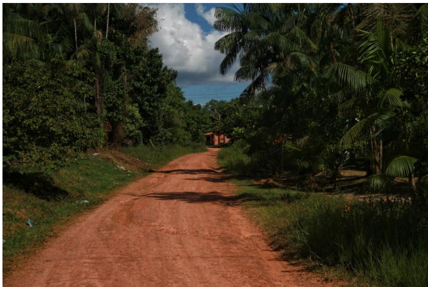
16ª Imagem - Estrada de barro