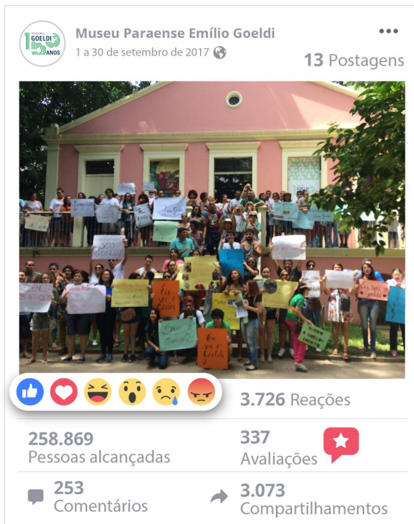
Figura 6 Infográfico com o total de alcance e compartilhamentos do conteúdo publicado no período de 1 a 30 de setembro de 2017 na página oficial do Museu Goeldi no Facebook sobre o possível fechamento da instituição.