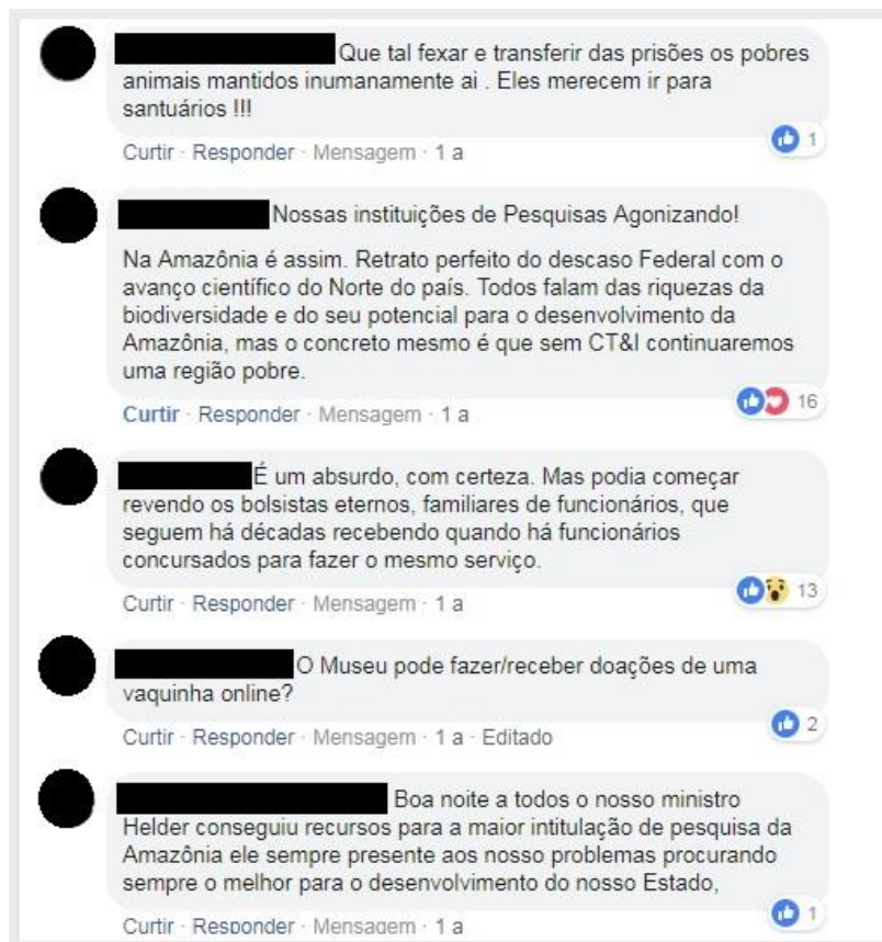
Figura 7 Reações de alguns usuários à publicação da carta que explicava a crise orçamentária do Museu Goeldi.