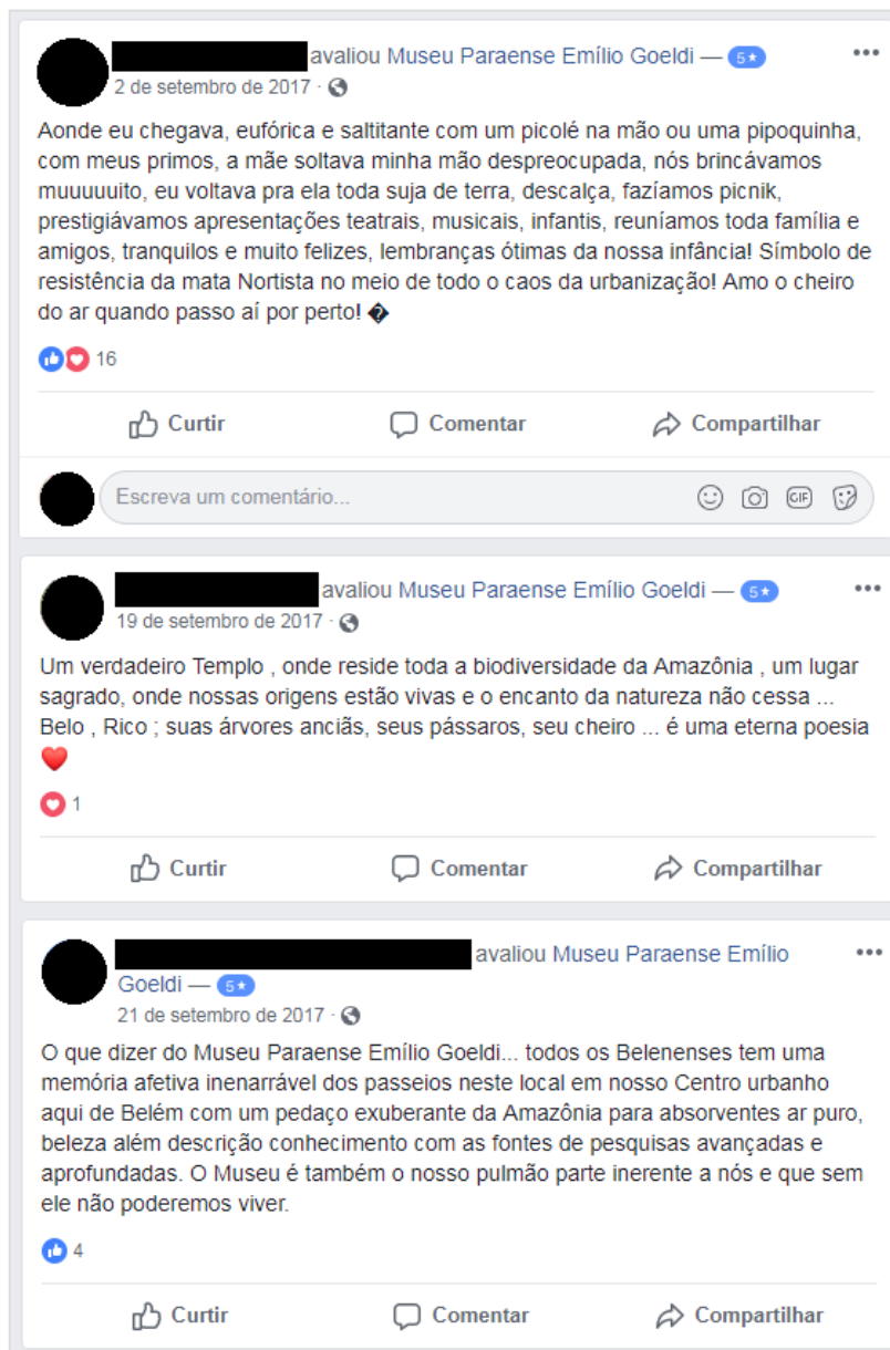
Figura 8 Mensagens publicadas junto com as avaliações de usuários do Facebook na página do Museu Goeldi, destacando suas relações e memórias com a instituição. Os três abaixo atribuíram valor máximo à página.