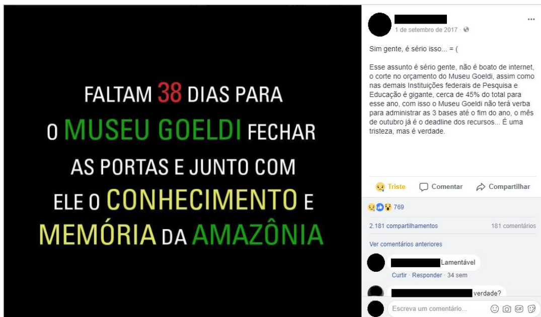
Figura 1 Perfis pessoais no Facebook e no Twitter fizeram uma contagem regressiva alertando para o possível fechamento do Museu Emílio Goeldi, gerando milhares de compartilhamentos. Neste exemplo, 2.181 perfis compartilharam a imagem, que ressaltava a importância da instituição para o “conhecimento” e a “memória” da Amazônia.