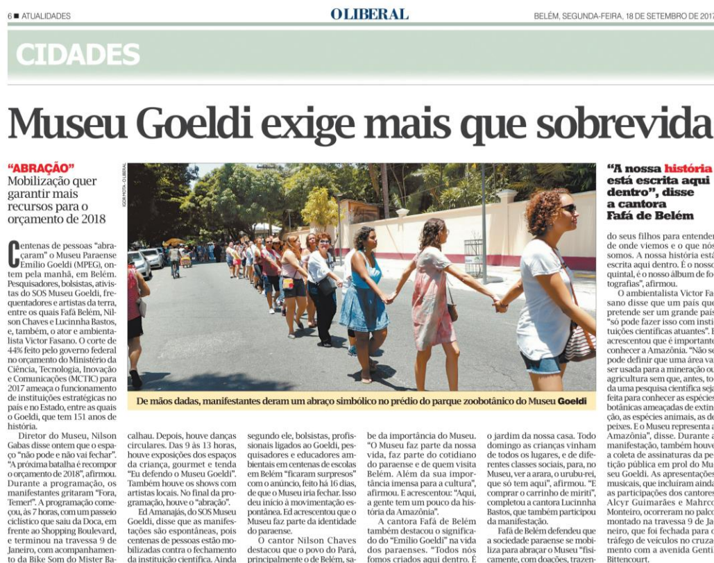
Figura 4 Reportagem publicada no jornal O Liberal sobre o Abraço no Museu Goeldi.

Nesse exercício de construção conjunta de um espaço público realizado também pela imprensa, pretende-se, futuramente, analisar de que forma a cobertura da mídia impressa local (no caso, os jornais O Liberal e Diário do Pará ) construiu a imagem da instituição, definindo os aspectos que foram mais relevantes para as publicações.