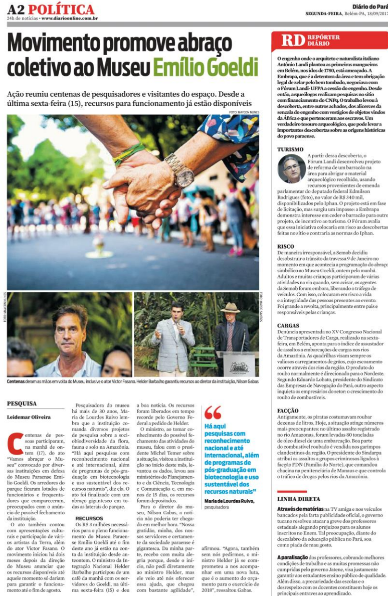
Figura 5 Reportagem publicada no jornal Diário do Pará sobre o Abraço no Museu Goeldi.