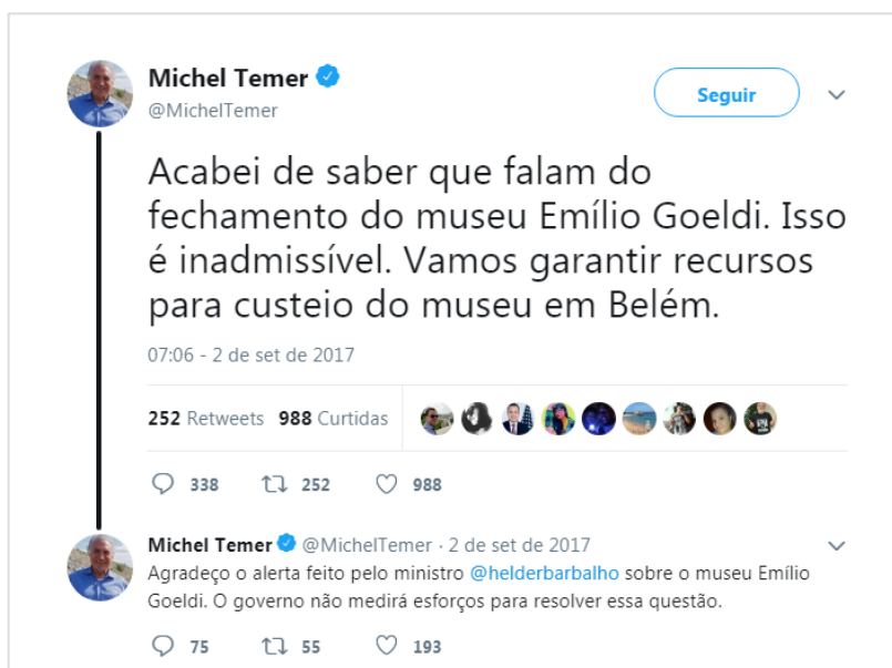
Figura 2 No dia 2 de setembro de 2017, o presidente Michel Temer anunciou em seu perfil oficial no Twitter a garantia de recursos para o funcionamento do Museu Goeldi.