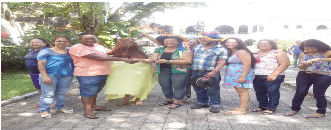
Figura 28 – Equipe da Biblioteca Avertano Rocha