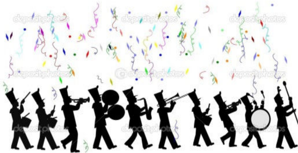
Figura 17 - Logo das Bandas de Fanfarras