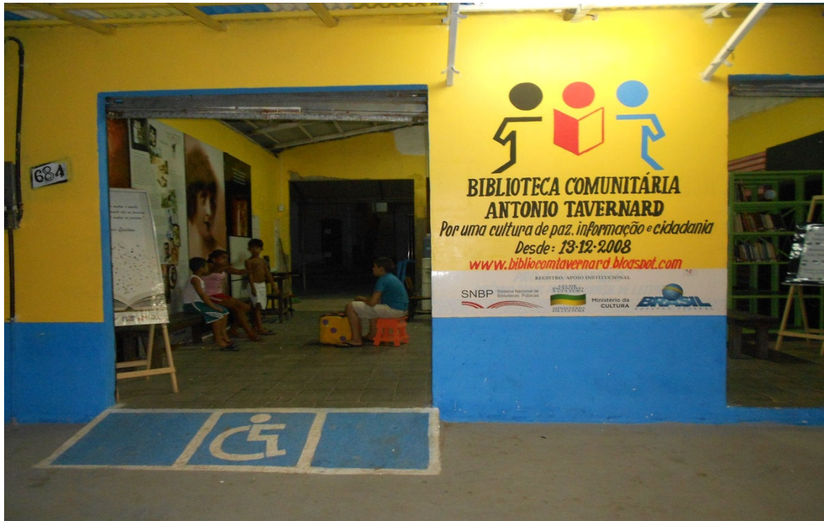
Figura 3 – A Biblioteca depois da reforma