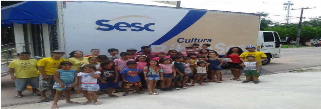
Figura 27 – Crianças após a visita do ônibus BiblioSESC.