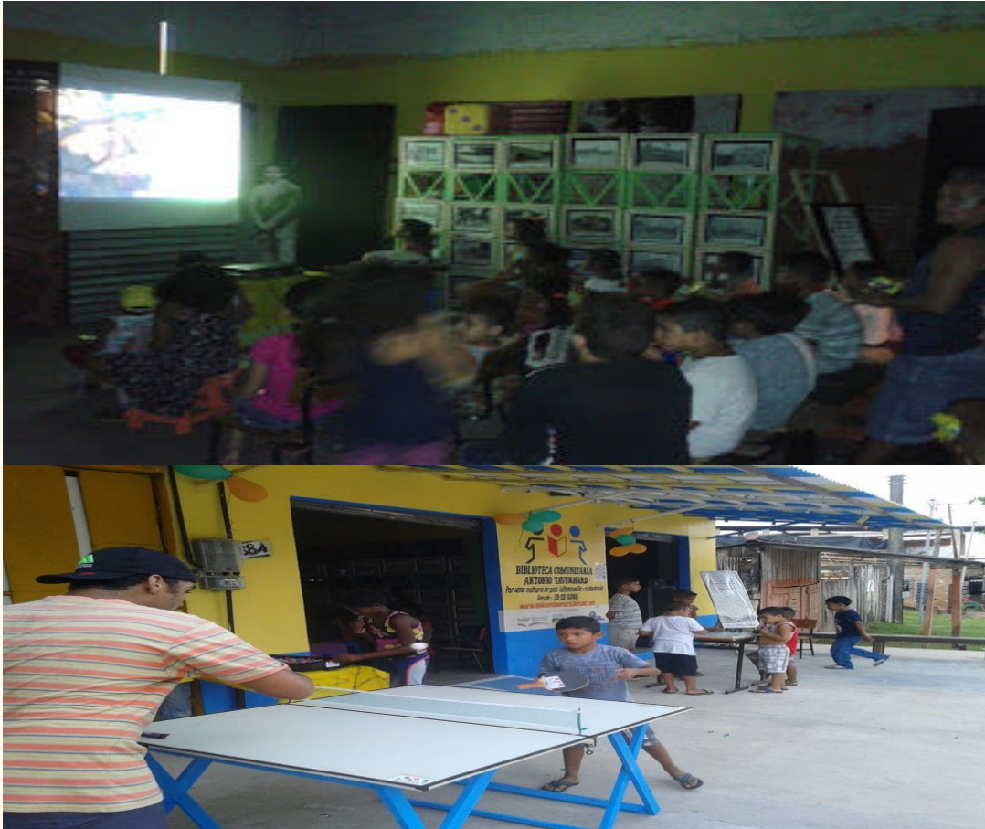
Figura 20 e 21- Crianças assistindo sessão de cinema e brincando na frente da Biblioteca