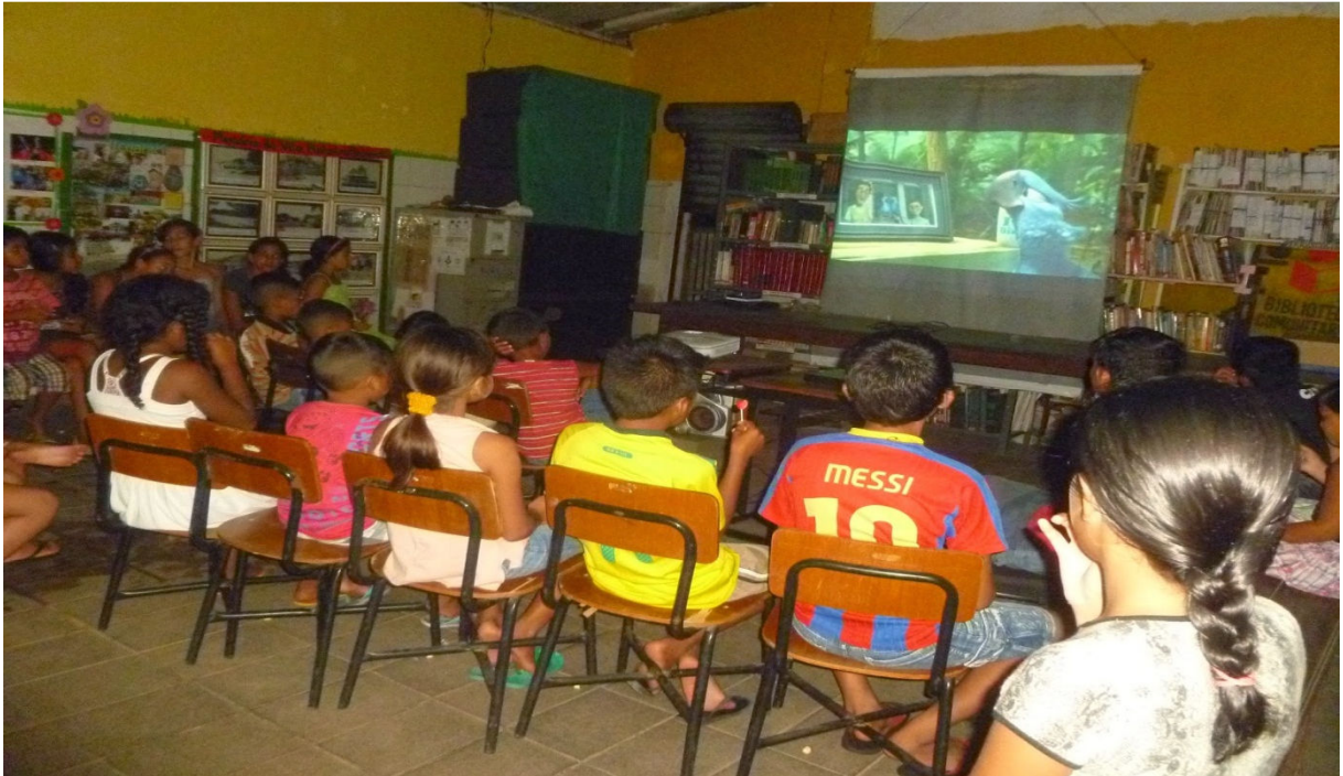
Figura 4 - Sessão de cinema na Biblioteca