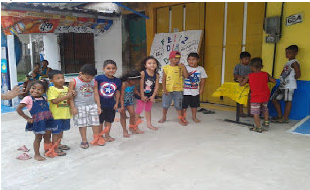
Figura 19 - Crianças posando pra foto