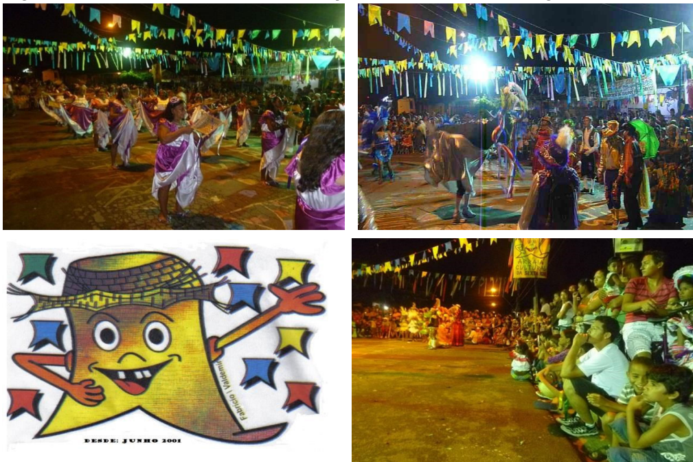
Figuras 9, 10, 11 e 12 - Pessoas dançando, assistindo e o logo do Arraial Cultural