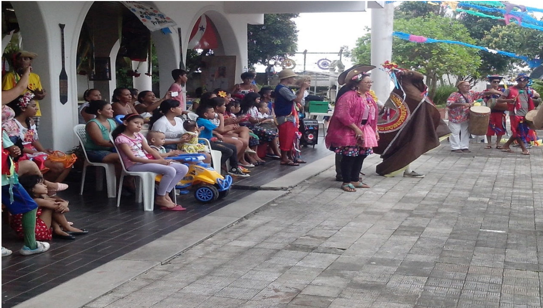
Figuras 29 - Ações da Biblioteca Avertano Rocha