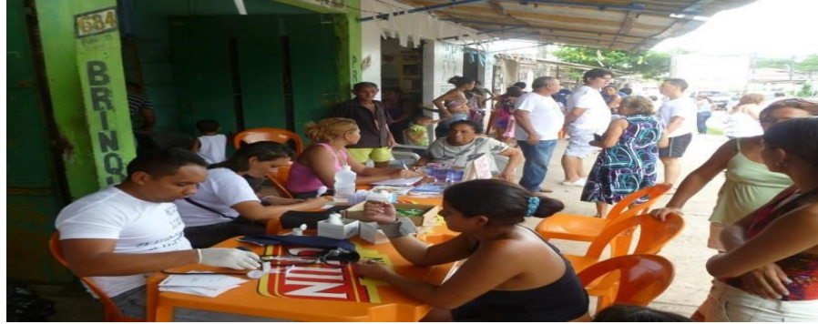
Figuras 5 - Pessoas sendo atendidas e os colaboradores da ação