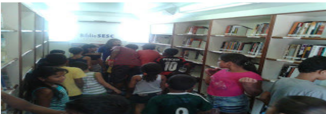
Figura 26 - Ações do ônibus BiblioSESC.