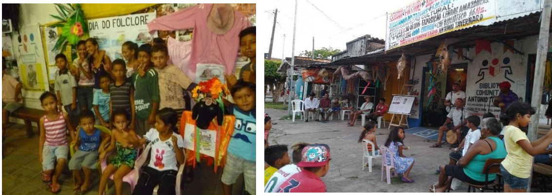
Figura 13 e 14 - Crianças posando pra foto e a frente da Biblioteca