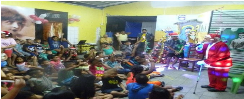
Figura 7 - Papai Noel declamando poema de cordel para as crianças