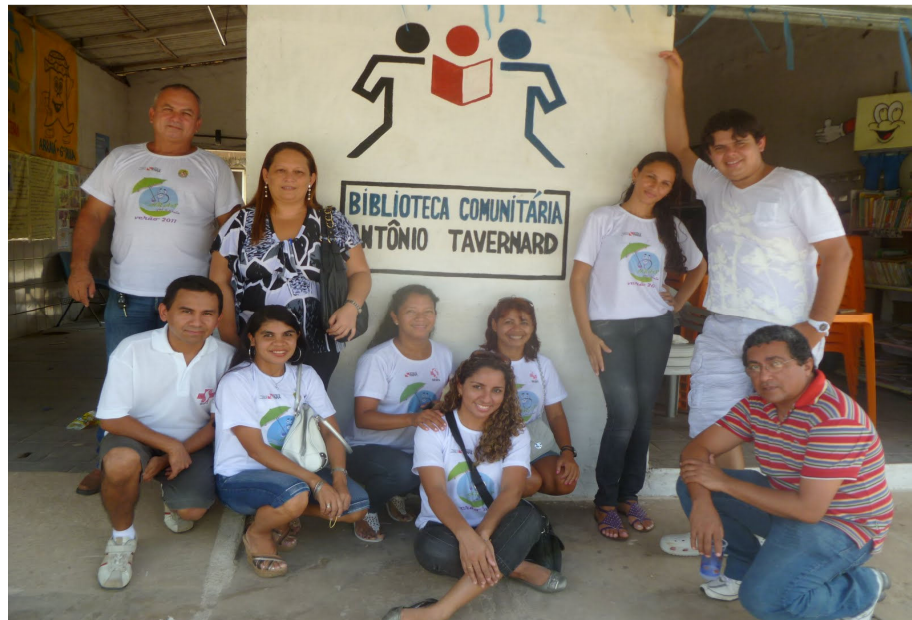
Figuras 6 – Equipe de colaboradores da ação social