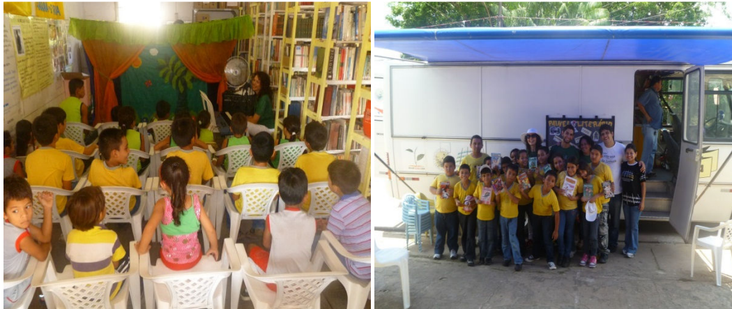
Figuras 30 e 31 - Ações do ônibus da Fundação Cultural do Pará.