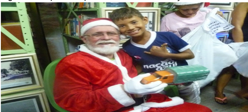
Figura 8 - Papai Noel presenteando uma criança