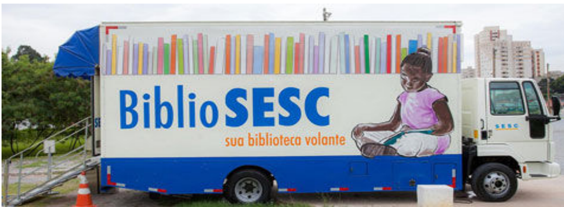
Figura 25 – Ônibus Biblio SESC