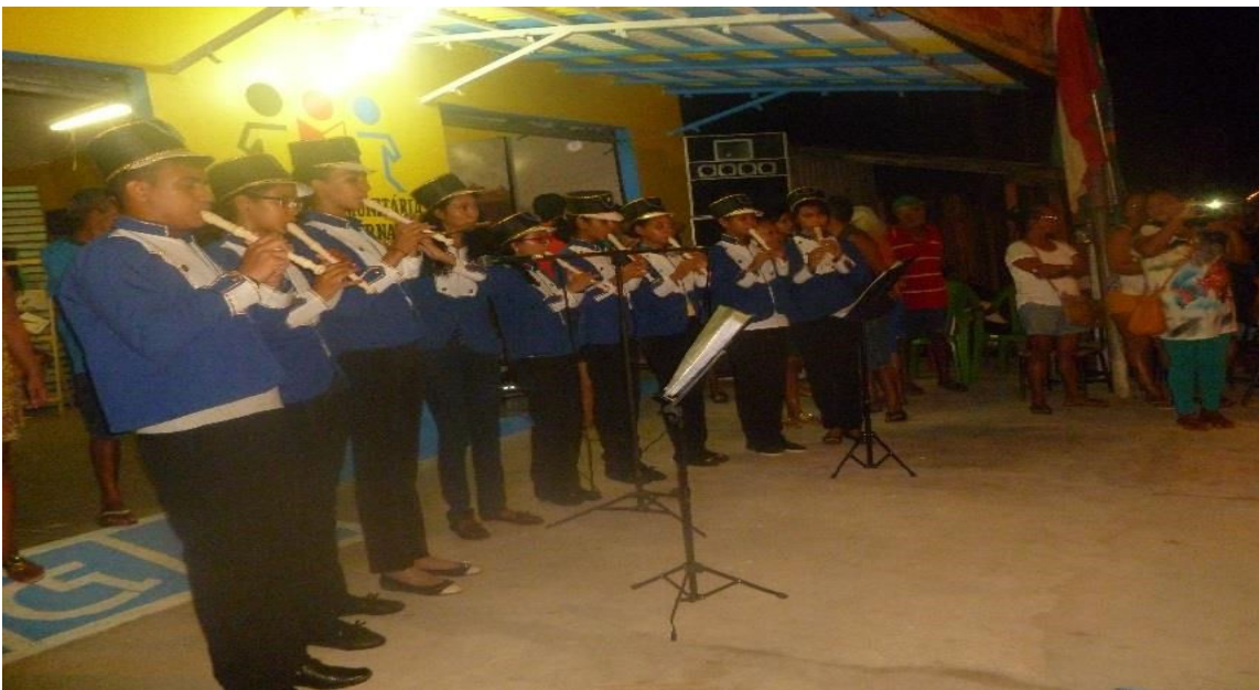
Figura 18 - Flautistas da banda se apresentando