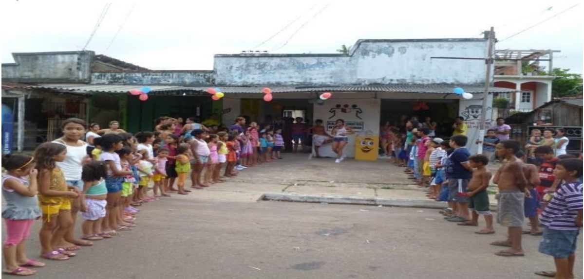
Figura 2 – A Biblioteca antes da reforma