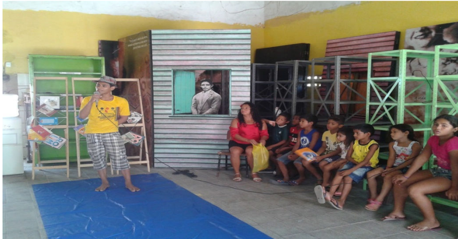
Figura 15 - Contação de histórias