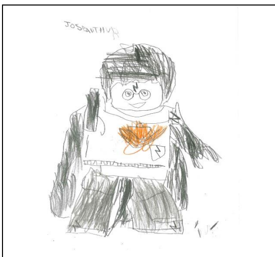
Fig. 4. Desenho de Lucas

Olhando pelo lado pedagógico o desenvolvimento de Lucas essas habilidades de inventar, pintar e colar precisariam ser melhor aproveitadas com propostas pedagógicas para que ele seja contemplado no que sabe fazer (Figuras 4 e 5).