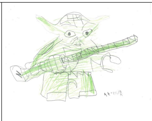
Fig. 5 Desenho de Lucas

A Declaração Mundial de Educação para todos no artigo 1 define assim: