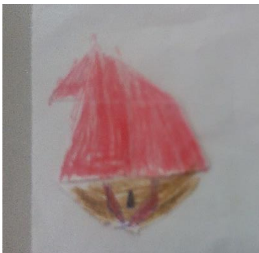
Figura 1. Pintura e colagem do aluno autista

O interesse restrito pode ser utilizado, de início, para se aproximar da criança. O assunto de sua preferência funcionará como uma porta de acesso à sua comunicação. O interesse restrito não deve ser proibido ou retirado da criança. Apenas precisamos usar a criatividade para explorá-lo, visando o desenvolvimento em outras áreas, bem como despertar o interesse por novos assuntos (PULY,2016).