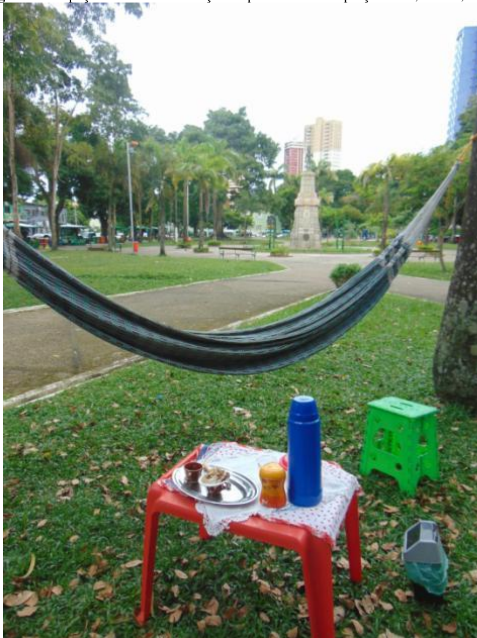
Figura 7 – Espaço montado a realização da performance na praça Brasil, Belém, Pará.

ajudar nesse dia tão importante para mim. Todos me ajudaram cada um de uma forma, como a colocar as redes, nas fotos, no apoio moral, me incentivando. Quando colocamos a rede na praça em pleno horário comercial, todas as pessoas ficavam se perguntando o que estava acontecendo, eu ficava com medo, me perguntando que horas iriam expulsar-me de lá.