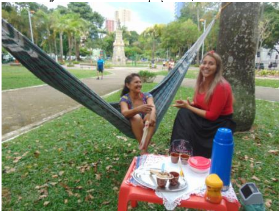
Figura 11 – Performance na praça Brasil, Belém, Pará.

A lembrança de si fez ela perceber que não queria que eu desistisse de tentar como ela, em relação ao fazer o café, ela se virou para mim e disse: você não pode desistir de tentar, você tem que tentar até conseguir, faça refaça e só se sinta vitoriosa quando conseguir executar a sua tarefa, me prometa que você vai tentar fazer esse pudim novamente? Eu disse que sim que não iria mais desistir só porque sugeriram alguns obstáculos, me possibilitando essa transformação .