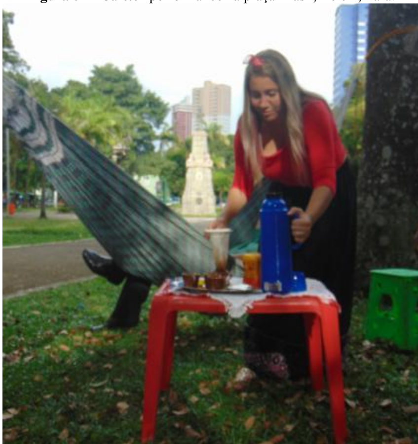
Figura 8 – “Cafeto” performance na praça Brasil, Belém, Pará.

Colocamos a rede, a mesa com as xícaras, as garrafas sobre a mesa, enfim, com tudo que precisava para a performance. Fiquei esperando, quando vejo vários homens que trabalham na praça como taxista, fiquei com tanto medo, mas recebi com muita dedicação. Porém o rapaz que veio até minha rede veio com a intenção de bagunçar com os amigos todos observando, batendo fotos e fazendo piadas, estava totalmente desconfortável e muito triste, pois a experiência não havia funcionado como das outras vezes, foi então que começou a chover e o rapaz resolveu ir embora com os demais amigos. Depois analisando com atenção, encarei essa situação como um aprendizado, pois temos que aprender a lidar com as frustrações, coisa que tive que aprender depois de adulta.