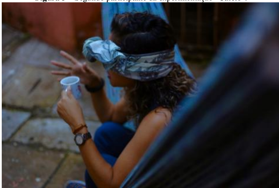
Figura 3 – Segundo participante da experimentação “Cafeto”.

Quando arrumamos tudo, veio logo outra participante, a recebi da mesma forma que tinha recebido o anterior, porém quando lhe ofereci um café ela me disse que não bebia café, e agora, o que fazer? Então, lembrando que apenas o aroma do café nos desperta sensações e lembranças. Fiz-lhe um café, mas pedir para ela apenas sentir o doce aroma e conversamos. Uma das primeiras lembranças que o cheiro fazia despertar eram lembranças ruins para ela, uma delas era o motivo de não tomar café por conta de uma gastrite adquirida por conta da maravilhosa bebida e que ele lembra a época que trabalhava em escritórios e que o café era uma forma de amenizar a fome. A outra lembrança era de um velório, eu confesso que fiquei surpresa por que eu não sabia que era comum servir café em velórios. No entanto, sei que café ele aquece a alma quando está ferida.