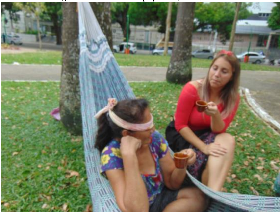
Figura 10 – Performance na praça Brasil, Belém, Pará.