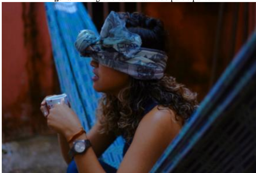
Figura 4 – Registro da narrativa do participante.

dissemos o quanto não gostávamos dos nossos nomes, pois eles eram compostos e são dois nomes que não combinam juntos, eu também compartilhei com ela os nossos românticos cafés da tarde.