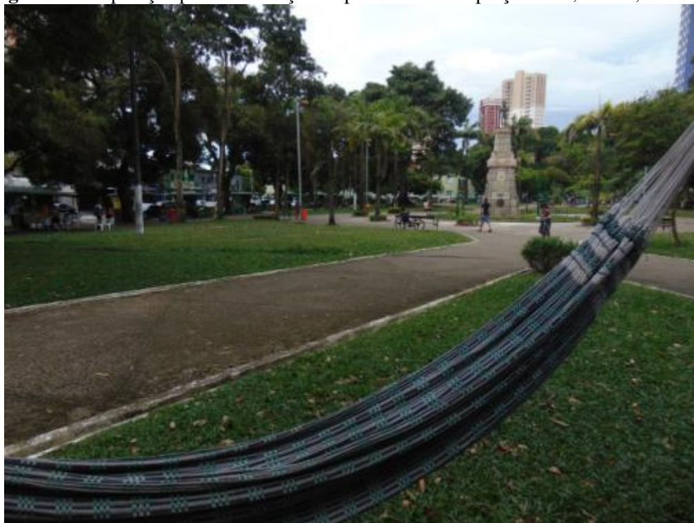
Figura 6 – Preparação para a realização da performance na praça Brasil, Belém, Pará.

urbano, lembra que da ultima vez que nos falamos, eu ainda não sabia onde iria realizar e você me pediu para lhe manter informado de todo o processo. Pois bem encontrei um lugar ideal. A Praça Brasil na qual é uma praça localizada no centro de Belém no bairro chamado Umarizal, porque escolhi essa praça, visto que e uma das poucas praças que não expulsam artistas.