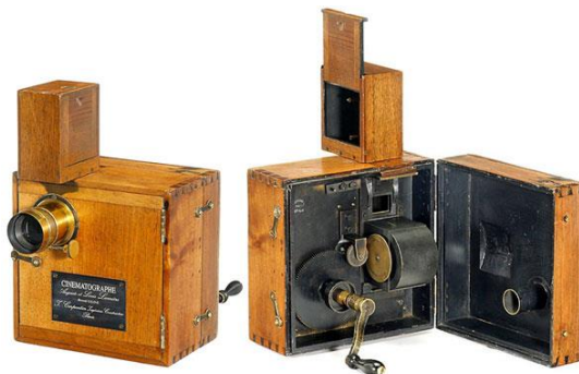
Figura 1: Cinematógrafo

Mesmo que despreziosamente, nascia uma tecnologia completamente inovadora para a época, a qual depois de aperfeiçoada, poderia simular e adaptar com êxito a maioria das histórias imaginárias de diversos autores.