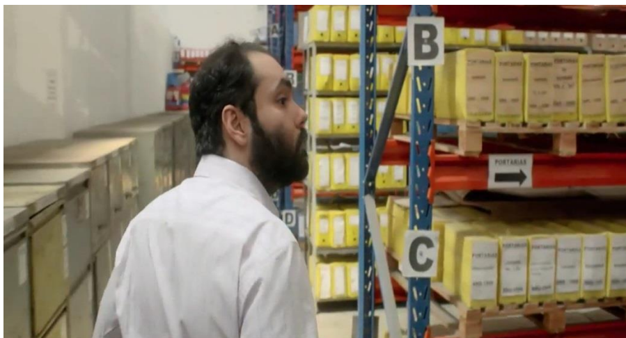
Figura 8: O encarregado do arquivo

Ao deixar um único profissional, sem qualquer formação aparente na área de arquivo, percebemos o descaso por parte das autoridades competentes a qual desrespeita a legislação em vigor, ao demonstrar que não houve a contratação de arquivistas, nem técnicos em arquivo, desfavorecendo a gestão como um todo, nas quais enfatizo a falta de cuidado com o ambiente, sem limpeza periódica, mantendo o ambiente insalubre para qualquer pessoa que precise frequentar. O profissional desconhece a localização das seções e perde-se dentro do acervo. Quando encontra a pilha de caixas arquivo caídas no corredor, lamenta-se e manda as usuárias procurarem pela informação, sem prestar qualquer ajuda adicional.