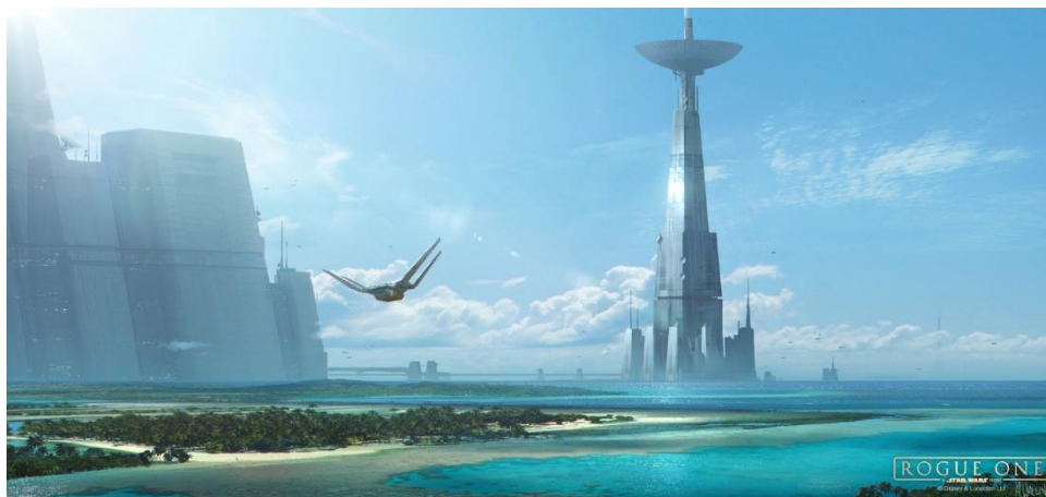
Figura 3: Torre da Cidadela

Ao chegarem no Planeta Scarif, Complexo de Segurança Imperial (01:23:26), os personagens se dirigem para o prédio principal, com uma enorme antena em seu topo, conhecida como Torre da Cidadela, a qual detém a tutela de todos os arquivos da estrutura imperial em seu acervo.