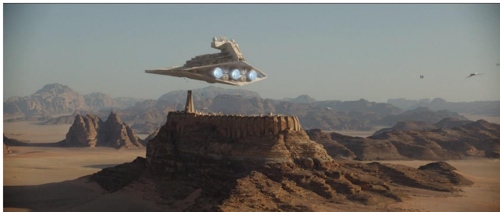
Figura 2: Destroyer do Império extraindo Cristais Kyber

piloto desertor, retiram a informação do mesmo, através de um processo de lobotomização.