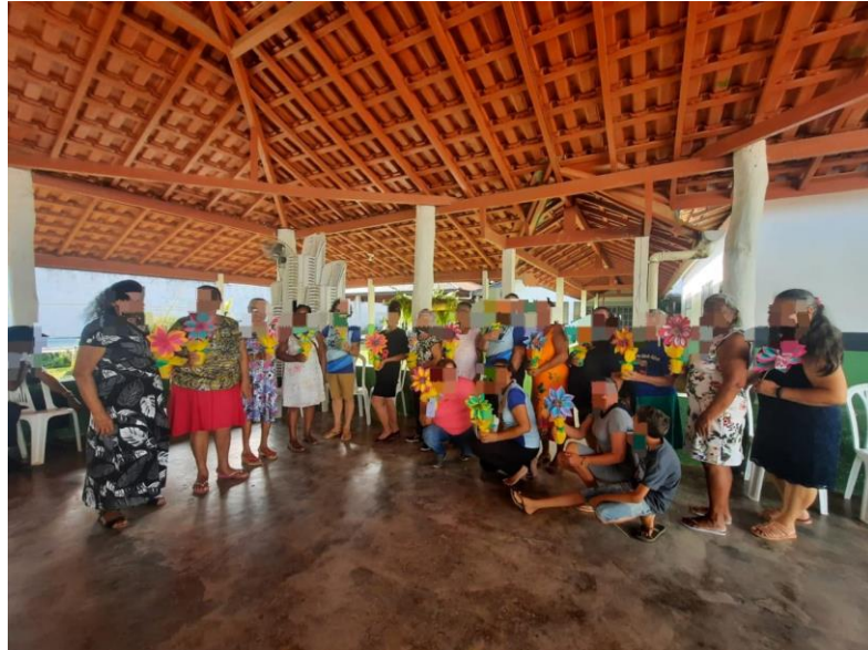
Figura 8 - Confeção de flores para a exposição na Noite Cultural dos Idosos

propostas no SCFV incluem a Confeção de Flores para a Noite Cultural dos Idosos, além de outras, como o Desenho às Cegas e a confecção de bandeiras com arroz e tinta guache.