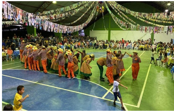
Figura 7 - Festa Junina de Brasil Novo