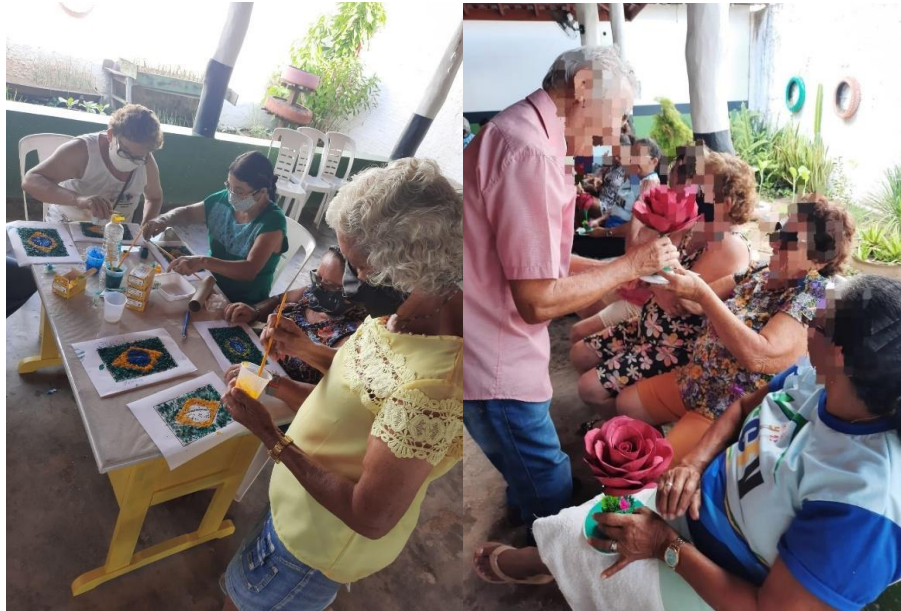
Figura 10 - Confecção de bandeiras e Entrega de lembranças no Dia das Mães

construtivo para um envelhecimento ativo, saudável e autônomo”. Essas ações mostram-se capazes de ir além, alcançando não só os educandos, mas outros agentes envolvidos no processo educacional, desconstruindo assim preconceitos intergeracionais.