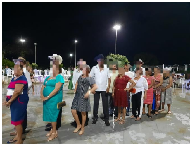
Figura 2 - Forró na Praça Municipal de Brasil Novo em comemoração ao Dia da Dança