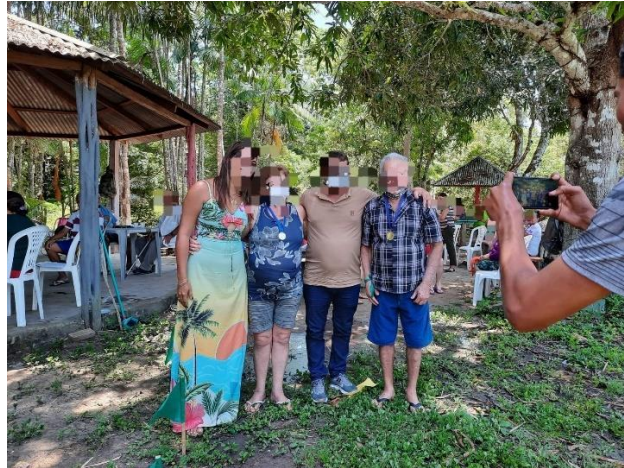
Figura 6 - Vencedores da Gincana do Dia do Idoso