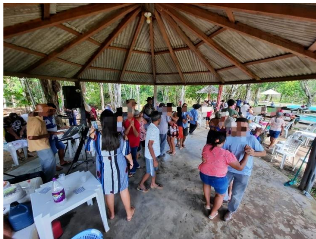
Figura 1 - Forró do Dia do Idoso

Diante disso, foram realizadas práticas como o Forró do Dia do Idoso e o Forró em Comemoração ao Dia da Dança: