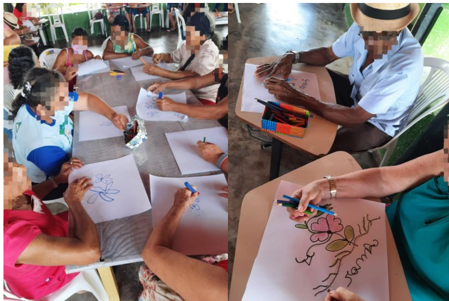
Figura 9 - Desenho às cegas