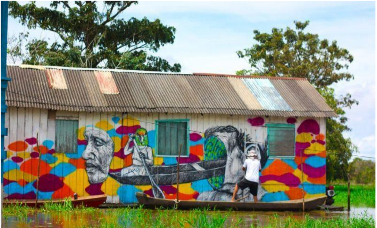
Imagem 01. Grafite Mural: “Vida ribeirinha”