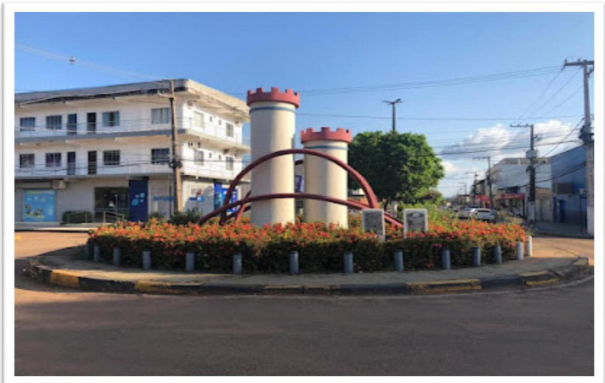
Imagem 06 Monumento dos Imigrantes. Inaugurado em 19 de dezembro de 2003