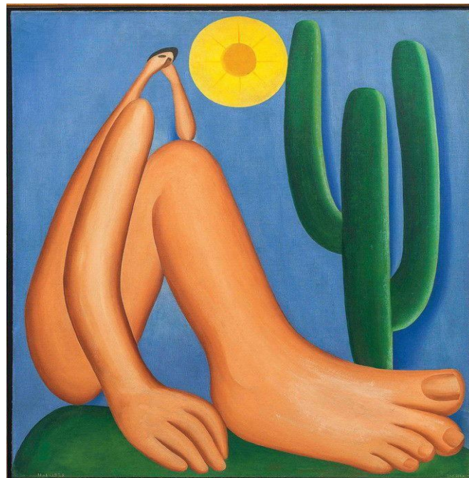
Imagem 02 Arte Abaporu, de Tarsila do Amaral