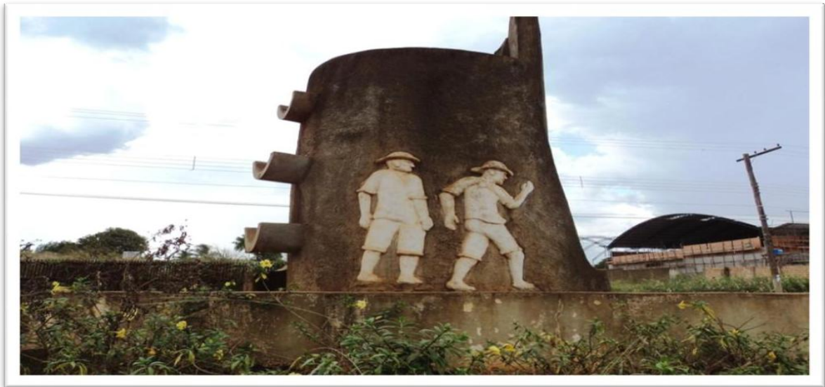
Imagem 05 Monumento dos Seringueiros