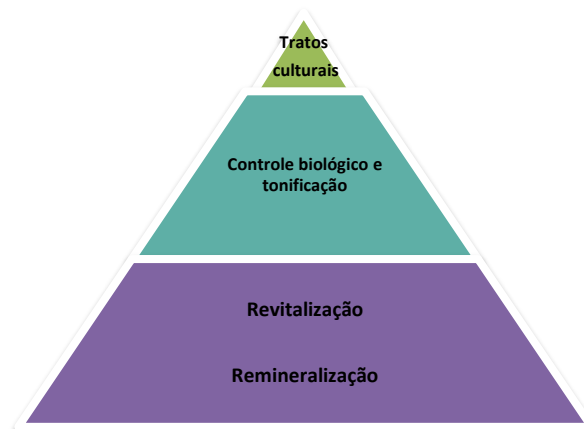
Figura 3. Esquema geral sobre a bioagricultura

No primeiro dia do curso foi realizada uma abordagem teórica sobre o cultivo e manejo orgânico das plantas e as alternativas, foi explanado que o fator principal para uma boa cultura é o manejo do solo. Foi explicado que a remineralização é a camada abaixo da primeira camada do solo, é necessário fazer a reposição de reserva nutricional em terrenos com pouca solubilidade, contribuindo para recuperação de solos, aumentando a produção de nutrientes essenciais para um bom desempenho das plantas, sendo utilizado neste processo alguns minerais,