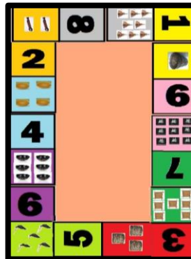
Figura 1: exemplo do dominó.

A aula em si contou com o restante da confecção dos dominós, visto que os papéis de fabricação foram levados cortados, mas faltava colar as figuras e assim os alunos iniciaram montando o jogo que posteriormente seria utilizado pelos mesmos.