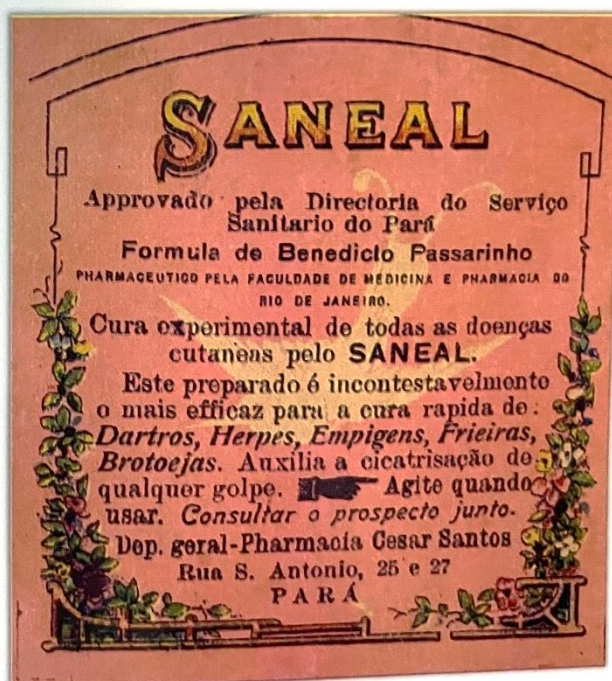
Figura 5. Saneal , da Pharmácia e Drogaria Cesar Santos, 1911.