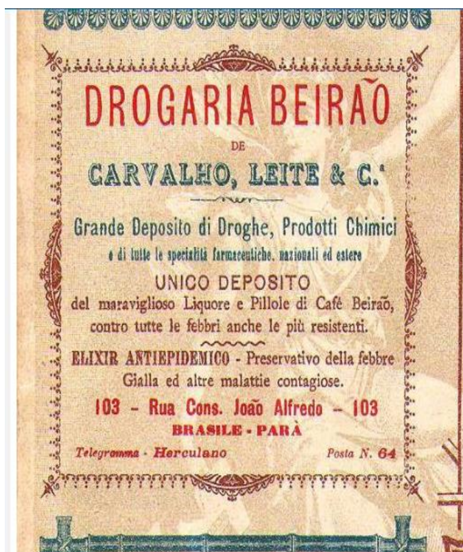
Figura 3. Drogaria Beirão