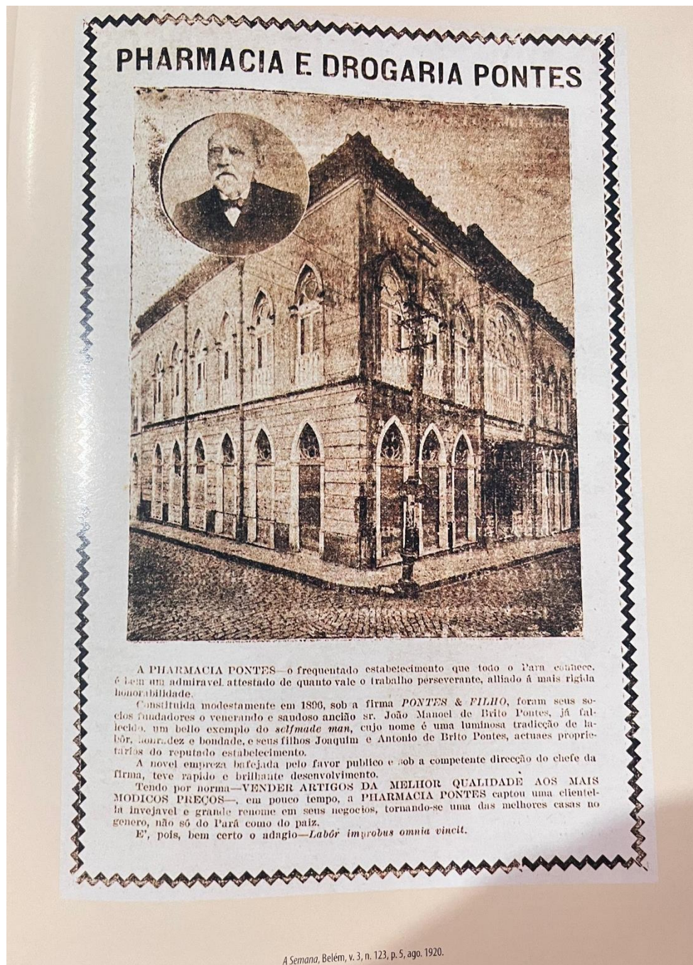
Figura 4. Pharmacia e Drogaria Pontes