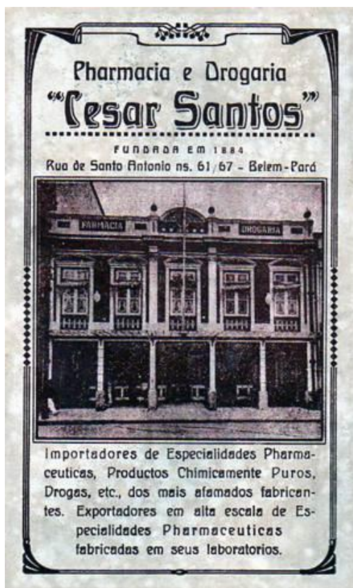
Figura 2. Pharmacia e Drogaria “Cesar Santos”