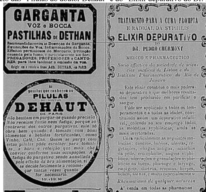
Figura 7. Anúncio das “Pílulas do doutor Dehaut” e do “Elixir depurativo do Dr. Pedro Chermont”.