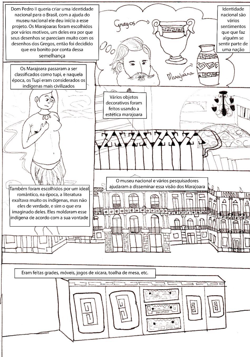
Figura 2 – segunda página da HQ "desenhando a arqueologia amazônica".