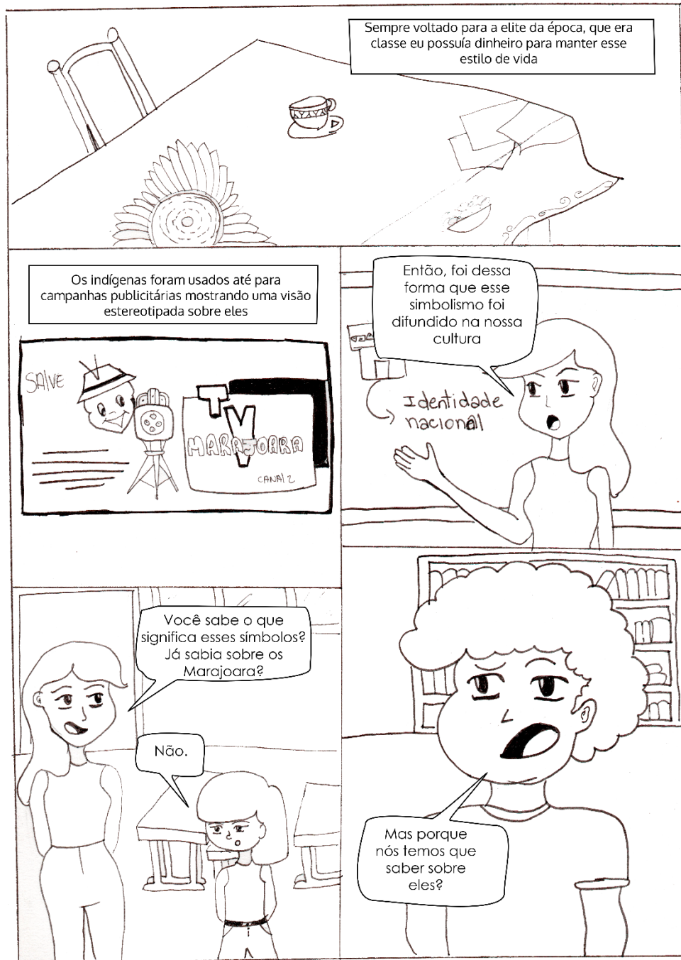
Figura 3 – terceira página da HQ "desenhando a arqueologia amazônica".