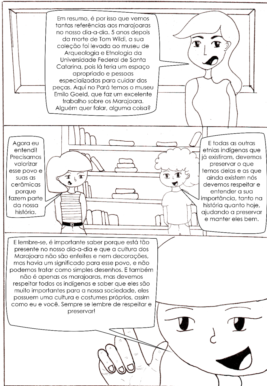
Figura 6 – Sexta página da HQ "desenhando a arqueologia amazônica".