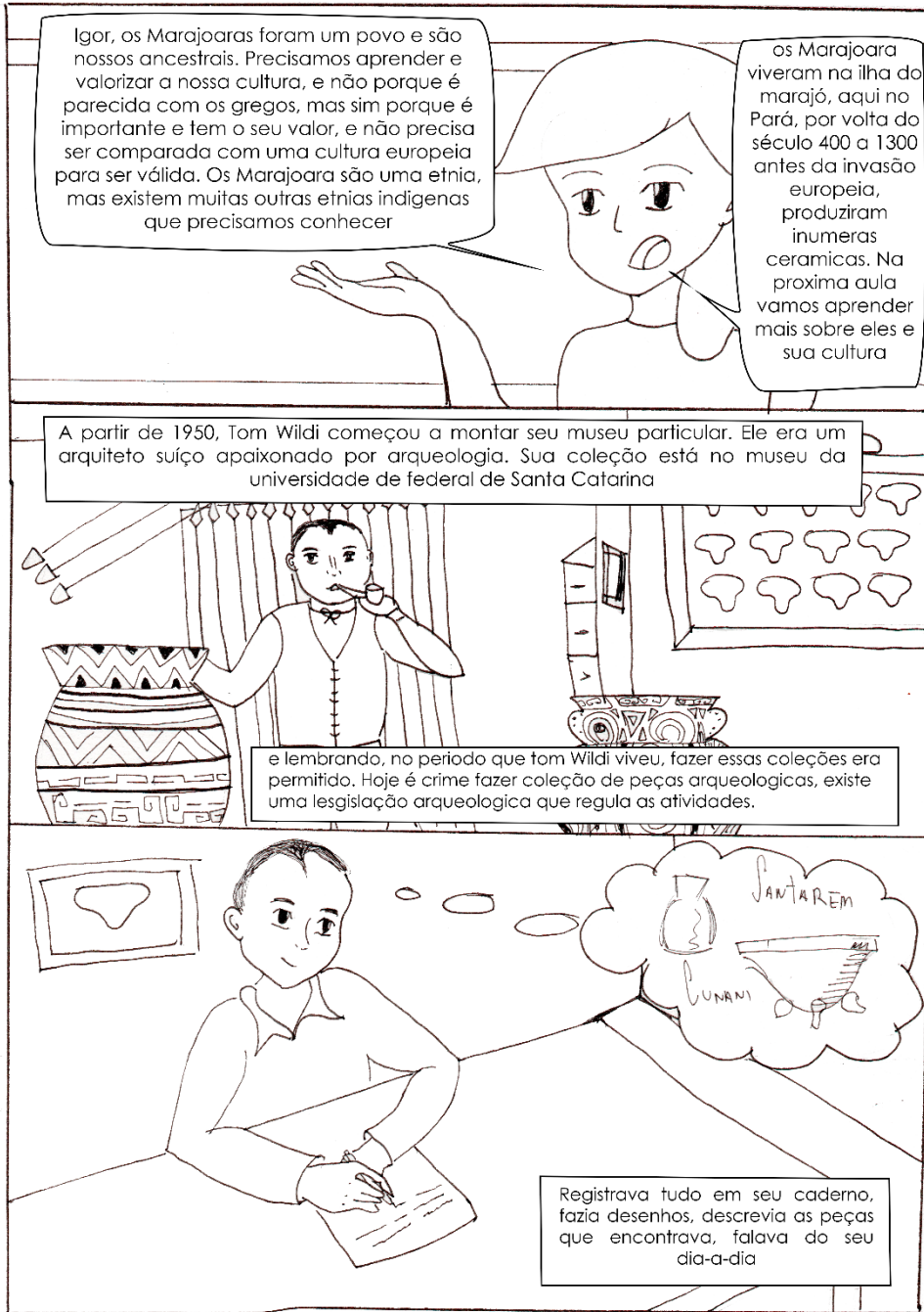
Figura 4 – Quarta página da HQ "desenhando a arqueologia amazônica".