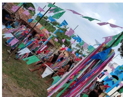
Figura 03: Apresentação do Boi Mirim, no projeto Aldir Blanc.