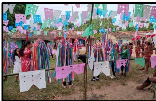
Figura 02: Apresentação do Boi Miri de Calados.

A visão do entrevistado é despertar interesse nas crianças pela cultura do boi, para que se possam fortalecer os conhecimentos por ela produzidos torcendo para que no futuro possa colher bons frutos. Essa estratégia que possibilita o contato com a cultura na tenra infância, pois esta é uma fase que as crianças têm muita curiosidade por aprender e essa atividade cultural do Boizinho, entra nos gostar infantil por ter muitas referências com a ludicidade dessas faixas etárias. Essas crianças são as que vêm nos mostrando que isso é possível, brincar, se divertir com a cultura do boi, como se observa nas figuras (02 e 03).