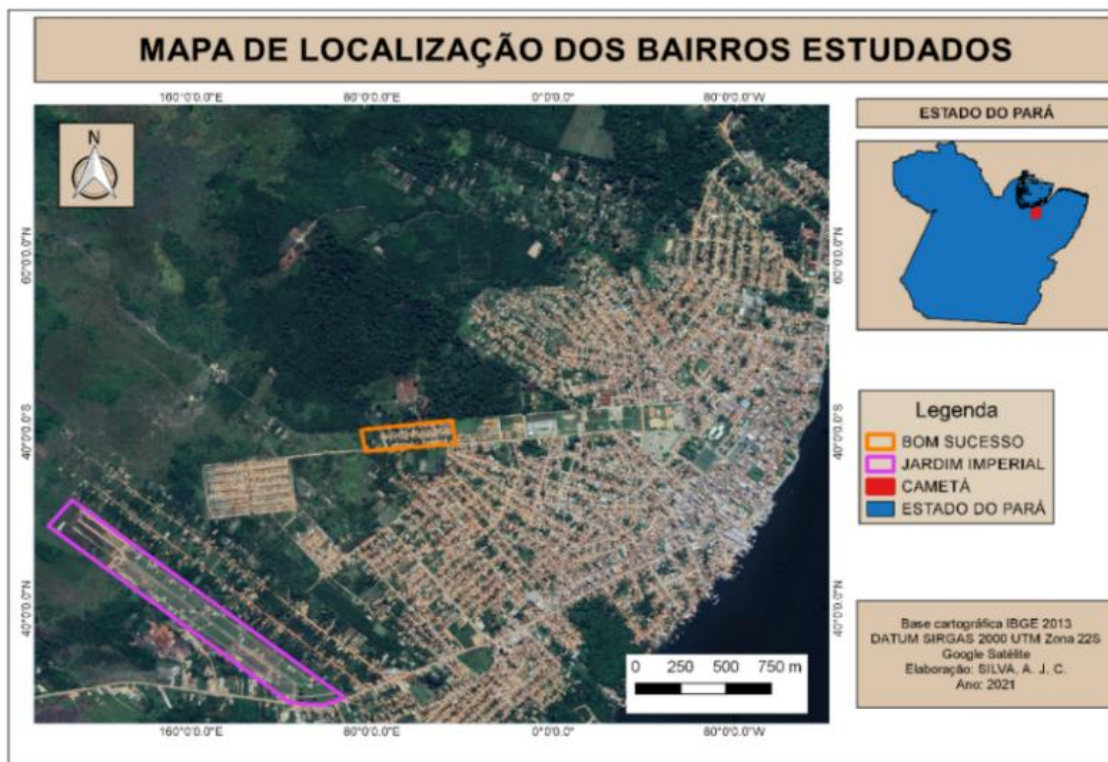
Figura 1: Mapa de localização dos bairros Bom Sucesso e Jardim Imperial na zona urbana de Cametá-PA