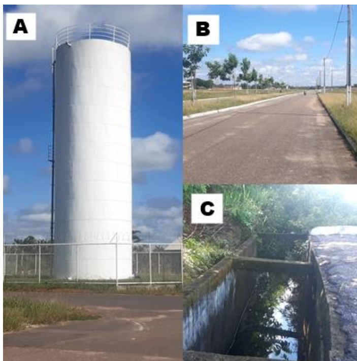
Figura 4: Imagens do bairro Jardim Imperial: (A) caixa d'água para atender os moradores do bairro; (B) asfaltamento da via; (C) galeria para o transporte águas pluviais.

empresa responsável pela obra construiu uma galeria a céu aberto, para as águas pluviais, que serve de vetor para a proliferação de insetos que transmitem doenças para os moradores (Figura 4C).