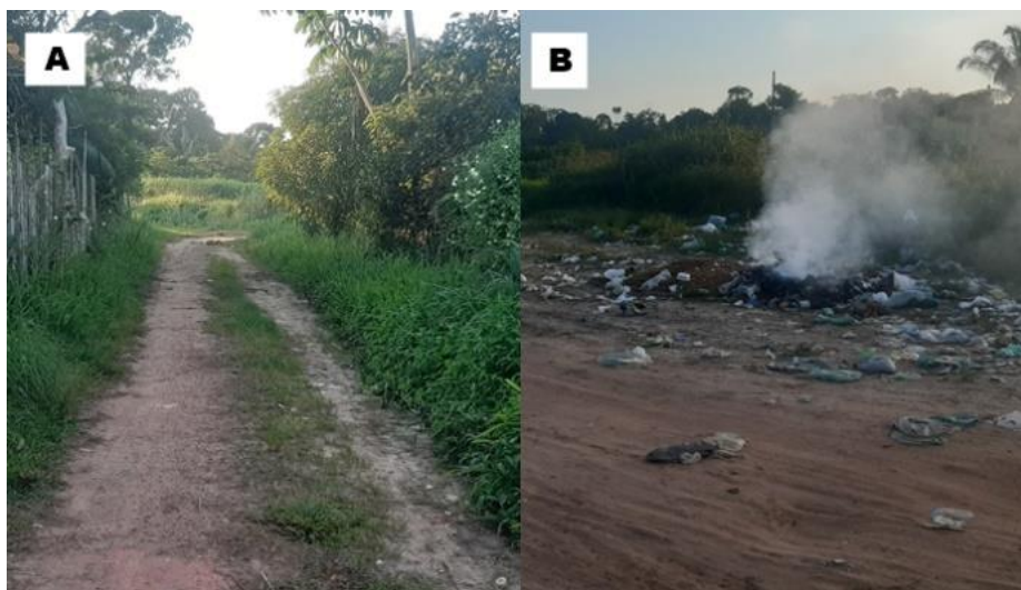
Figura 3: Imagens do bairro Bom Sucesso: (A) Ausência de asfaltamento e presença de vegetação nas margens da via; (B) Acúmulo e exposição de lixo a céu aberto.

Observa-se que atualmente o bairro Bom Sucesso (Figura 3) não dispõe de infraestrutura básica adequada para que a população local possa usufruir de um serviço de qualidade. Essas questões são afirmativas ao analisar a falta de pavimentação e presença de vegetação nas margens das vias (Figura 3A), o acesso a algumas ruas é limitado, em virtude do descarte irregular e exposição de acúmulo de lixo a céu aberto (Figura 3B), alguns moradores praticam a queimada dos resíduos ocasionando poluição atmosférica e possíveis doenças respiratórias, denunciando a realidade social de algumas famílias.