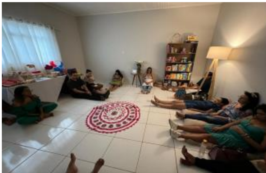
Momento de meditação e reflexão