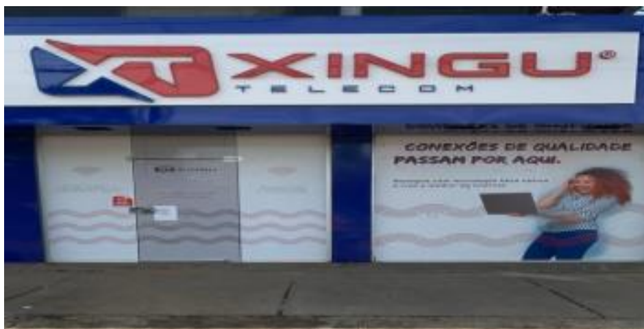
Frente da empresa Xingu Telecom

O referido estágio foi realizado na empresa Xingu Telecom, com sede na cidade de Altamira/PA, que possui filiais em Itaituba - PA e Brasil Novo - PA. Fundada em 2011, como nome de Brasil Networks, e transformada em Xingu Telecom em 2015, tem 50 funcionários distribuídos em diversos setores. A empresa sede, na qual foi realizado o estágio, é composta de dois prédios, o principal abriga grande parte dos funcionários, tem um estacionamento interno, uma recepção, sala do comercial, banheiros, uma copa, departamento de RH e DP, setor financeiro e setor de suporte técnico. No outro prédio abriga-se o almoxarifado, setor técnico operacional, setor de gerenciamento de redes NOC/CGR, banheiro, uma copa e estacionamento interno.