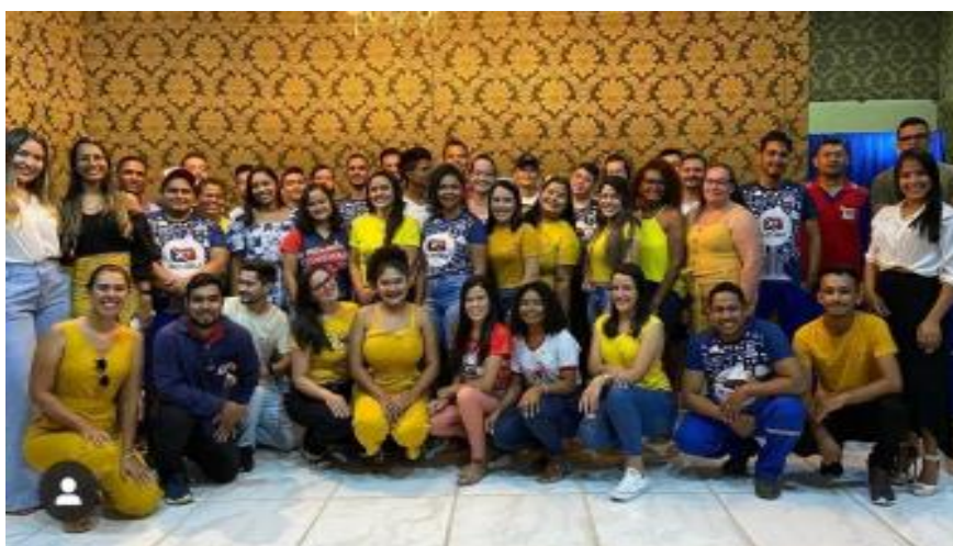
Colaboradores Xingu Telecom em Evento - Fonte: Gestora da Empresa

A partir da intervenção, os próprios colaboradores avaliaram as atividades realizadas, refletiram e puderam expor sobre a importância do seu trabalho para o sucesso da empresa e ainda mais importante, o seu desenvolvimento como pessoa e como profissional de excelência.