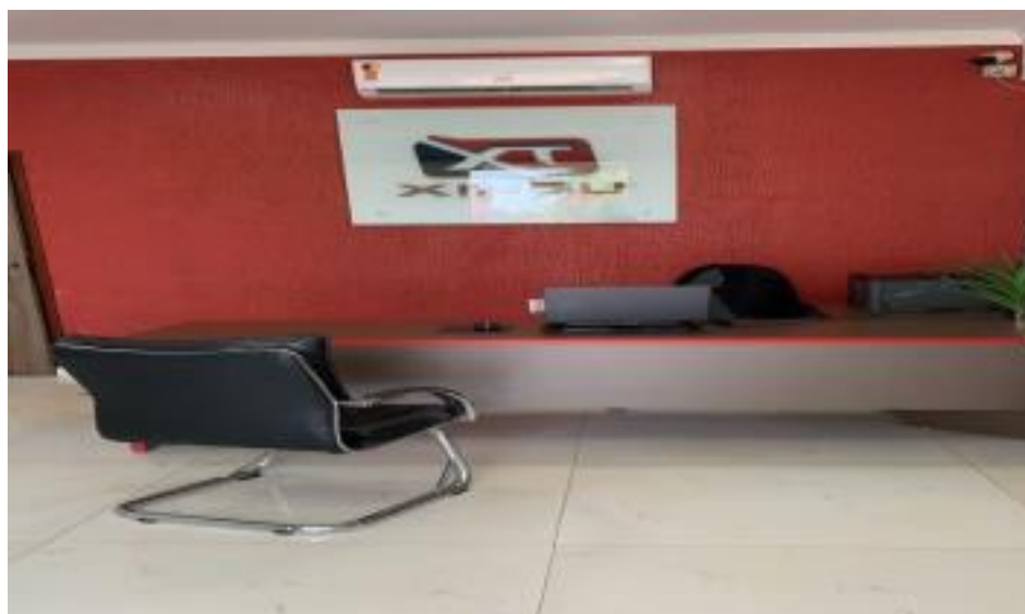
Recepção Xingu Telecom

A partir da observação do funcionamento da empresa percebeu-se que esta é bastante estruturada e organizada em seus diversos fluxos, porém alguns protocolos de atendimento