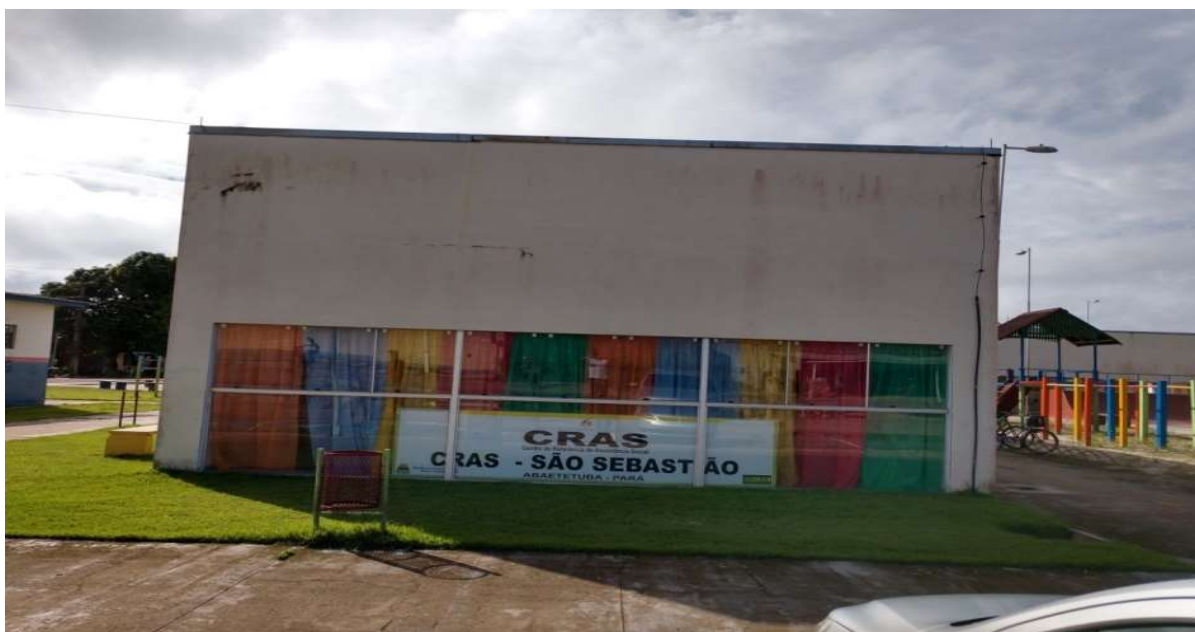
Figura 1

O CRAS de São Sebastião está situado na Rua Hildo Carvalho, Complexo CEU, foi implantado no dia 30/11/1995 e desde então vem desenvolvendo um trabalho através de medidas socioeducativas que tem proporcionado a esses indivíduos que participam do projeto mudanças de comportamento, afastando-os da violência, das drogas, da prostituição, possibilitando um novo olhar para essas crianças e adolescentes para que possam refletir e transformar a sua própria realidade.