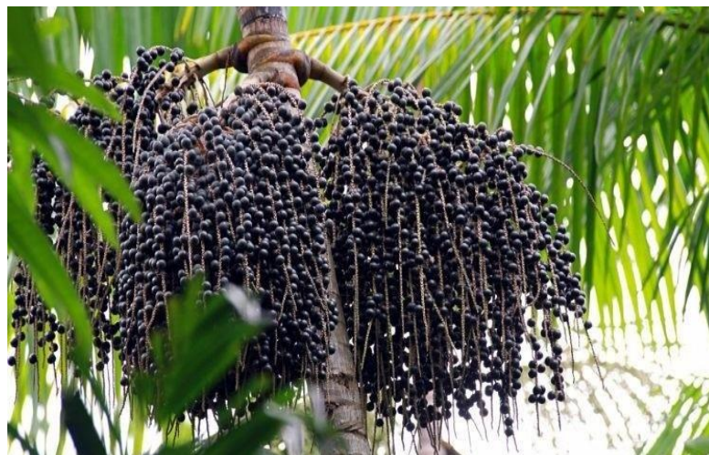
Figura 04: fruto do açaí manejado

Para preparar o vinho, coloca água em uma panela pra esquentar, em seguida coloca os frutos em uma bacia e mistura água fria com água quente e deixa de molho os frutos, espera entre 5 a 10 minutos pra amolecer, depois de molhe, derrama a água quente, e lava com água fria e leva pra máquina para bater ou amassa no alguidar de barro e coa com a peneira feita de arumã. Dele pode ser aproveitado tudo, desde a palmeira até o caroço.