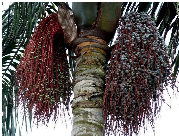
Figura 05: fruto da bacaba