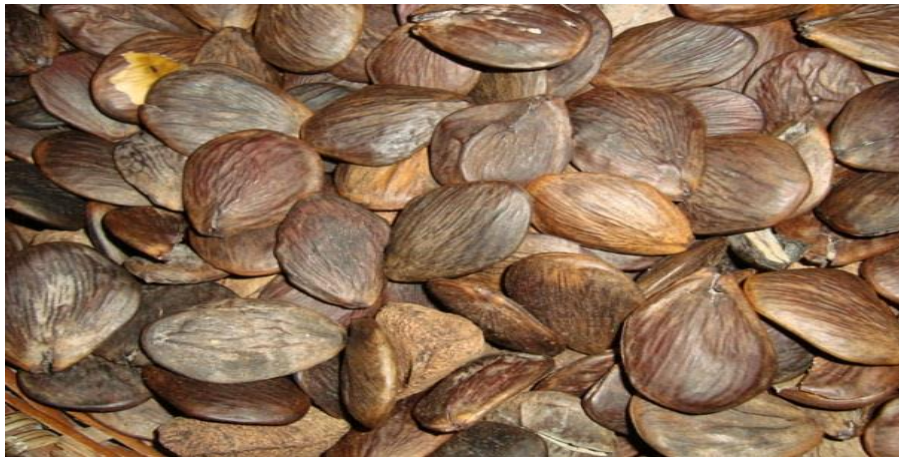
Figura 09: semente do Pracaxi