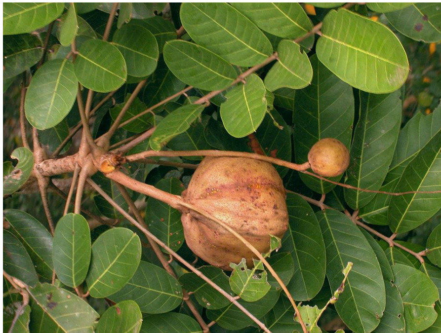
Figura 08: Arvore e semente da Andiroba

A andirobeira é uma espécie madeireira muito procurada no mercado de uso múltiplo, tanto comercial como medicinal podendo ser aproveitado para o óleo, casca, medicinal e madeira. A semente da andiroba fornece o óleo medicinal mais utilizado na Amazônia e principalmente no Pará.