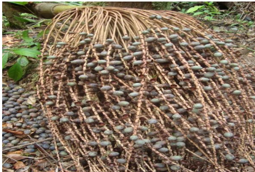
Figura 06: fruto do Patauá