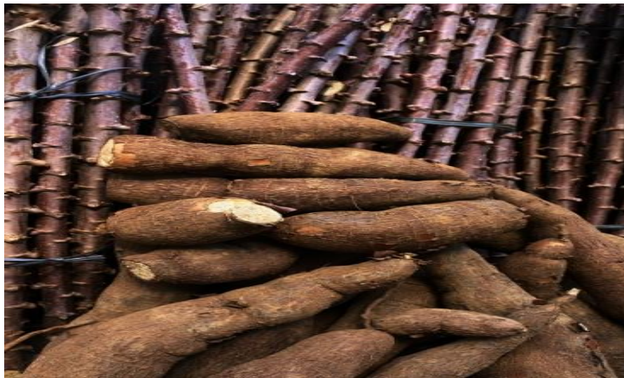
Figura 03: colheita de aipim (macaxeira)

Para preparar a farinha pega a mandioca na roça lava, raspa com a faca e coloca de molho em um balde com capacidade entre 100 e 500 litros, com água para amolecer e com dois dias tira do balde, mistura com a mandioca dura e seiva que é o processo de trituração da mandioca para se transformar em massa, coloca na prensa e deixa sair o tucupi, depois coa na peneira que é um artesanato feito de arumã ou jacitara, e em seguida coloca no forno para escaldar e torrar em fogo leve.