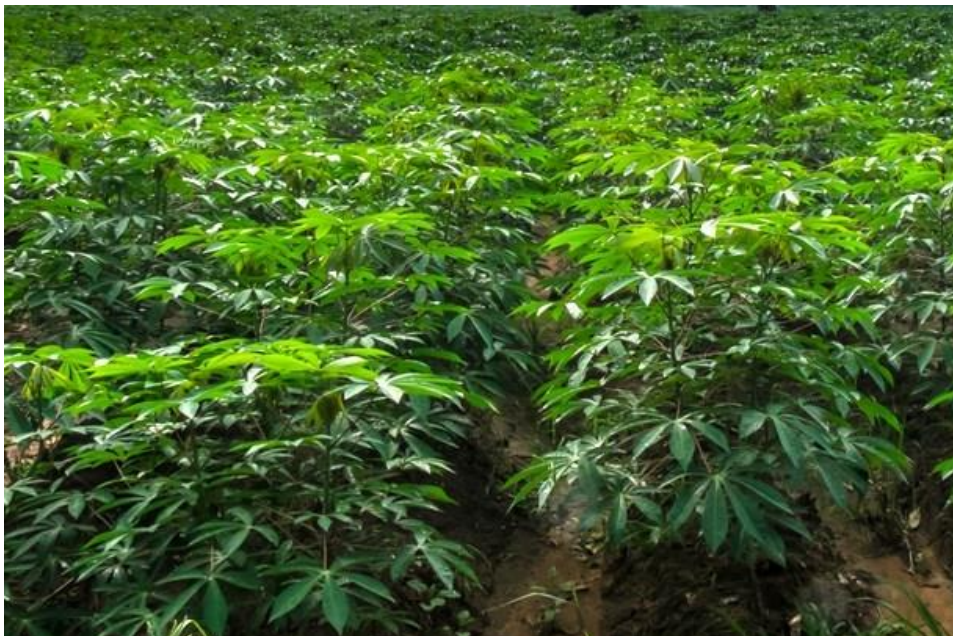
Figura 02 - cultivo de mandioca.

Nesse intervalo já tira a haste da maniva pra fazer a plantação, que é colocado outro convidado que conta com a participação das mulheres. Após esse processo entre 8 a 15 dias já começa a nascer. Depois de dois meses começa o processo chamado de capina que é a limpeza das ervas daninhas para não dificultar o desenvolvimento da planta. Feito esse processo, espera quatro meses para a colheita do milho, da melancia, do maxixe, uma vez que todos eles foram plantados juntos, já a maniva de mandioca dependendo da espécie varia de seis meses a um ano para começar a produzir farinha, a macaxeira a partir dos seis meses já está boa para comer cozida, assada, frita e o bolo.