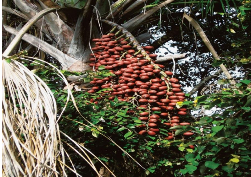
Figura 07: fruto do buriti

“Entre as variadas espécies de palmeira da Amazônia, o buriti é das que apresentam mais elegantes e belos espécimes. O buriti é de linhas tão nobres e tão poéticas no seu todo que entre elas se salienta”. A. Lustosa, arcebispo do Pará. Livro frutíferas e plantas uteis na vida amazônica. Pg187