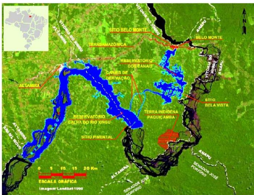
Figura 1 – Localização da hidrelétrica Belo Monte no médio rio Xingu - PA

A construção da UHE Belo Monte na Volta Grande do rio Xingu (Figura 1), produziu impacto significativo nas comunidades ribeirinhas de Vitória do Xingu, Altamira e áreas adjacentes, incluindo nove (9) municípios que foram atingidos de diferentes maneiras pelo grande empreendimento. Um dos principais impactos foi o deslocamento forçado de grupos sociais que tiveram de deixar suas terras e casas, resultando em perdas de saberes, desestruturação social e afastamento dos recursos naturais necessários à reprodução material.