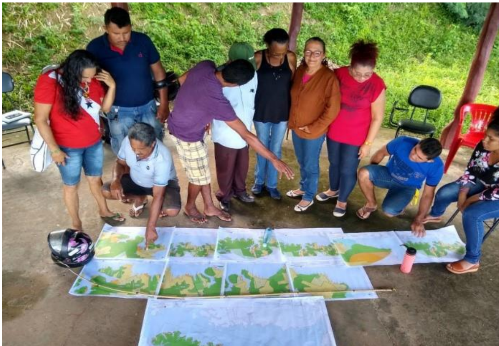
Figura 4: Reunião do Conselho discutindo os mapas do Território Ribeirinho