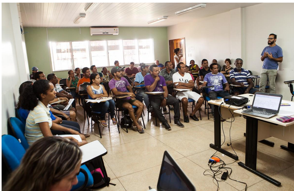
Figura 2: Reunião do Conselho Ribeirinho para reconhecimento dos ribeirinhos