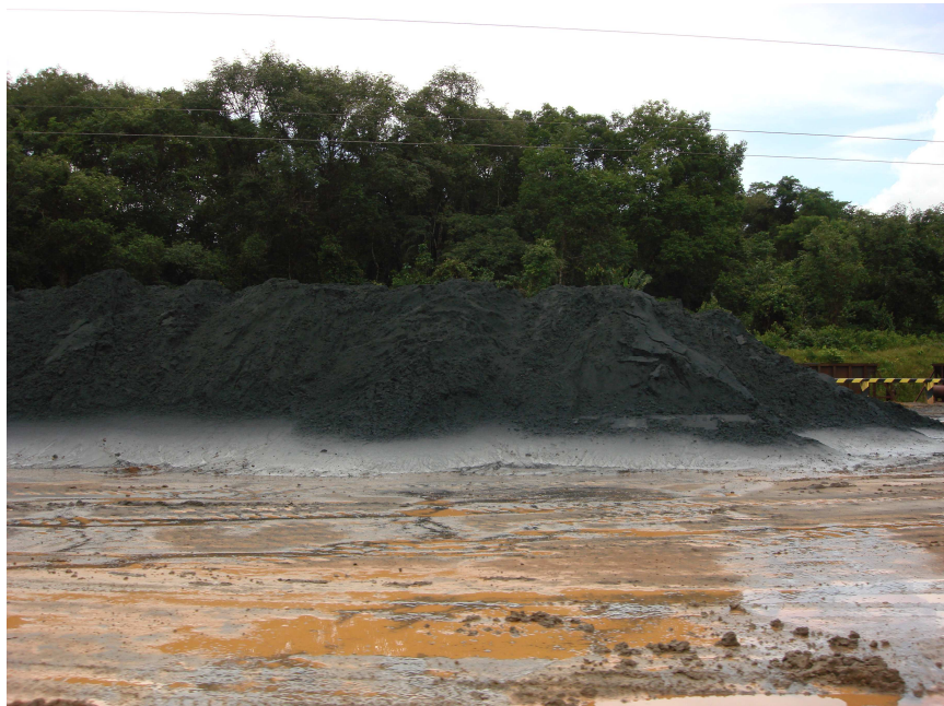
Figura 5 – Acumulação de minério de ferro (MMX) sobre o solo, como exemplo de impacto na paisagem.