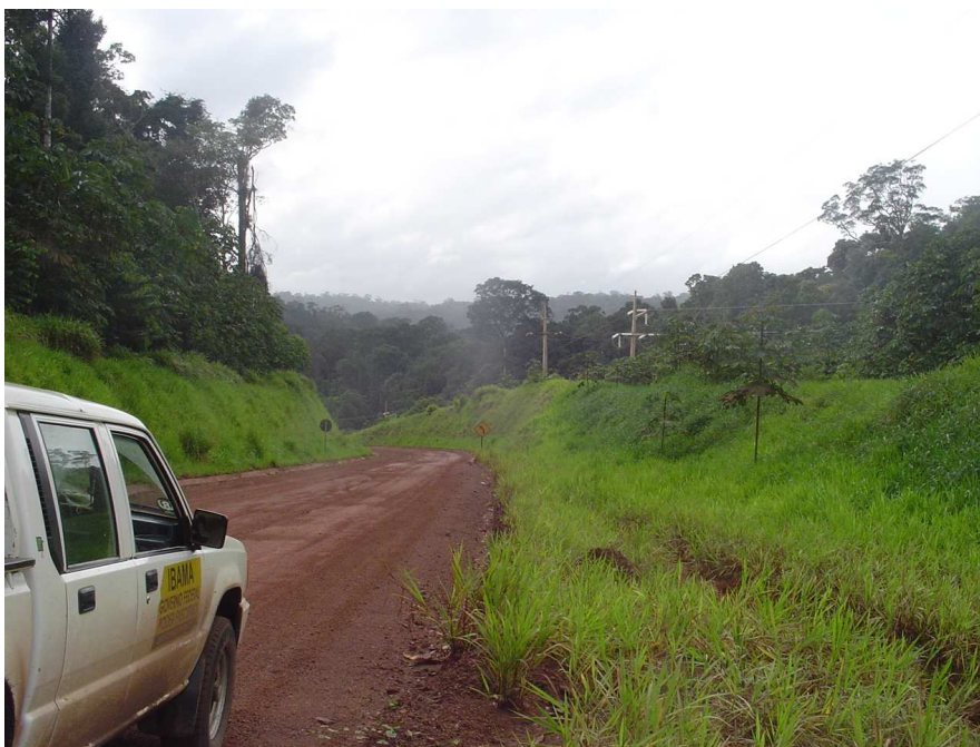
Figura 8 - Recomposição da vegetação (Gramíneas) produzida pela empresa MPBA na estrada de acesso à mina de ouro da empresa.

reflorestamento, através do processo de hidrossemeadura, com mudas reproduzidas no próprio site da empresa. A preocupação com a recomposição florestal pode ser percebida também nas estradas de acesso a mina de ouro desta empresa (Figura 8)