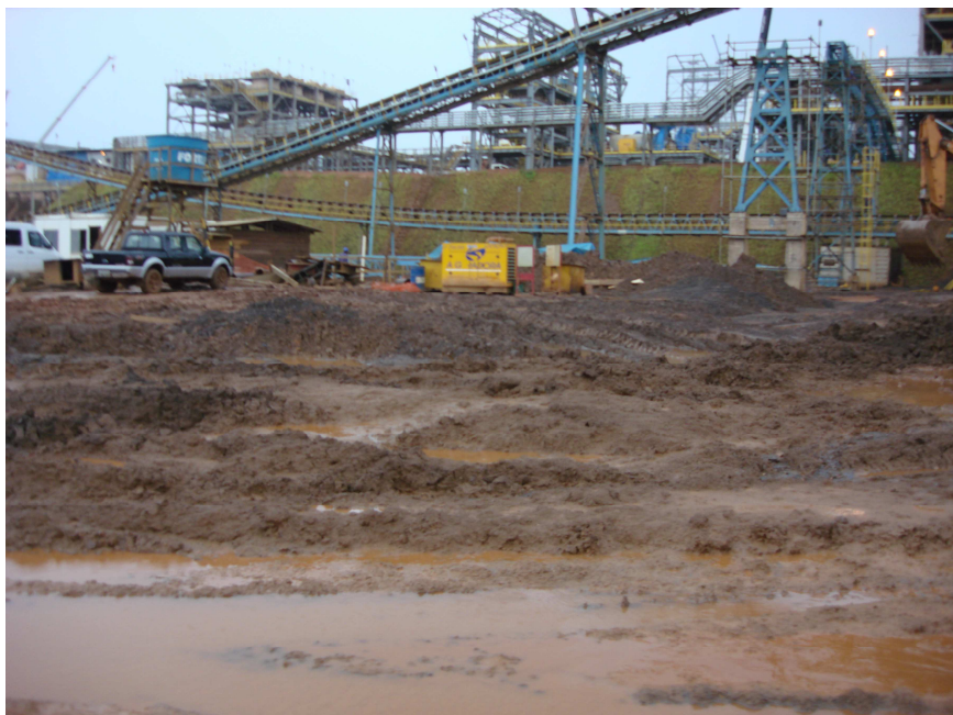
Figura 6 – Área de mineração da empresa MMX, percebendo-se o aporte de sedimentos e o transtorno causado na área de mineração, na região do Amapá.