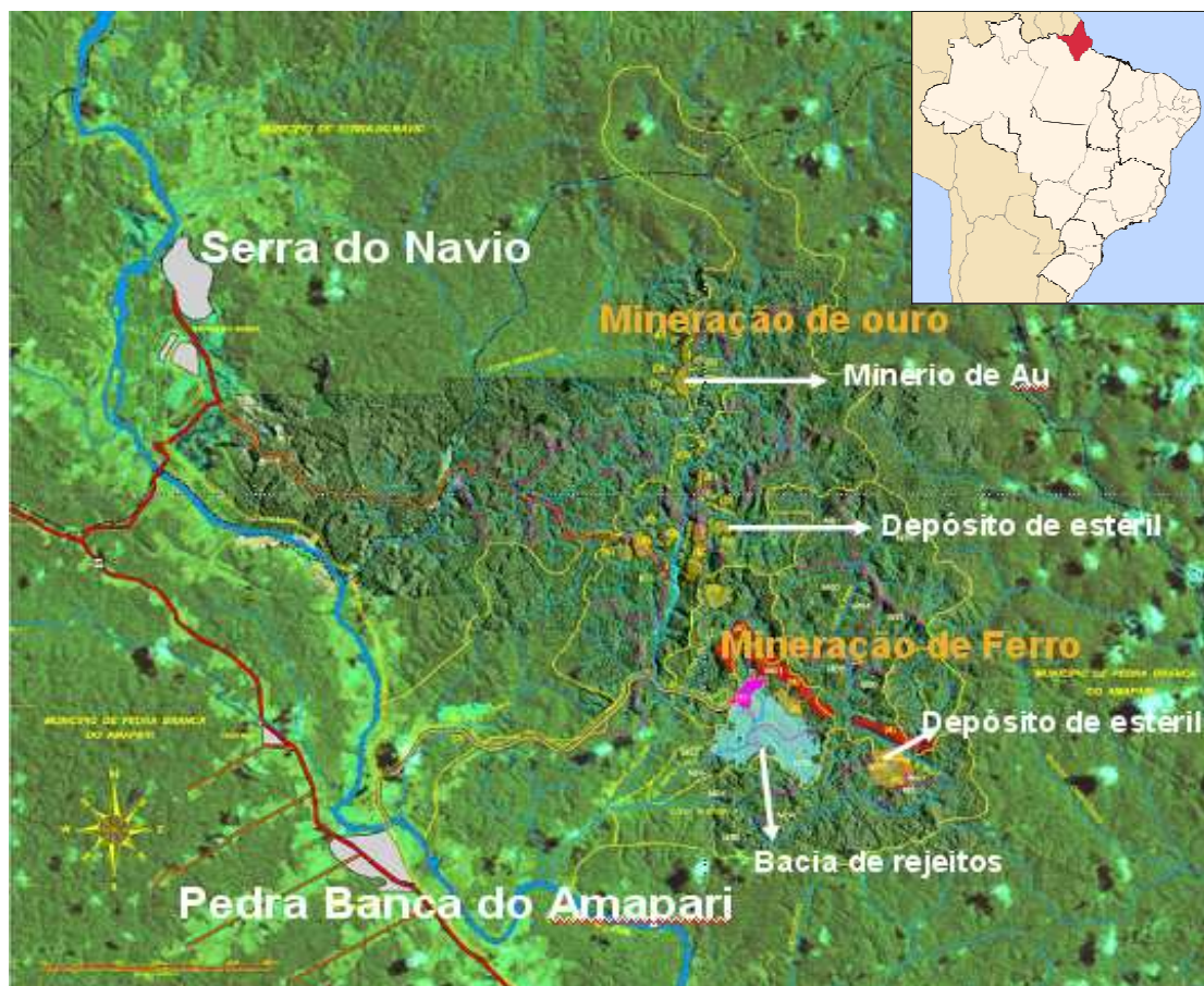
Figura 1 - Localização da área de estudo, incluindo a área de mineração de ferro, a mineração de ouro, o rio Amaparí e as cidades de Serra do Navio e Pedra Branca do Amaparí

Portanto, a área estudada é a sub-bacia do rio Amaparí, destacando os igarapés William, Jornal, Taboca, Mario Cruz, Sentinela e Silvestre. Esta área engloba ainda os municípios de Serra do Navio e Pedra Branca do Amaparí no Estado do Amapá, região Norte do Brasil (Figura 1).