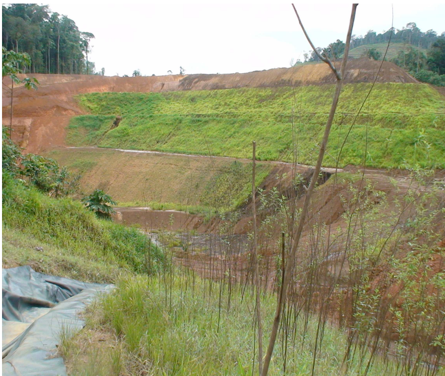
Figura 9 – Detalhe das áreas de recuperação da vegetação, com sítios de erosão, dentro da mineração de ouro da empresa MPBA.