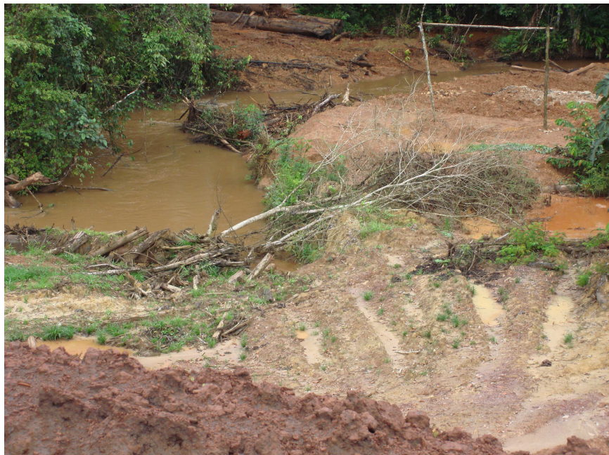
Figura 7 - Efeitos da mineração nos recursos hídricos na região do Amapá, percebendo-se a quase completa destruição do igarapé pela construção da estrada, percebida na porção esquerda inferior da figura.

Pode-se dizer que o problema ambiental mais sério provocado pela mineração no Brasil, é a contaminação por aporte de sedimentos e por mercúrio, principalmente de rios da Amazônia, causada pelos garimpos de ouro. Como os "garimpeiros" usam uma tecnologia rudimentar, o controle ambiental é difícil e a contaminação só não é muito mais grave porque os rios da Amazônia são muito volumosos e a área é ainda pouco povoada nesta região.