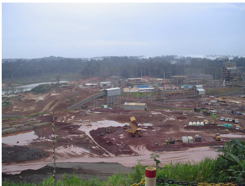
Figura 10 - Vista da mineração de ferro da MMX onde se percebe a falta de zelo com a problemática do meio ambiente e a falta de segurança. Ao fundo percebe-se o rio Mario Cruz represado para as atividades de mineração.

Além disso, durante os trabalhos de campo realizados na área da empresa MMX, percebeu-se uma total falta de cuidado com os problemas ambientais e com a segurança nesta mineradora (Figura 10), o que contrastou bastante com a empresa MPBA.