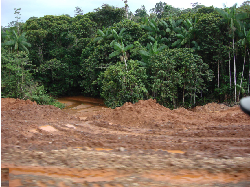
Figura 4 – Curso de água (igarapé) assoreado pelos sedimentos provenientes da abertura da estrada de acesso à mineração de ferro da empresa MMX.

não é das tarefas mais fáceis, pois assim como não se pode aceitar mudanças no ambiente e os prejuízos impostos à sociedade, da mesma forma fica difícil impedir a atuação das mineradoras, pois elas também trazem benefícios para a sociedade. As figuras 4 e 5 mostram situações de impactos causados por atividades de mineração na paisagem.