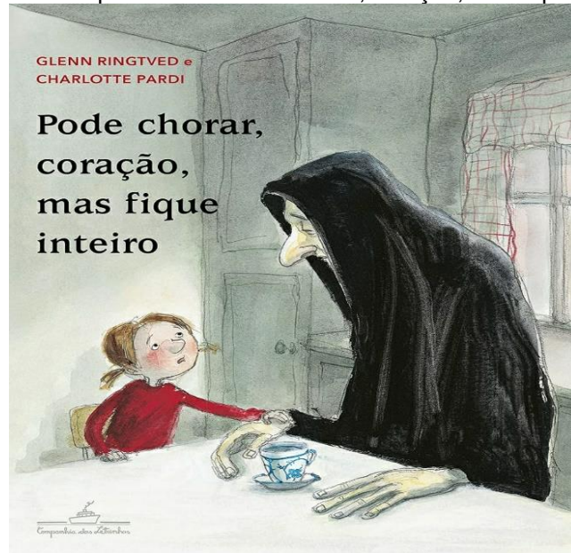
Figura 01 – Capa do Livro “Pode chorar, coração, mas fique inteiro”