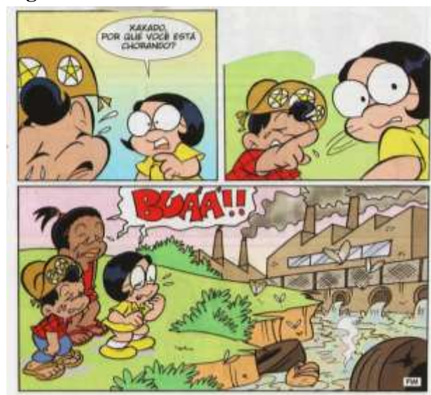
Figura 05: Tirinha da Turma do Xaxado