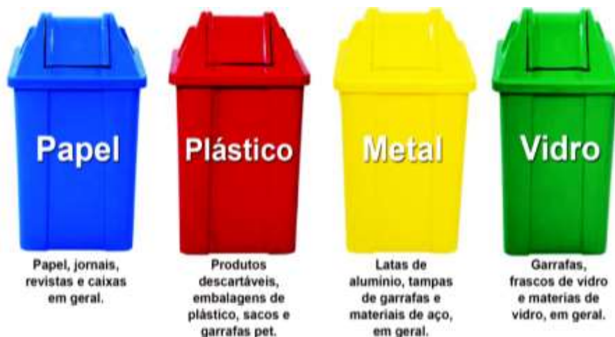
Figura 03: Coleta seletiva do lixo.

https://www.ecodebate.com.br/2020/10/30/reciclagem-e-um-tema-importante-na-escola/ Acessado em 01 de nov. 2022.