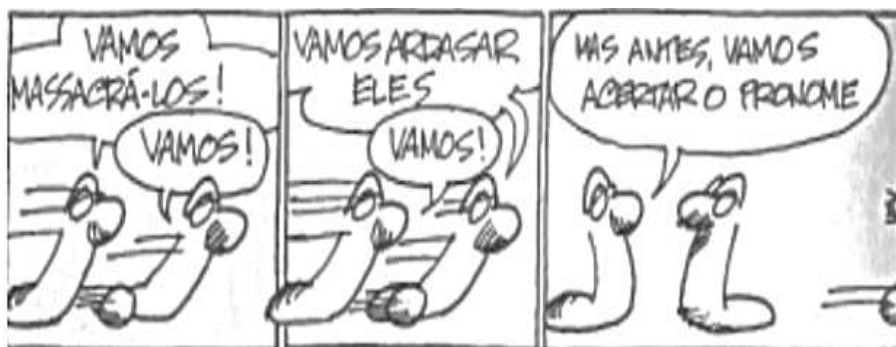
Figura 04: Tirinha As Cobras De Veríssimo L.F