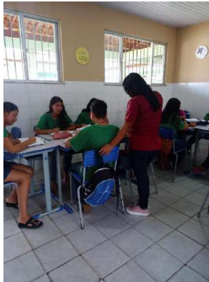
Figura 1 - Aplicação de atividade avaliativa