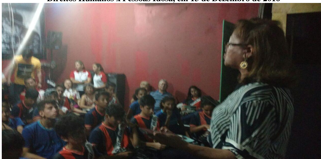
Foto: Régia D'Arc Ribeiro Conselho Estadual dos Direitos da Pessoa Idosa,