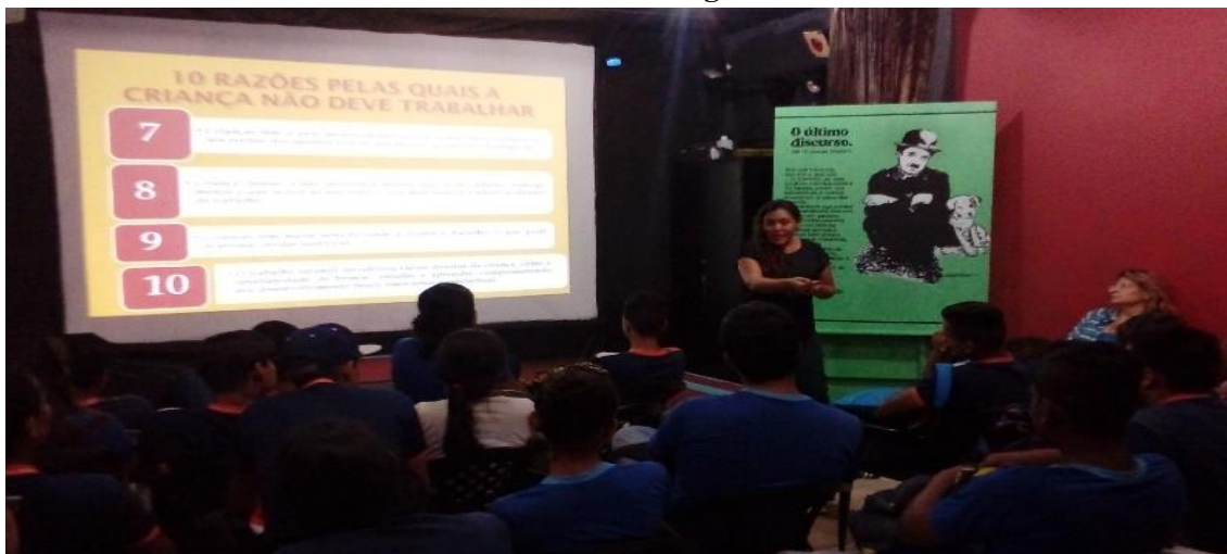
Foto: Aline Costa, auditora fiscal da Superintendência Regional do Trabalho.