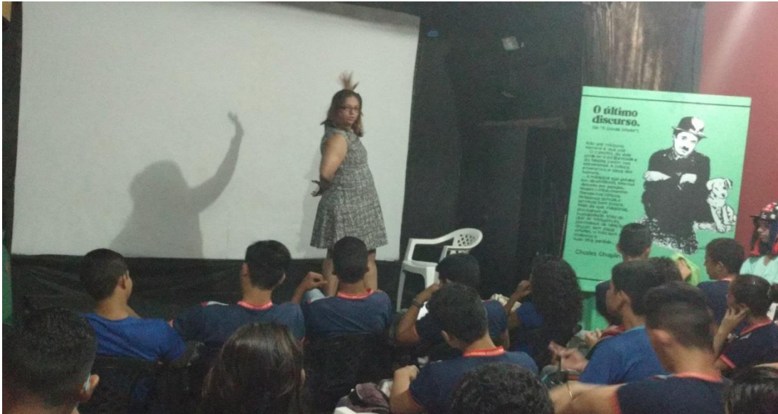
Foto: Palestrante Elinay Ferreira, juíza do Tribunal Regional do Trabalho – 8ª Região.