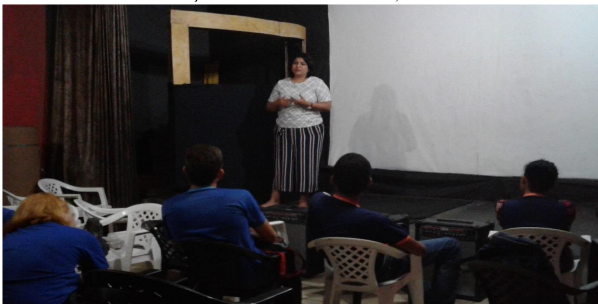
Foto: Gisele Souza - Comissão de Proteção aos Direitos das Pessoa com Deficiência Ordem de Advogados do Brasil (OAB).