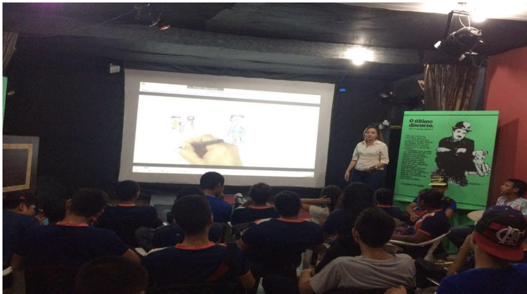
Foto: Angélica Gonçalves, assistente social da ONG “Só Direitos”.