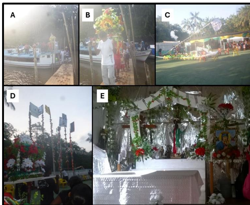
Figura 2 – Fotografias da festividade de São Benedito da Comunidade Igarapé Genipaúba, ocorrida no ano de 2017. A) Chegada do Santo à Capela B) Pessoas carregando o santo em procissão. C) Levantamento dos mastros. D) Diversos mastros erguidos para a festividade. E) Capela de São Benedito ornamentada para a festividade.