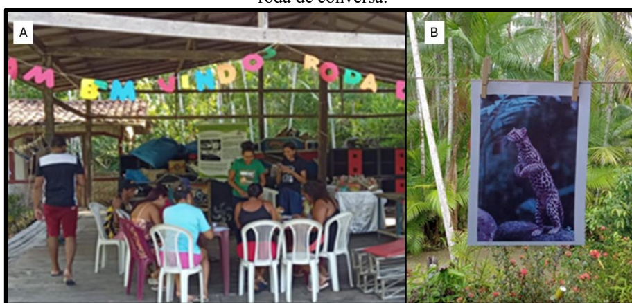
Figura 6 – A) Local de realização da roda de conversa. B) Foto em exposição feita em um varal durante a roda de conversa.