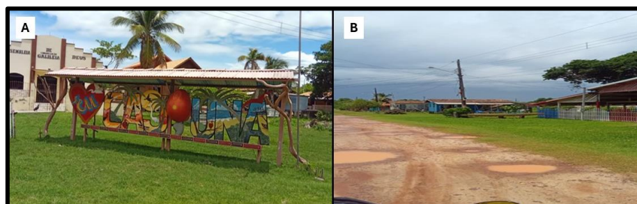
Figuras 4 – Fotografias da Comunidade de Cajú-Úna. A) Parte central da comunidade, nota-se ao fundo uma Assembleia de Deus e diversas moradias. B) Vista geral das moradias.