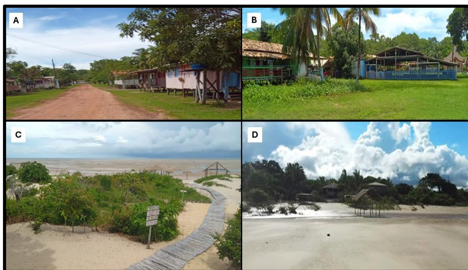
Figura 3 – Fotos da Comunidade do Céu em Soure, Marajó (PA). A e B) Habitações da Comunidade do Céu. C e D) Imagem da Praia do Céu, onde se localiza a comunidade.