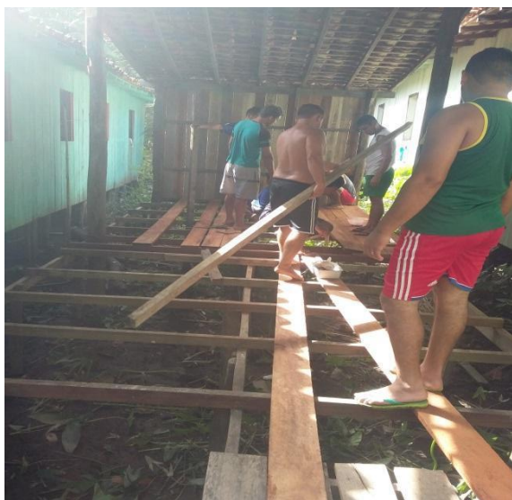
Figura 6: coletivo construindo a mercearia