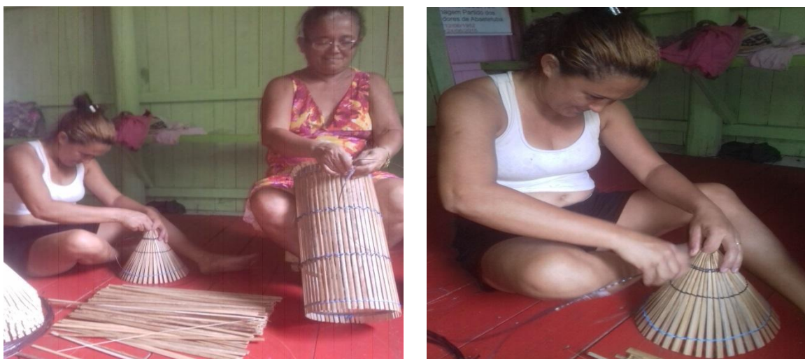
Figura 8: Confeccção do matapi.

O grupo iniciou com uma coleta de R$ 20,00 (vinte reais) de cada integrante, com o intuito de arrecadar fundos para a compra dos materiais necessários para a construção do matapi, como: tala, cipó, cordinha, fibra e arco (Figura 8). Cada um dia de trabalho é realizado na casa de uma das integrantes, fazendo um rodízio, sendo de sua responsabilidade um pequeno lanche para as trabalhadoras. Ao final da fabricação do matapi, o mesmo é vendido em conjunto na cidade, na casa de marreteiro da própria comunidade ou para pessoas que compram direto nas casas. Abaixo mulheres trabalhando no artesanato de matapi (Figura 8).