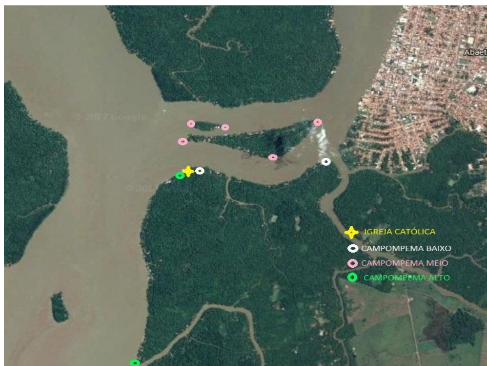
Figura 2- Comunidade de São João Batista, Rio Campompema.

A comunidade do Rio Campompema está localizada no município de Abaetetuba, a cerca de cinco minutos do porto da cidade. O principal meio de locomoção são as embarcações de pequeno e médio porte.