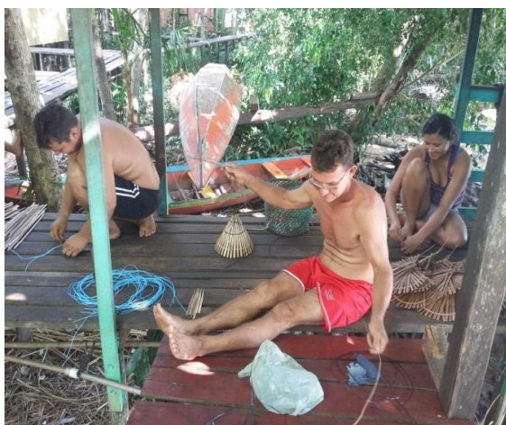
Figura 4: a) Grupo trabalhando com matapi e b) manejo de açazal.

Este grupo trabalha uma vez por semana (às sextas-feiras), e a cada sexta-feira é para um integrante, sendo que nesse dia a responsabilidade pelos materiais para o trabalho é do anfitrião. Ninguém pode faltar e, se faltar, conseqüentemente o dono do trabalho não tem a obrigação de ir ao trabalho do sócio que faltou. Porém, conforme informado, ninguém costuma faltar, mantendo a honra dos compromissos. Em relação à alimentação, somente o café da manhã e o lanche é responsabilidade do dono do serviço. Abaixo (Figuras 4) imagens dos integrantes do mutirão trabalhando no artesanato de matapi e na limpeza do açazal.