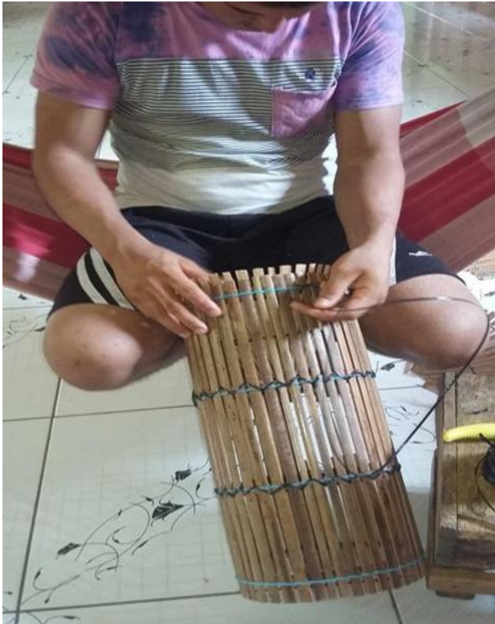
2 - Caseando o meio