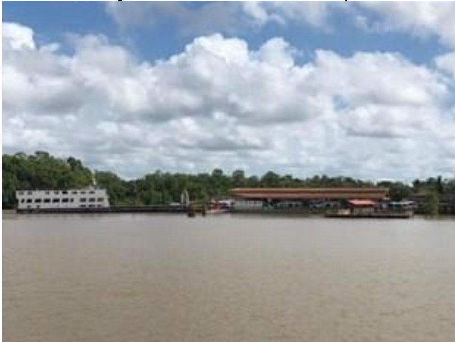
Figura 4: Porto do Camará – Ilha do Marajó