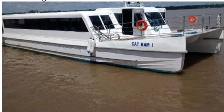
Figura 2: Lancha CAT BAM I em seu interior

Assim, foram realizadas em média 50 entrevistas por viagem, duas vezes por semana (dia útil e final de semana), com seleção aleatória dos passageiros. A Figura 2 mostra a lancha CAT BAM I, com serviço executivo, sem gratuidade e preço mais elevado. A Figura 3 apresenta imagem do navio, com preço popular e aceitação de gratuidades. Na Figura 4 tem-se o Porto do Camará.