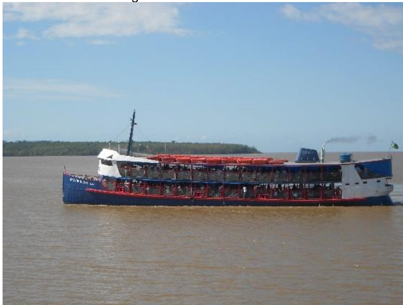
Figura 3: Navio Otavio Oliva

O estudo, de caráter empírico, partiu para a pesquisa de campo, cujos dados coletados se constituíram em: