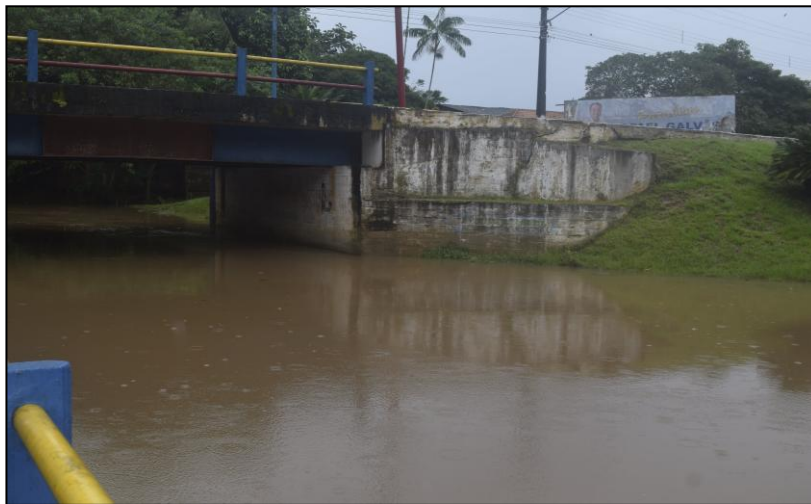
Imagem 13 - Ponte sobre o rio Apeú

A imagem 12 evidência o processo de urbanização por meios de edificações que se aproximam cada vez mais das margens do igarapé, fazendo com que este dispute espaço com essas formas de “organização” da sociedade atual.