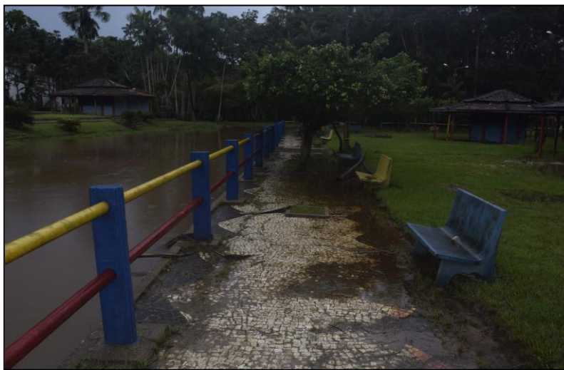
Imagem 11- calçada da Orla

Além dos quiosques e a parte do igarapé, não conseguimos identificar mais nenhum equipamento de lazer na área, apenas espaços que podem ser utilizados para a prática de algumas atividades ao ar livre. Atividades estas que parecem estar limitadas devido a configuração do local, não permitir o usufruto do espaço de modo adequado fazendo com que as possibilidades das práticas referentes ao lazer da população não ocorram de modo satisfatório.