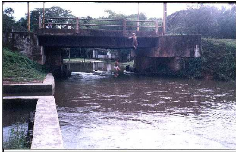
Imagem 02- Lazer no Apeú/Castanhal

lavadeiras que outrora utilizaram o leito do rio como forma de trabalho, discutem sobre a forma prazerosa que era lavar suas roupas nesse ambiente. Alguns moradores que possuíam suas residências mais próximas a parte hídrica da vila, discutem a diminuição do leito do rio, a diminuição das espécies de peixes na localidade que outrora eram abundantes e que proporcionavam uma melhor qualidade de vida para a comunidade.