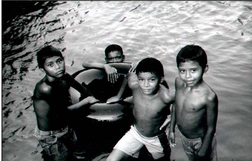
Imagem 03 – Crianças em momento de lazer no Apeú

fomentar e possibilitar construções concretas acerca do espaço investigado, sendo as histórias orais as mais utilizadas para contar sobre as características da Vila do Apeú antigamente, realizando assim comparações com os tempos atuais.