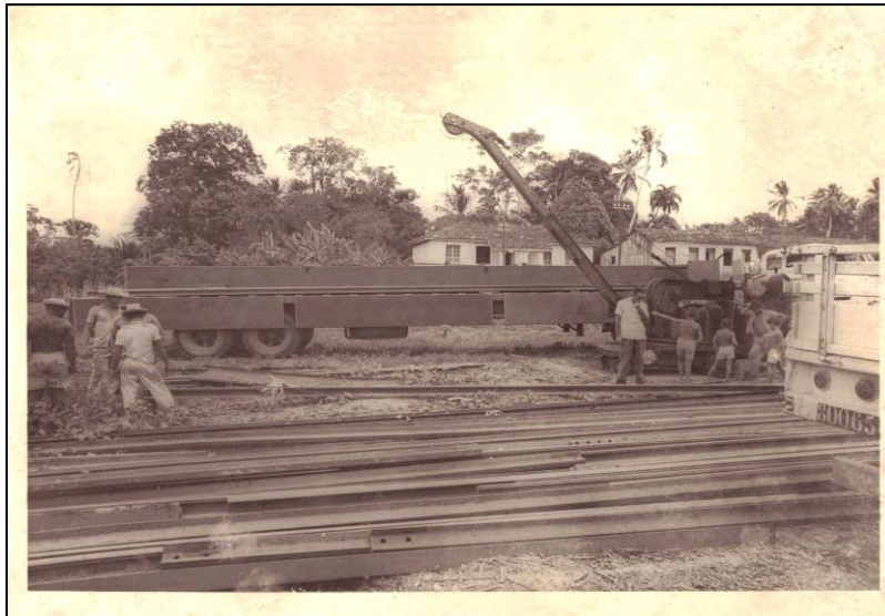
Imagem 01- Construção da estrada de ferro Belém/Bragança