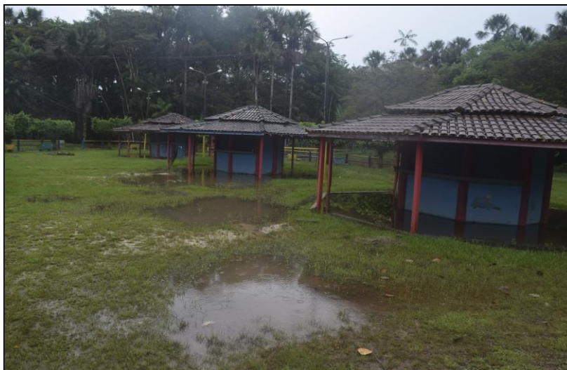
Imagem 10- Quiosques

Alertamos aqui para a importância de se ter no espaço ações que possibilitem o usufruto seguro das vivências do lazer de modo a garantir uma melhor conscientização em relação ao local exprimindo assim a sua importância do espaço como forma de contar um pouco da história da região.