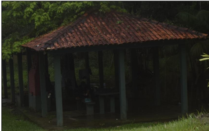
Imagem 09- Ocupação do espaço

Embora o período de visita tenha coincidido no período chuvoso, vale destacar a grandeza do local, pois em meio a aglutinação dos espaços urbanos, a natureza ainda se mostra presente e importante para que de fato possamos ter a consciência de que ela também faz parte dos processos e aspectos culturais de uma sociedade, constituindo-se assim como um espaço cheio de memórias que podem expressar a identidade de uma comunidade e até mesmo resgatar costumes e tradições que outrora vem sendo esquecidos pelo modo de vida e velocidade que as coisas acontecem no modelo de sociedade atual. Destacamos ainda que um ambiente de contemplação também faz parte do usufruto do lazer, sendo os ambientes naturais propícios a essa prática.