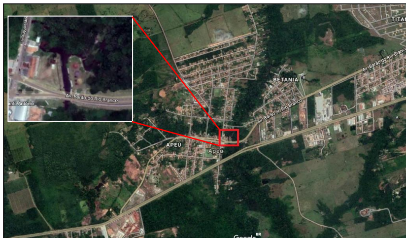
Imagem 05- Localização da Orla do Apeú

A Vila do Apeú localiza-se em uma área um pouco afastada do centro de Castanhal, tendo como vizinho o bairro Betânia e algumas agrovilas em suas proximidades. Trata-se de uma localidade onde ainda podemos encontrar várias áreas verdes em comparação com centro fortemente urbanizado da cidade de Castanhal. O mesmo encontra-se na saída da cidade de Castanhal em direção a Belém do Pará, possuindo também várias vias que dão acesso a agrovilas e que mantêm um vínculo tanto com a parte da Vila do Apeú quanto às áreas mais centrais da cidade de Castanhal.