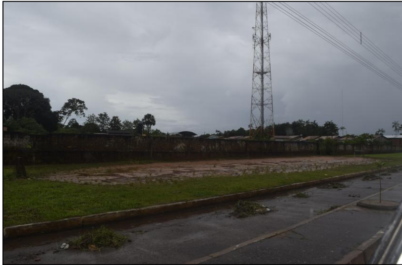
Imagem 06 - Espaço de lazer.

A Orla do rio Apeú, conhecida também pelos moradores como “beira rio” e/ou “prainha”, nosso local de pesquisa, está localizada as margens da Avenida Barão do Rio Branco, sendo esta uma das principais vias de ligação entre o Distrito do Apeú ao centro de Castanhal.