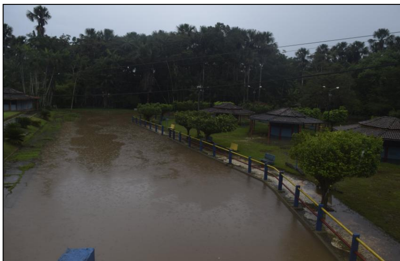
Imagem 07 - Visão panorâmica da Orla do rio Apeú

Ao longo da Avenida Barão do Rio Branco podemos encontrar alguns espaços que de certa forma parecem servir para a prática do lazer relacionados a vivência esportivas (ao menos em caráter informal). Dividida por um canteiro central, a avenida possui pavimentação em praticamente toda sua extensão e encontra-se em bom estado de trafegabilidade.