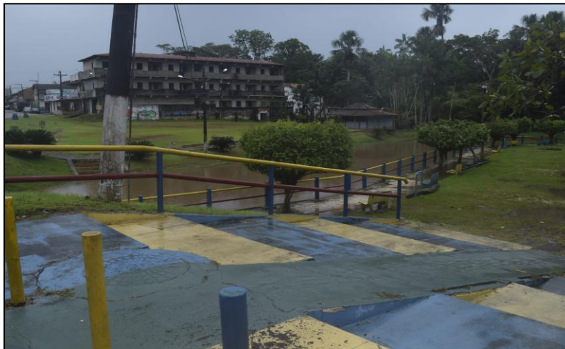
Imagem 08 - Rampa e escadaria de acesso

Carvalho (2014) aponta a orla do rio Apeú como uma das maiores atrações de lazer na cidade de Castanhal no passado, tornando-se este ambiente mais frequentado por ocasião da construção e revitalização do espaço pela Secretaria Municipal de Obras (SEMOB) do município. Atualmente é pouco frequentado tanto por moradores quanto por visitantes de outros bairros e cidades próximas por questões que podem estar relacionadas a poluição dos igarapés que como consequência acabam proporcionando o assoreamento do mesmo, a falta de segurança no local, entre outros. Essas e outras questões fazem com que os frequentadores busquem áreas mais propícias para que vivam suas práticas de lazer. Geralmente esses ambientes dispõem de recursos hídricos localizados na Vila do Apeú, possuindo uma melhor conservação permitindo com que seus frequentadores usufruam da natureza para realização de suas atividades, estas relacionadas ao lazer ou não.