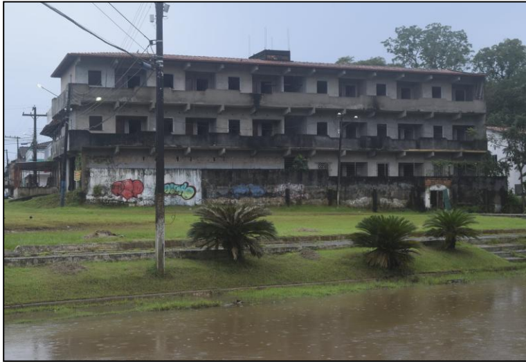
Imagem 12 - Construções ao entorno da orla