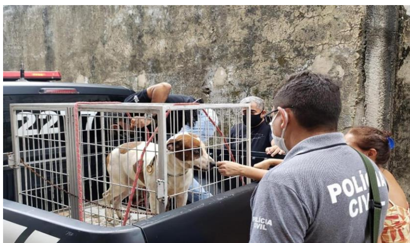
Figura 3 – Cão que sofria maus tratos, resgatado por meio do Disque Denúncia

No âmbito estadual, a própria Secretaria de Segurança Pública exerce a função de promover a conscientização da população, ao veicular em sites oficiais e mídias sociais os casos que resultaram na identificação do crime de maus tratos, resultantes de diligências realizadas por membros policiais, suscitadas a partir de denúncias oriundas do Disque-Denúncia. De forma ilustrativa (Figura 3), apresenta-se um caso concreto de Belém do Pará. Os policiais civis da Divisão Especializada em Meio Ambiente e Proteção Animal (DEMAPA), resgataram um cão com sinais de maus tratos, na Alameda Luz do Caminho, no bairro do Telégrafo, região metropolitana, a partir de uma denúncia anônima.