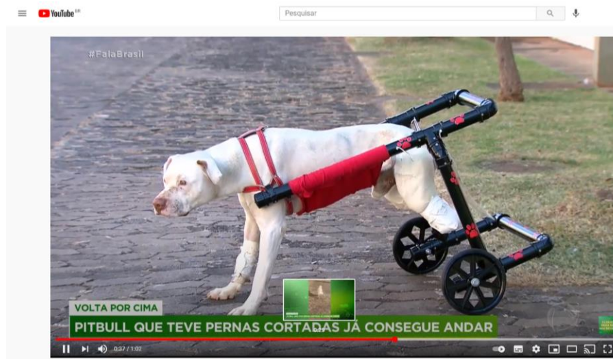
Figura 1 – Repercussão no YouTube do caso de maus tratos praticados ao pitbull Sansão

Nesse sentido, em tempos de internet e redes sociais, tornou-se mais evidente a discussão de questões relacionadas às diversas práticas abusivas e aos maus tratos contra animais. A própria Lei Federal nº 14.064/2020, denominada de “Lei Sansão”, surgiu em virtude da repercussão de um caso de maus tratos praticados a um cão pitbull, o qual teve as patas traseiras decepadas, no município de Confins-MG, fato que causou comoção nas redes sociais, em todo o Brasil, como no Youtube (Figura 1) e no Facebook (Figura 2).