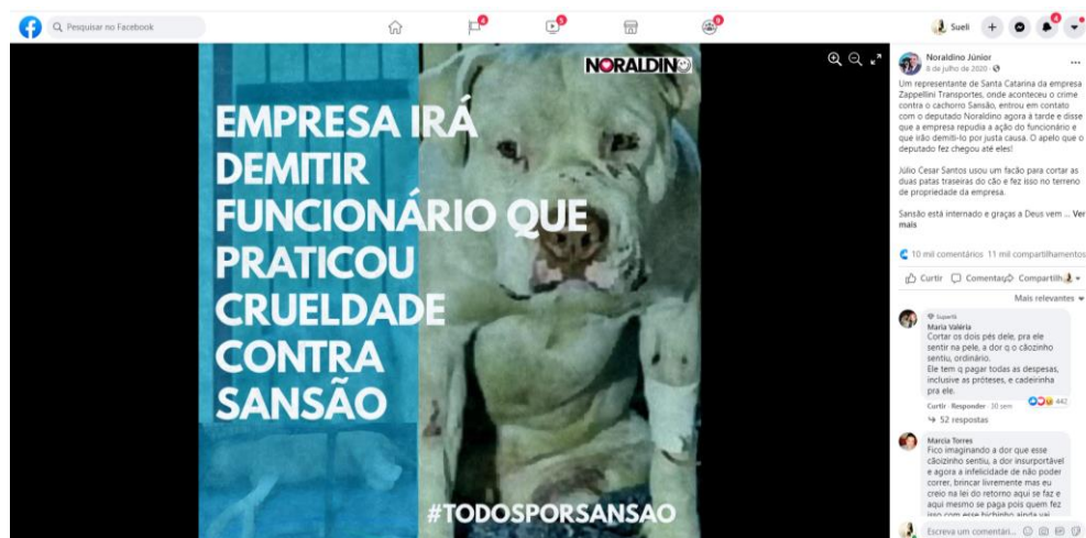
Figura 2 –Repercussão no Facebook do caso de maus tratos praticados ao pitbull Sansão