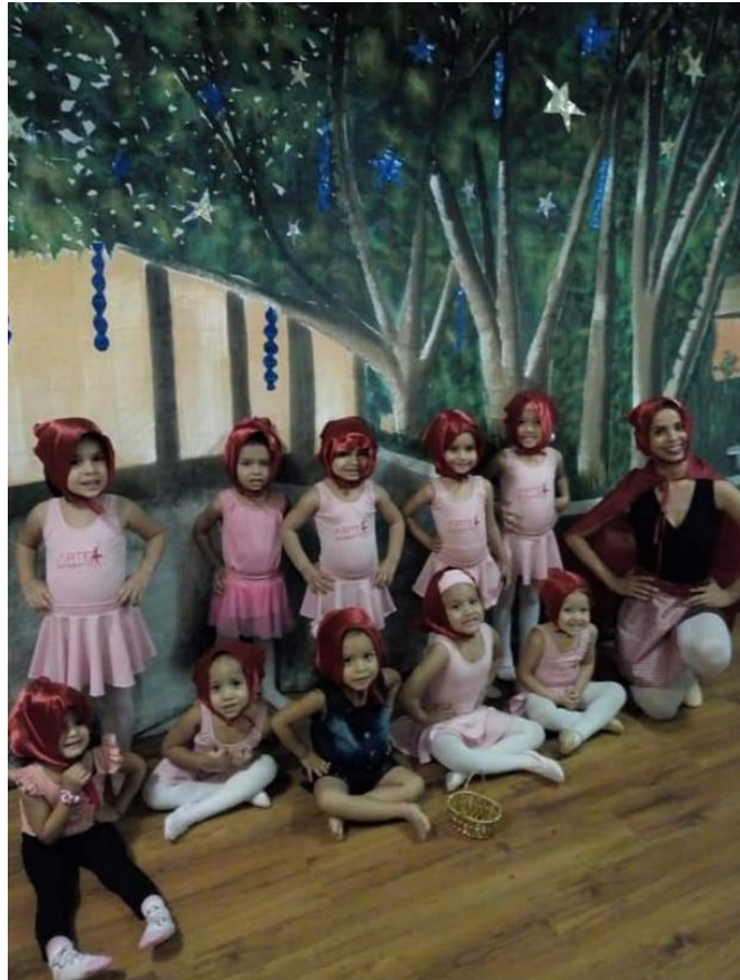
Imagem 3 - Brincando na floresta