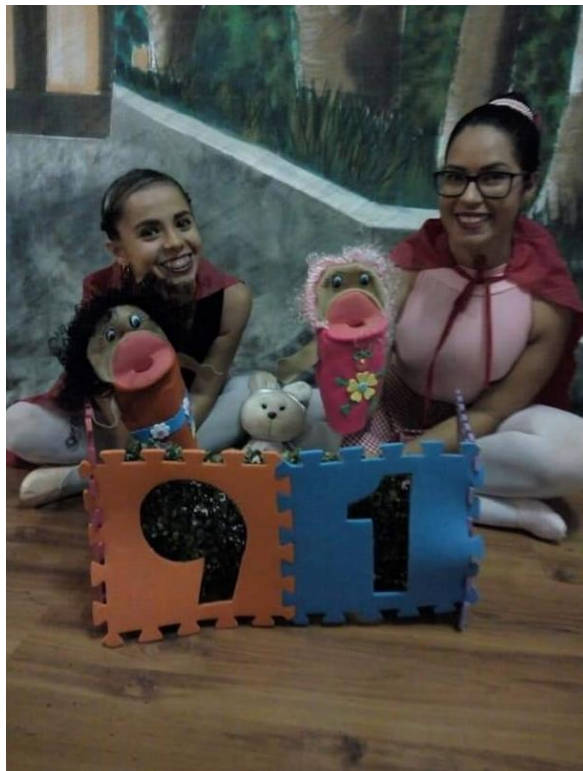
Imagem 2 – Contação de histórias

Devido à euforia das crianças, as cantigas de roda foi o indutor das atividades dançantes. Fux (1983 p.76) salienta que “a utilização das canções de infância é parte medular no trabalho de conduzir a criança à criação e dá origem ao reconhecimento de si mesma”. Na conclusão da atividade utilizei os fantoches para a contação de história e assim terminamos o dia com a flexibilização da aula, porém os objetivos foram alcançados.