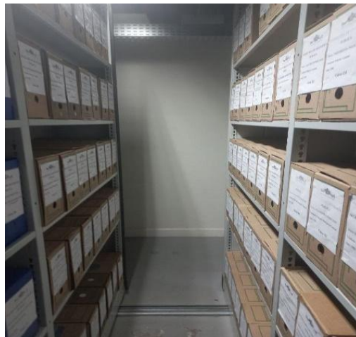
Figura 2 - Acervo de Inquéritos Policiais