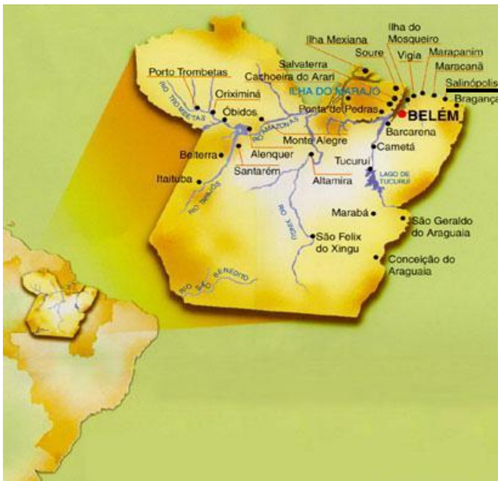
Figura 1 – Localização de Salinópolis, Pará.

Fundada em 1656, só foi considerada estação hidromineral em 1966, e, com seu clima tropical com chuvas de verão, é atualmente considerado o principal balneário do interior do Estado. As suas principais praias são a do Maçarico e Corvinas, nos limites urbanos da cidade, e a do Atalaia, na ilha de mesmo nome, ligada ao continente por meio de uma ponte (SEPOF – PA, 2007; TADAIESKY; REBELO; VITOR, 2008).