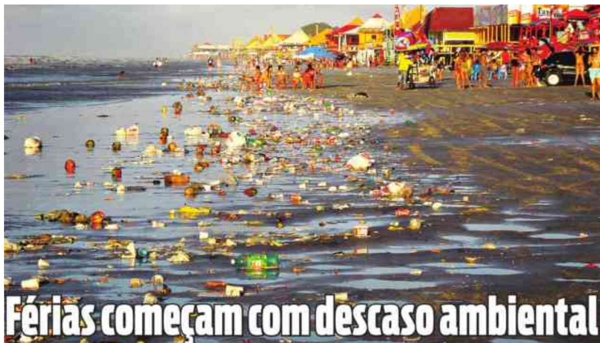
Figura 5 - Final da tarde do 1º Sábado de Julho/09 - Praia do Atalaia - Salinas/PA.

no solo e na água é mais pronunciada (Figura 5). Cocentino (2008) em estudo em Porto de Galinhas também revelou a ocorrência de enorme quantidade de material sendo descartada aleatoriamente na praia.