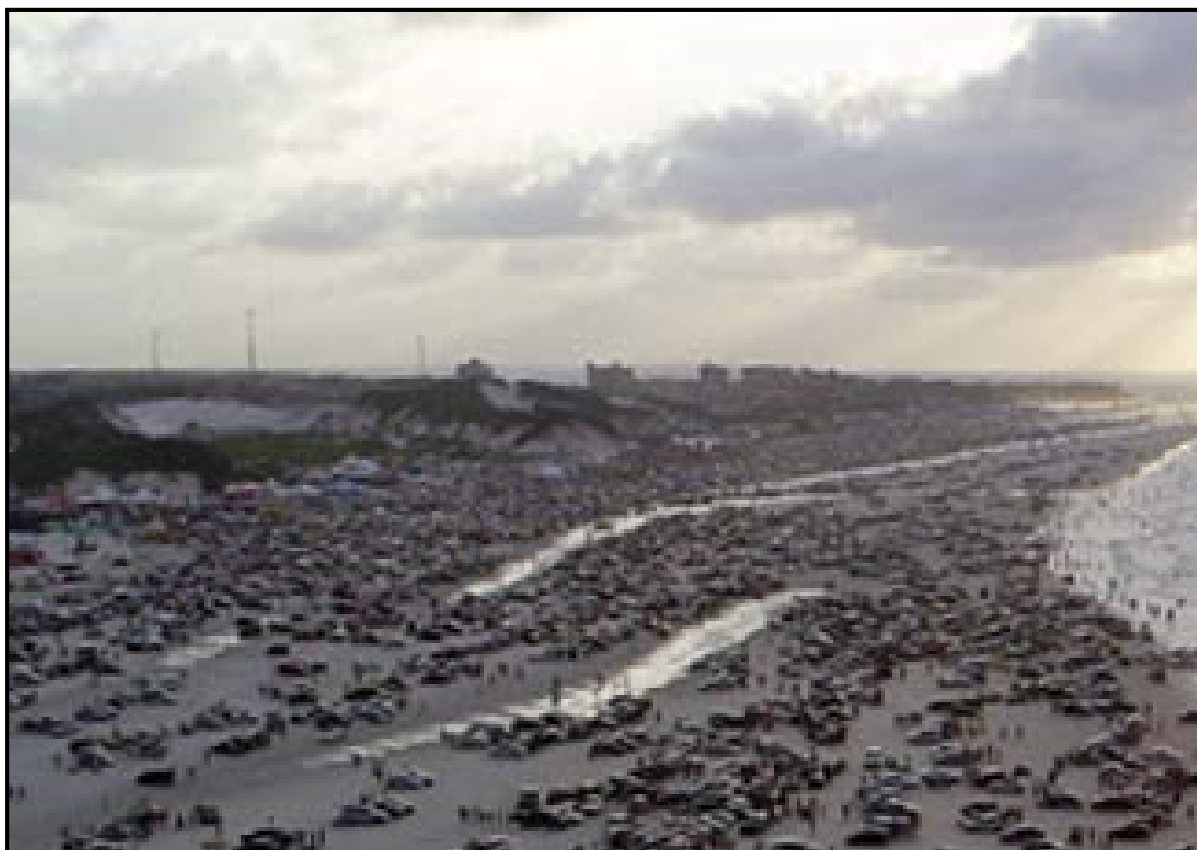
Figura 2 – Carros na Praia do Atalaia, Salinópolis, Pará.