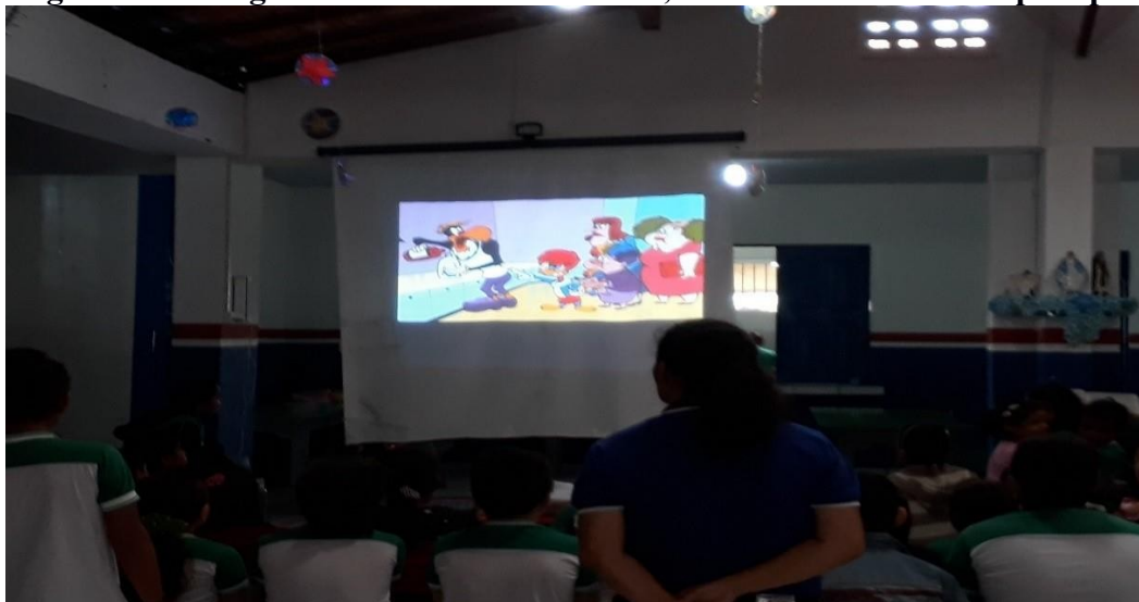
Figura 14 - Imagem dos alunos no intervalo, assistido o desenho do pica-pau

Portanto, o intervalo do recreio é um momento muito especial e na escola Mariuadir Santos não é diferente; ele inicia ao toque da “campa” por volta de 09hs:15min, onde todas as crianças, obedecendo ordem da educador, saem um por um para o pátio e todos os dias há um vídeo informativo e didático, dos personagens: Pica-pau ou turma da Mônica. Como foi registrado neste dia (Figura 14).