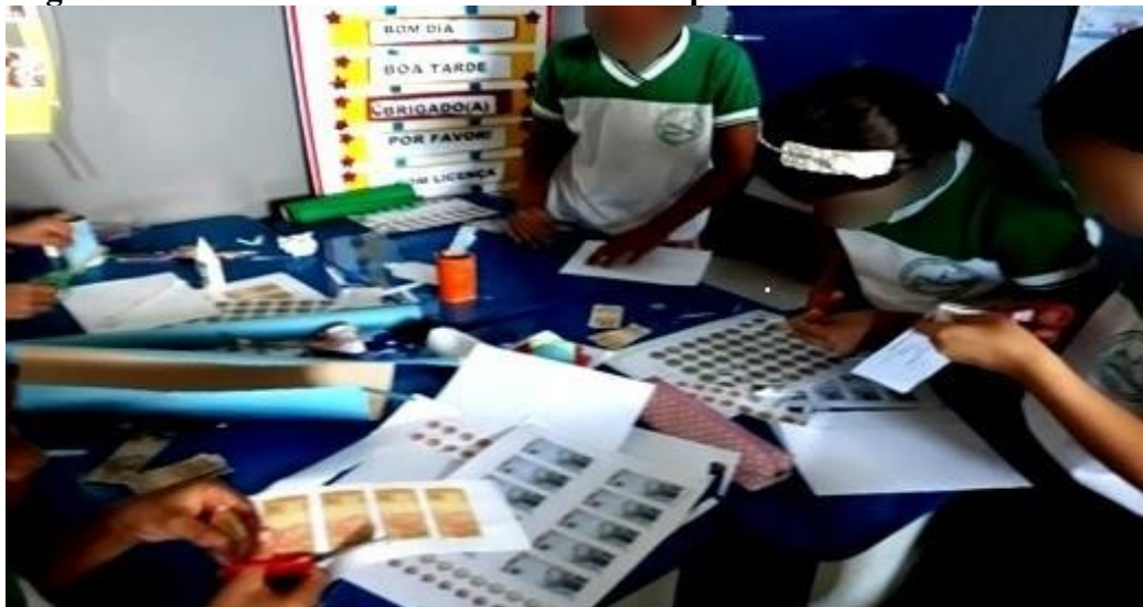
Figura 10 - Alunos Recortando o “Dinheiro” para ser utilizados na Feirinha

A professora comentou ainda que existe toda uma história que justifica a criação da data para que as mães sejam homenageadas no mês de maio. Entretanto na realidade, grande parte das pessoas costuma vincular a data ao comércio porque é uma forma de movimentar as vendas, mas não deixa de ser uma data especial e importante para as crianças e suas famílias. Com o início da aula em sala, a professora tratou logo de perguntar aos alunos sobre os materiais da feirinha cuja realização já estava próxima, ou seja, ela distribuiu os alunos, num total de 24, para organizarem seus materiais em departamentos que iriam trabalhar, bem como a distribuição do “dinheiro” que foi utilizado na Feirinha (Figura 10).