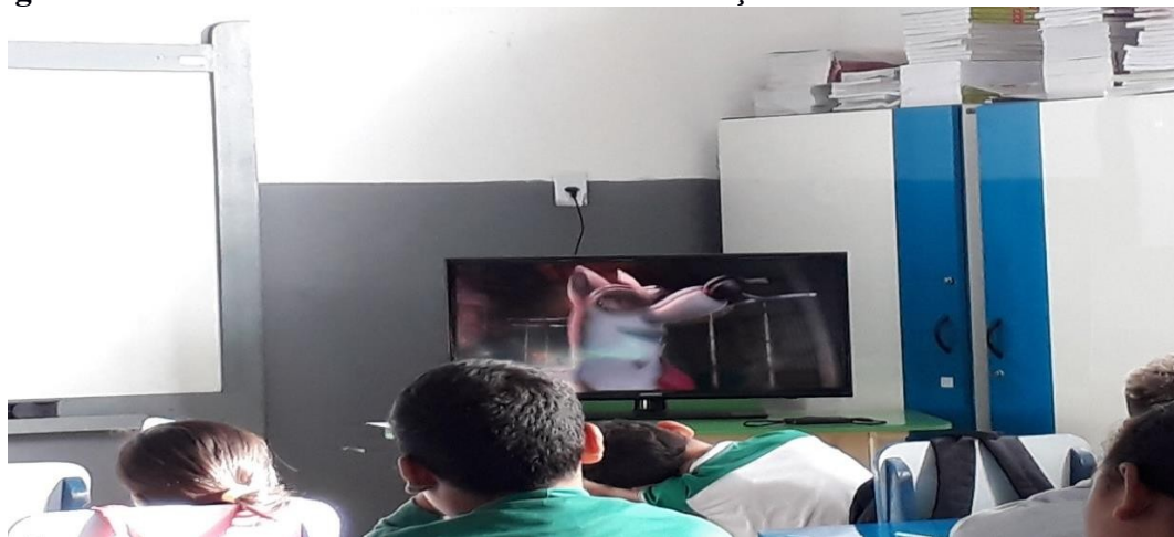
Figura 13 - Alunos do 5º Ano - Vídeo Para Realização de um Trabalho de História.

Comentários: Essa aula foi um pouco diversificada, não pela troca de professores e por esse sempre vir com o seu notebook, mas sim por conhecer a turma há um certo tempo e saber como trabalhar de forma diferente, buscando uma maior atenção e participação dos alunos nas suas aulas. Além da apresentação de vídeo para atividade da disciplina de História (Figura 13). Dessa forma a aula foi bem produtiva e conseqüentemente mais significativa para os alunos.