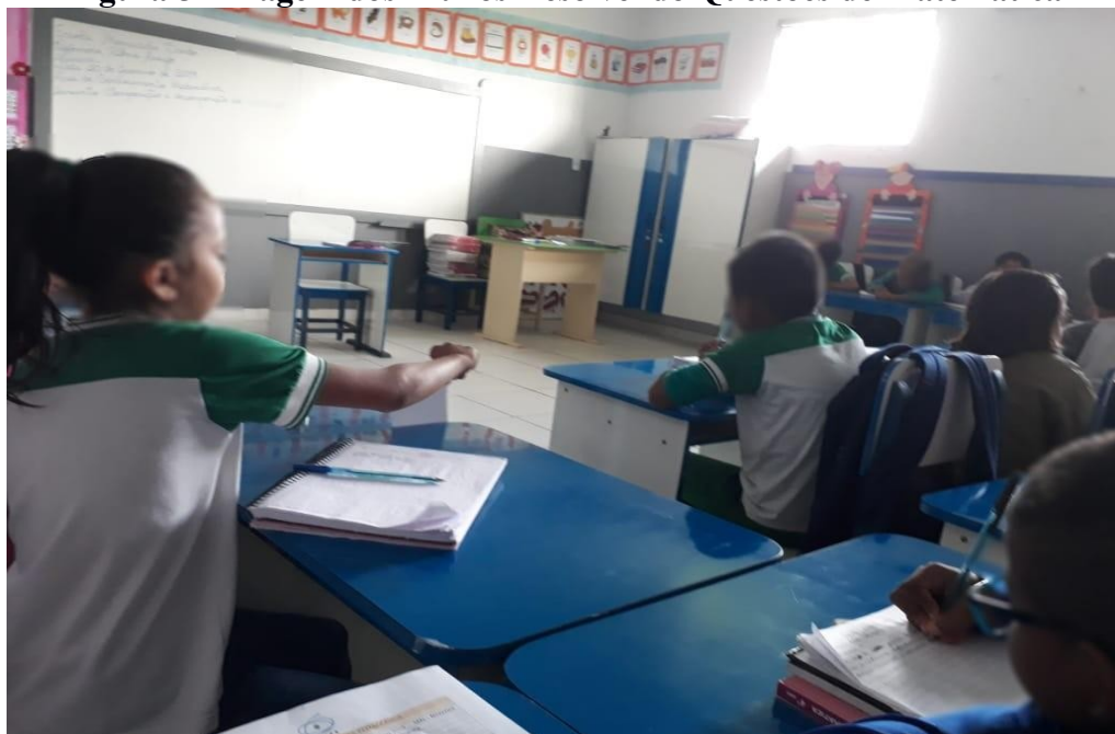
Figura 5- Imagem dos Alunos Resolvendo Questões de Matemática

Algumas Experiências: A aula foi bastante produtiva, pois a professora desenvolveu atividades diversificadas e estimulou a participação dos alunos. Estes por sua vez, apesar de serem agitados e gostarem de conversar durante as aulas, sempre realizam as atividades que lhes são solicitadas. Aparentemente, quanto mais atividades práticas e diversificadas comporem aulas dessa turma, mais a aula se torna produtiva como verificamos na imagem os alunos desenvolvendo as atividades com os conteúdos de Matemática. Entretanto, a educadora sempre questionava com eles/as sobre obedecerem certas normas de condutas, como não ficarem em pé encima da cadeira, jogar papel no chão, alertando sempre que não estavam mais no 3 a ano, mas sim no 4 a ano (Figura 05).