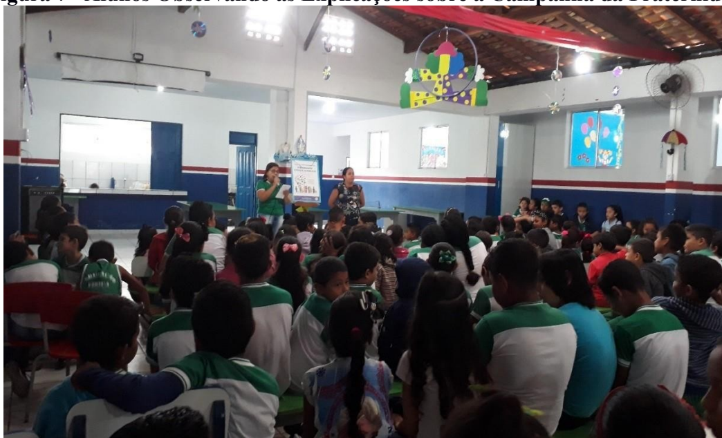
Figura 7 - Alunos Observando as Explicações sobre a Campanha da Fraternidade

No salão teve um momento ecumênico iniciando com uma oração da Campanha da Fraternidade, onde alunos e funcionários da escola participaram como sempre, orando e com uma professora discursando sobre o tema do dia (Figura 07).