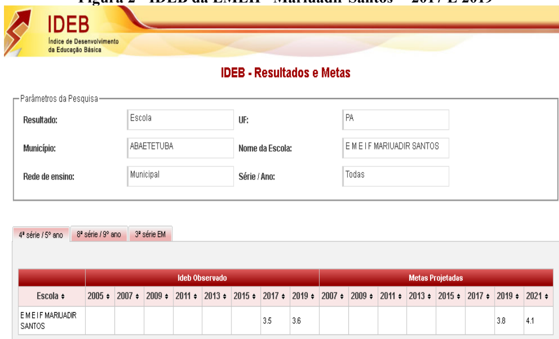
Figura 2 - IDEB da EMEIF "Mariuadir Santos"- 2017 E 2019