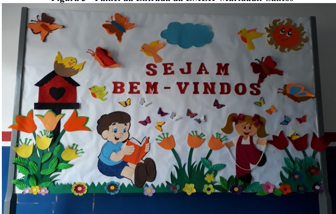
Figura 3 - Painel da Entrada da EMEIF Mariuadir Santos

Apresento, a seguir, relatos produzidos no contexto da pesquisa na prática do Programa Residência Pedagógica realizado na EMEIF Mariuadir Santos. Neste momento “Sejam Bem- Vindos” às experiências e reflexões como a mensagem de “Sejam Bem- Vindos” no mural da escola (Figura 3)