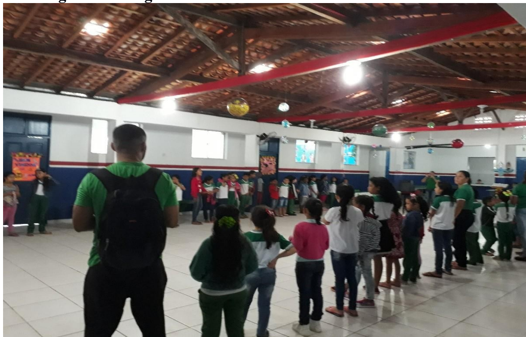
Figura 6 - Imagem do Encontro Diário dos Funcionários e Alunos

A aula de matemática inicia às 07hs: 20min e, como sempre, com um cabeçalho em que consta: nome da escola, nome da professora, nome do aluno, data do dia, mês e ano, da área de conhecimento e do assunto tratado. E hoje foi sobre unidades de comprimento, massa e capacidade, sempre trabalhando com o livro: O Burti mais matemática , que é “[...]um projeto que visa a formação integral do aluno, trazendo uma proposta adequada às exigências da BNCC e aos desafios da implantação, este livro é bem organizado com uma proposta desafiadora, que reflete o cotidiano, sempre valorizando a formação integral do aluno como cidadão do mundo”. Ela explica detalhadamente que as dificuldades das crianças são com as frações, trabalhadas tanto na adição quanto nas subtrações. Também pude observar que sempre ocorre um encontro diário entre os funcionários, colaboradores e os alunos da EMEIF Mariuadir Santos conforme a ilustração da Figura 6.