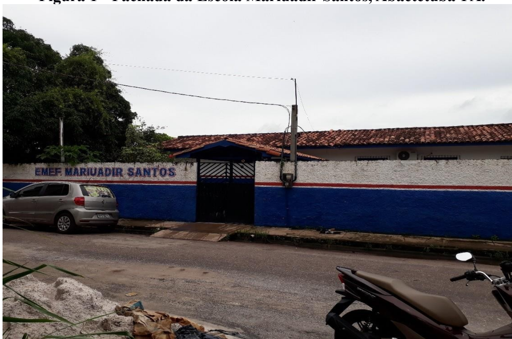
Figura 1 - Fachada da Escola Mariuadir Santos, Abaetetuba-PA.

A Escola Municipal de Ensino Infantil e Fundamental Mariuadir Santos está localizada na Rua Maximiano Cardoso, no bairro de Santa Rosa, na cidade de Abaetetuba, no Estado do Pará (Figura 1).