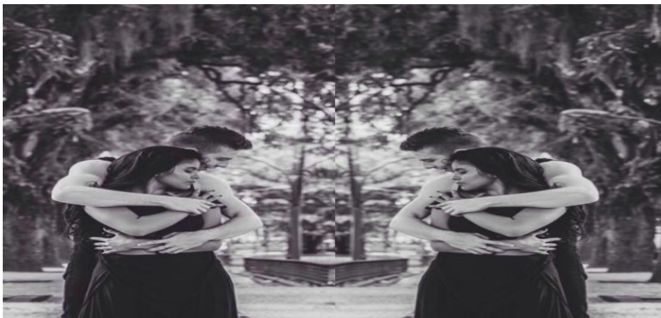
Figura 18: Projeto entre Ruas