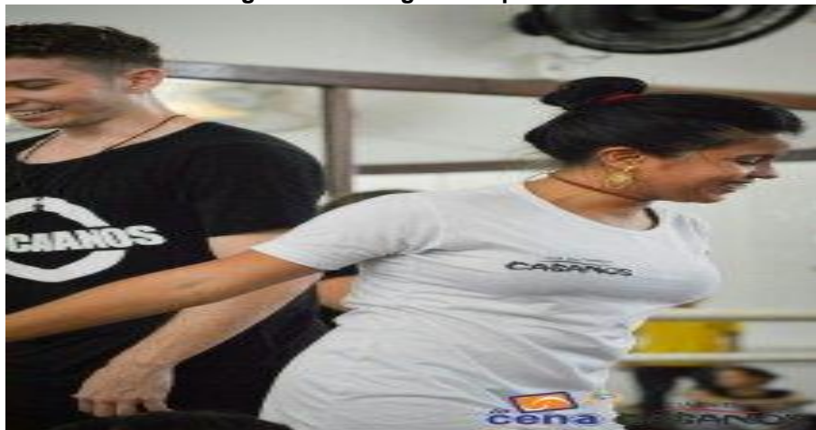
Figura 16: Diálogo entre parceiros