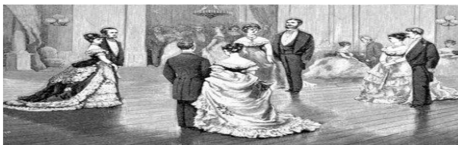
Figura 4: História da dança de salão