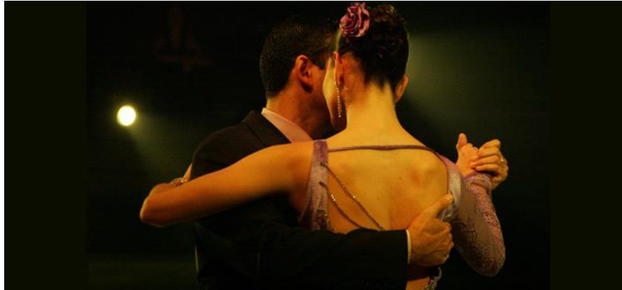
Figura 9: estrutura do Abraço

encaixe, não há fórmula e sim apenas uma troca muito prazerosa de se ver, que agem com naturalidade, um pouco diferente da dança de salão, que de acordo com cada ritmo da dança de salão o abraço ganha outras dimensões.