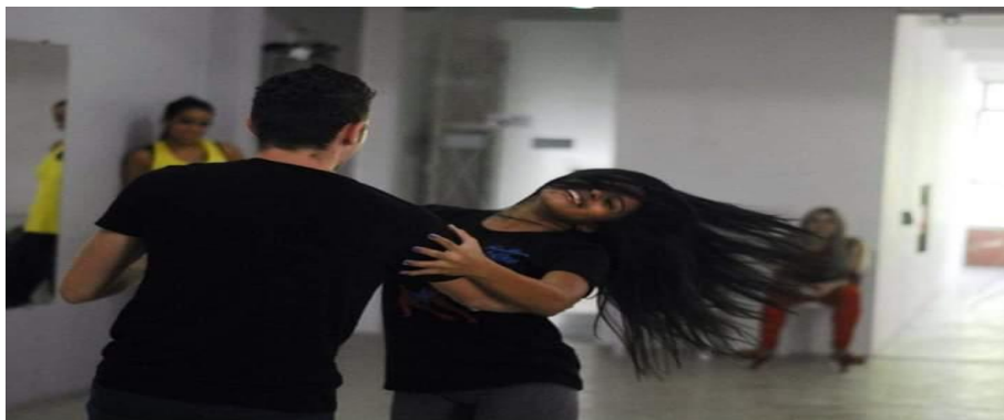
Figura 7: Improviso de samba

Então gostaria de ser eu mesma e transmitir tudo que me toca para o outro corpo independente da fórmula. Dançar a dois significa trocas vivas de energias simultâneas, que exalta a alma e emoções.