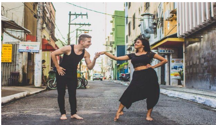
Figura 14: Projeto Entre Ruas