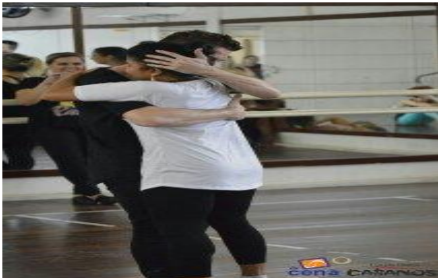
Figura 8: Abraço