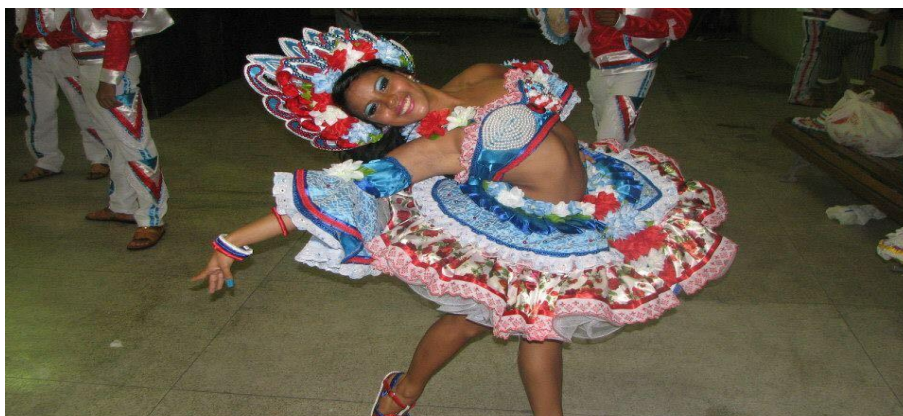
Figura 2: miss caipira quadrilha encantos do Pará.

Outro momento de minha caminhada, foram às manifestações populares paraenses, dentre as quais ressalto duas grandes comemorações: o carnaval belenense e os festejos juninos como miss caipira na quadrilha encantos do Pará, onde meu pai era um dos responsáveis, como também, no bloco carnavalesco Encantos do Pará pertencente ao meu pai que até hoje participo, junto com minha família.