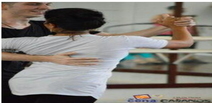
Figura 3: Condução entre parceiros