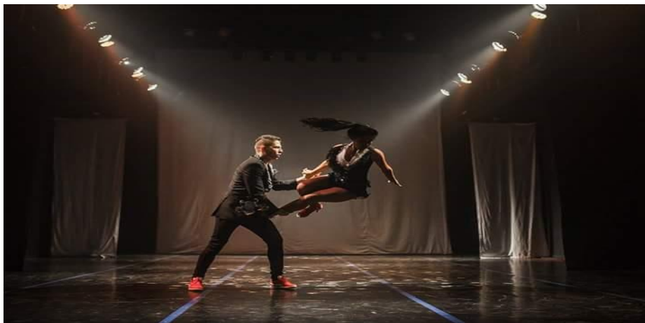
Figura 17: Samba- tamborim