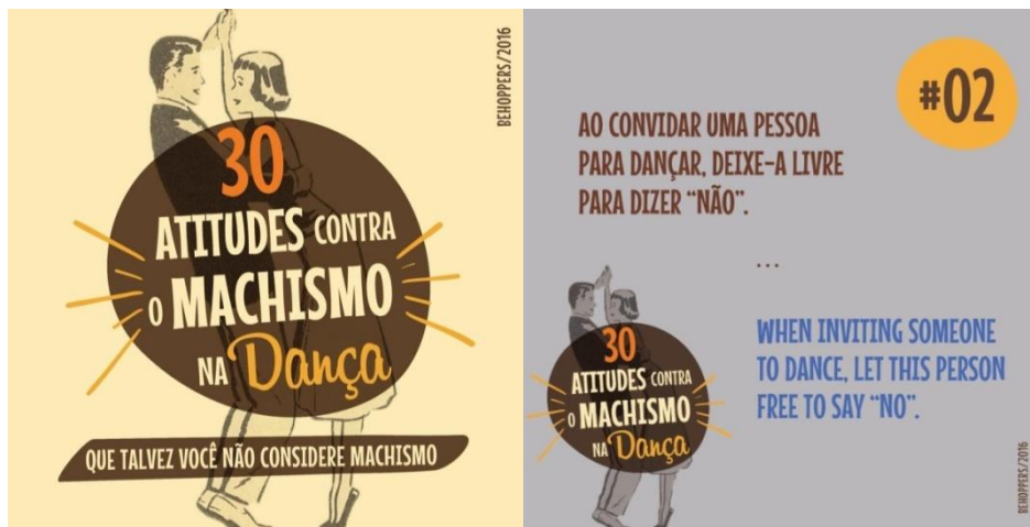
Figura 15: Campanha contra machismo na dança