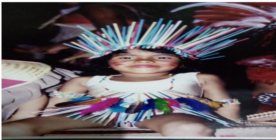
Figura 1: Coreografia índias